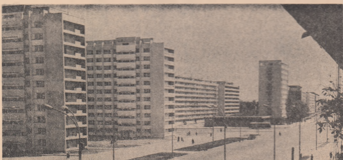
Astăzi, pe Magistrala Nord-Sud din Capitală

● Printre unitățile economice din regiunea Dobrogea care au anunțat îndeplinirea angajamentelor reînnoite luate în cîntărea Congresului partidului se află și Fabrica de ciment din Medgidia. Colectivul acestei unități a realizat peste planul la 3 000 tone cîmcher și 7 500 tone ciment de bună calitate.