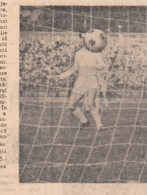
Goal! Meciul C.S.M.S.-Iaşi a încheiat din 11 m.

În acelaşi timp, la Constanţa, Dinamo jucînd cu o echipă ameninţată de retrogradare, avea desigur mai puţine speranţe într-o victorie. Dar Farul a jucat dezordonat, a dominat o bună parte din timp însă sterili, cu suturi fără adresă şi evident că de această situaţie Dinamo a ştiut să profite. Nu încercăm să diminuăm cu nimic victoria golurii meritată a dinamoviştilor însă aceasta a fost facilitată şi de portarul constanţean Plică care a primit goluri perfect parabile ca un începător. Dinamo nu a reuşit să înscrie goluri din acţiuni frumoase în schimb a marcat din faze în care portarul putea să-şi arate prezenţa. Lupta pentru evitarea retrogradării a rămas să fie elucidată în ultima etapă. Minerul Baia Mare a trecut peste un hop foarte dificil, întrecînd Ştiinţa Craiova. Acum va aborda cu mai mult calm jocul de la Arad. În acelaşi timp, Progresul Bucureşti (după ce a realizat un meci nul cu Ştiinţa Cluj) şi Ştiinţa Craiova şi-au legat toate speranţele de partida directă care se va disputa duminică la Craiova. Farul nu a putut să cîştige un joc care era hotărîtor pentru salvarea sa. Este greu de presupus că va reuşi această duminică la Iaşi unde nici situaţia C.S.M.S.-ului nu va fi prea roză în eventualitatea unui eşec.