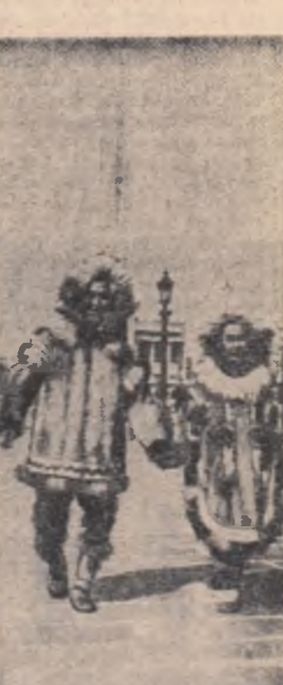
Locuitorii Parisului au fost uimiți în tinutul său cu un cuplu de eschimoși îmbrăcați în haine de blană în ciuda caniculei. Ei sînt dansatori excelenți și vor prezenta în capitala franceză un spectacol de iolcor. În fotografie: cuplul de eschimoși în Piața Concorde

Joi a avut loc la Alger o reuniune extraordinară a Comitetului de pregătire a celei de-a doua Conferințe a Țărilor din Asia și Africa. După sesiunea, un purtător de cuvânt al ministerului algerian al Afacerilor Externe a anunțat că reuniunea ministrilor afacerilor externe, programată pentru 24 iunie, a fost amânată pentru a doua oară, urmînd să aibă loc la 26 iunie. Inițial s-a anunțat amânarea cu 24 de ore a reuniunii ministrilor de externe dar Comitetul de pregătire, întrucît din inițiativa delegației germane, a stabilit joi ca reuniunea să aibă loc la 26 iunie. Purtații au spus că purtătorii de cuvînt, în vederea participării la reuniunea ministrilor afacerilor externe au fost reprezentanți din 31 de state afro-asiatice.