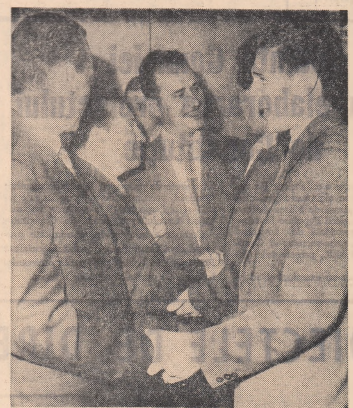
Au trecut deceniile, și ei au trecut prin mule încercări, toate se cîștea pe tejele marelui. La fel de tînră, a rămas însă sentimentul prieteniei și bucuria revederii o nemsurată...

Competiția se desfășoară sistem turneu, în zilele de 26 și 27 iunie.