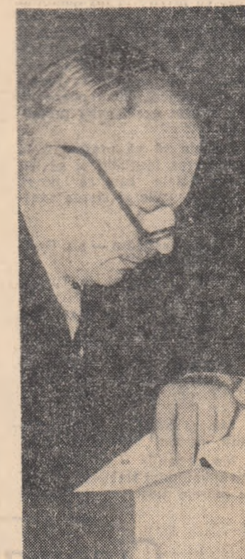
Catalogul se citește după... 20 de ani! Acum două decenii chipul profesorului și stătuțurile sale impuneau un tot așa de mare respect, ascultare

— „Ce ești acum, tovarășe? întreba din nou profesorul. Muncitor de înaltă calificare... tehnic