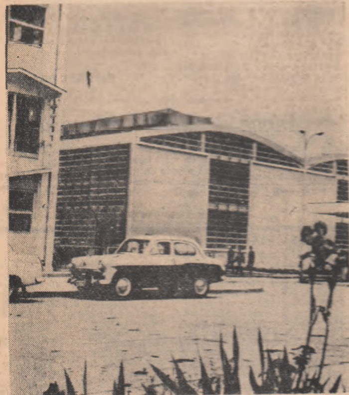
Vedere parțială a Uzinei de metale și aliaje neferoase din Capitală