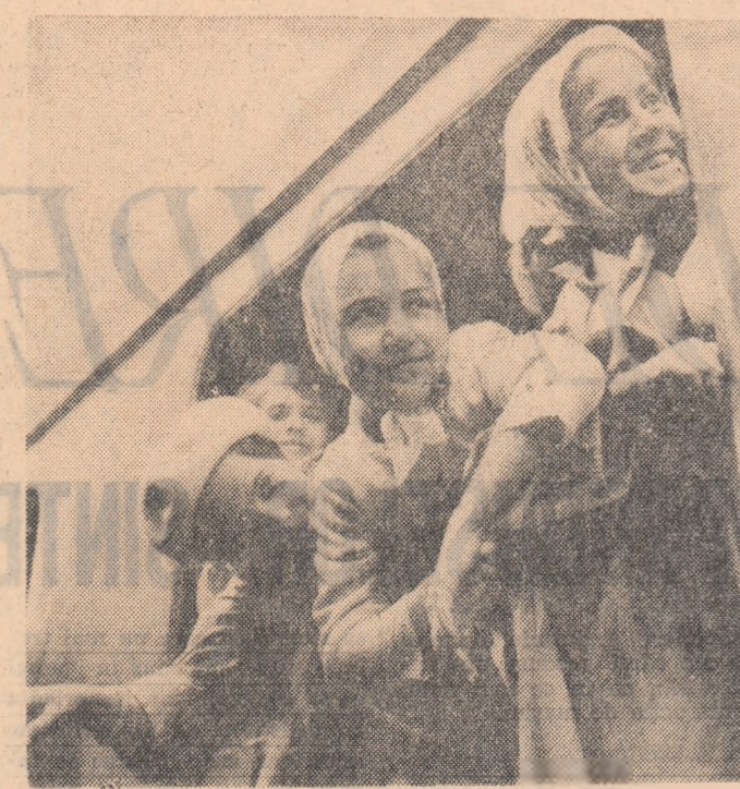
Navodarii sînt încă departe. Dar chiar de la plecare, gîndul la trumusețea zilelor pe terne pe chipurile celor care se îndreaptă către vestita tabără de pe malul mării, zîmbete de bucurie. Fotoreporterul, prezent în Gara de Nord la plecarea celor 850 de pionieri din prima serie, vă oferă, printr-un

Ca un înalt omagiu adus ilustrilor profesori, Universitatea din Cluj a organizat o expoziție unde sînt expuse fotografiile, precum și numeroase lucrări care oglindesc munca și activitatea lor en-