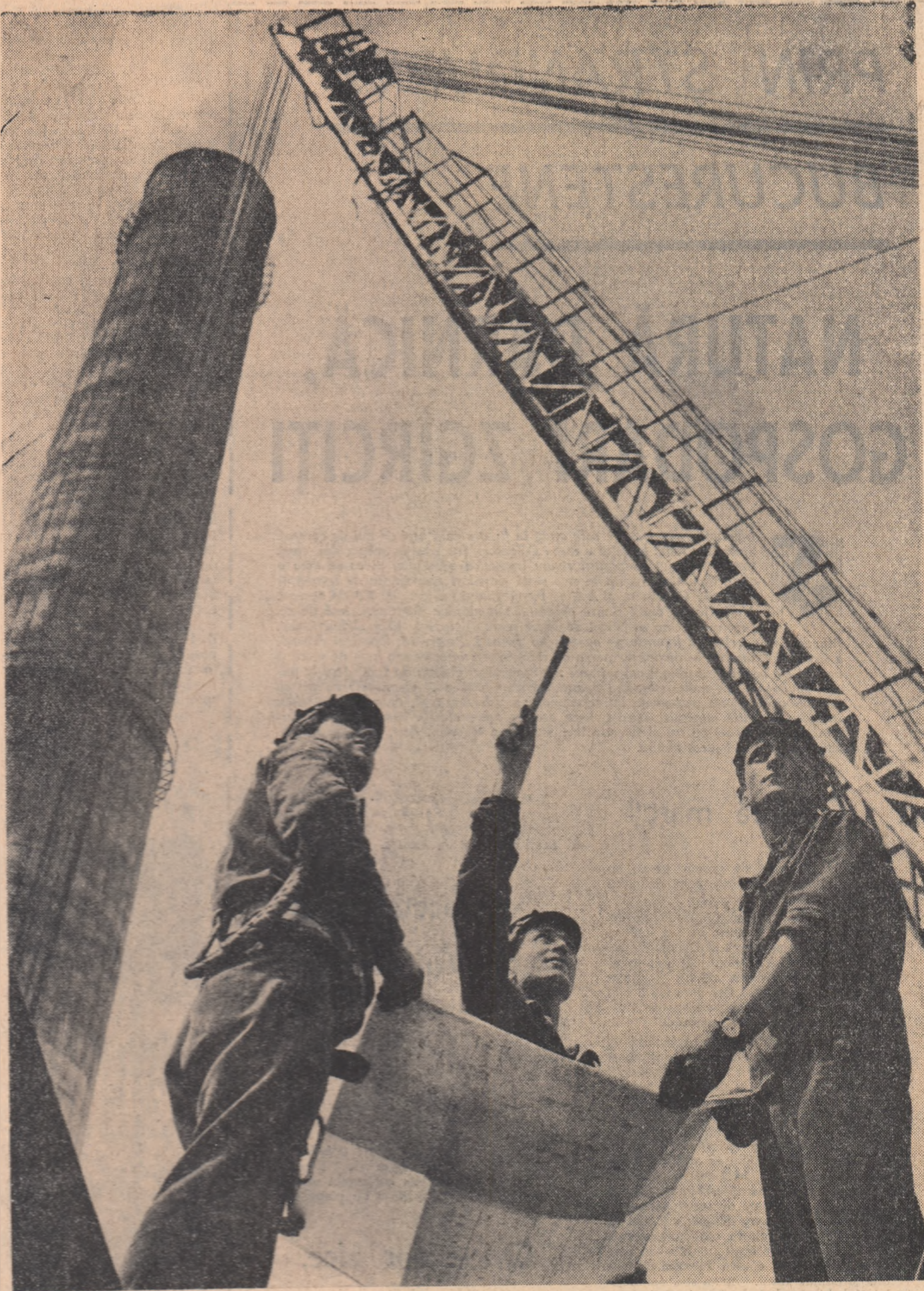
Pe șantierul termocentralei Craiova

unui suitor de cercetare între orizonturile 350 și 400 etc. PLOIEȘTI . — Sondorii din cel mai vechi bazin petrolifer al țării, Valea Prahovei au îndeplinit planul pe primul semestru al anului. Ei au dat peste prevederi importante cantități de țitei, gazolină și gaze de sondă. O dată cu îndeplinirea planului, petroliștii și-au îndeplinit și angajamentul luat în cinstea Congresului partidului de a livra raminărilor țitei în cantitățile cerute și cu impurități sub procentul admis și de a realiza economii la prețul de cost în valoare de 3 milioane lei. (Agerpres)