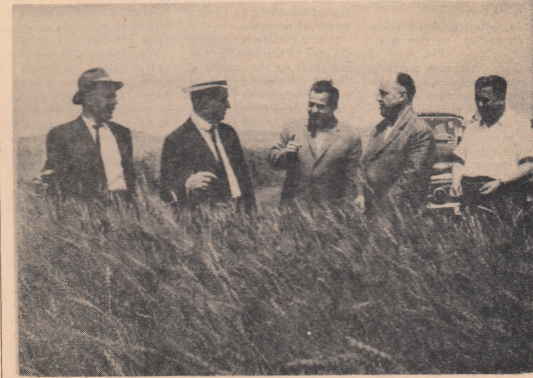
În lanurile de grâu ale cooperativei agricole de producție din comuna Gheorghe Doja