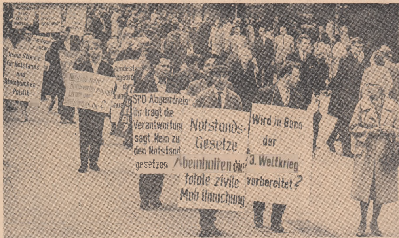
R. F. GERMANA: in urma repetatelor demonstratii care au avut loc in numeroase orase si a opozitiei social-democratilor in Bundestag „legile exceptionale” nu au putut fi deocamdata adoptate. In fotografie: aspect de la demonstratia desfasurata la Essen impotriva adoptarii legislatiei exceptionale.

Desi numeroase paturi ale populatiei sud-coreene se pronuntă impotriva tratatului japoano-sud-coreean, presedintele Jării, Pak Cijun Hi, a cerut guvernului și partidului democrat republican de guvernământ să depună toate eforturile pentru a se obține ratificarea urgentă a tratatului de către Adunarea națională.