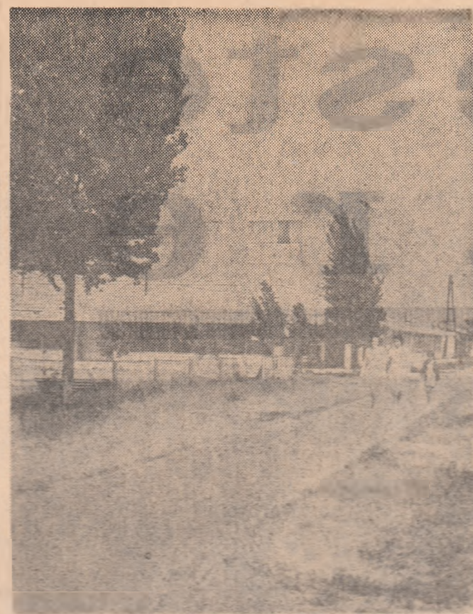
Maiaș, iunie 1955