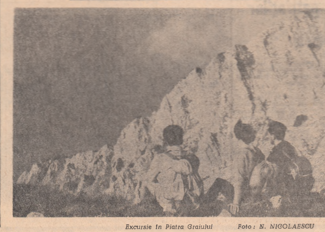
Excursie în Piatra Graiului

Sub emblema Palicanului, alb au fost prezentate în competiție un număr de 7 filme artistice, dintre care 4 în premieră și 24 filme de scurt metraj: documentare, de știință popularizată, experimentale, reportaje și de desen animat, care au fost selecționate din întregul producție din anul an a studiourilor bucureștine.