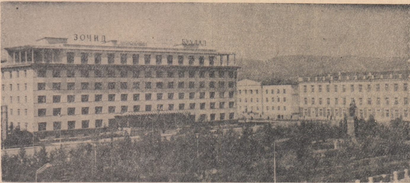
R. P. MONGOLĂ. Vedere din Ulan Bator

Autorul articolului subliniază că această situație este in primul rînd consecința „extinderii războiului in Vietnam de către Johnson și in intervenției sale masive in Republica Dominicană. Inaintea acestor două evenimente alianța occidentală resimțea numai presiunile și întreaga însoțire pe care o presupune sfîrșitul dependenței europene postbelice față de Statele Unite”.