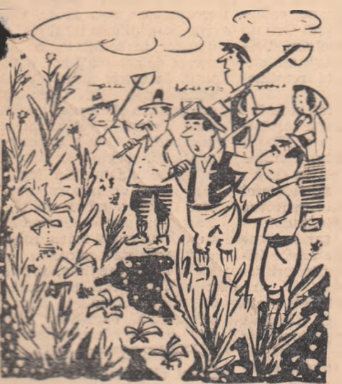
— Acum să ve ved! Cine ghiceste unde s-a așezat porumbul? Desene de NEAGU RADULESCU