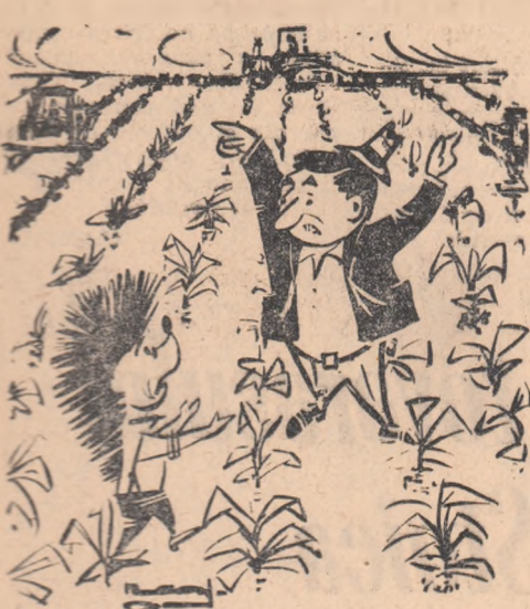
— Val, se poate? Îi trebuie porumbului trei prășiri? De acord! Privește: un tractor — o prășie, alt tractor — altă prășie, al treilea tractor — a treia prășie.