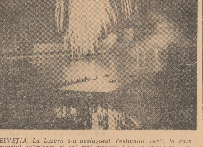
ELVEȚIA. La Luzern s-a deslășurat Festivalul verii, la care punctul culminant și cel mai atractiv l-au constituit locurile de artificii