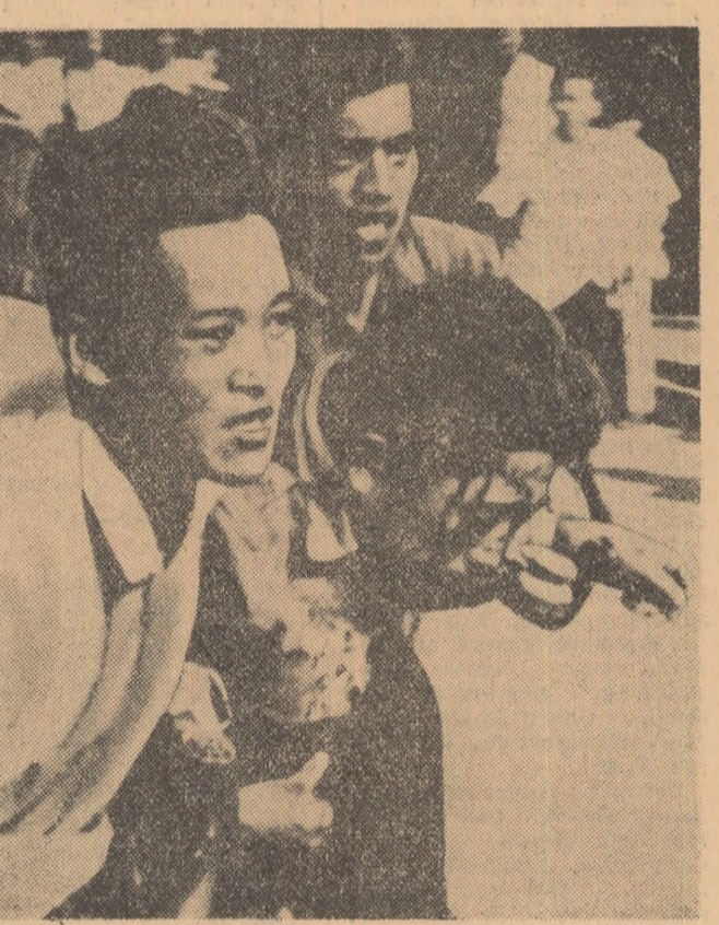
COREEA DE SUD. Aspect de la o recentă demonstrație studentescă împotriva stabilirii de relații diplomatice cu Japonia