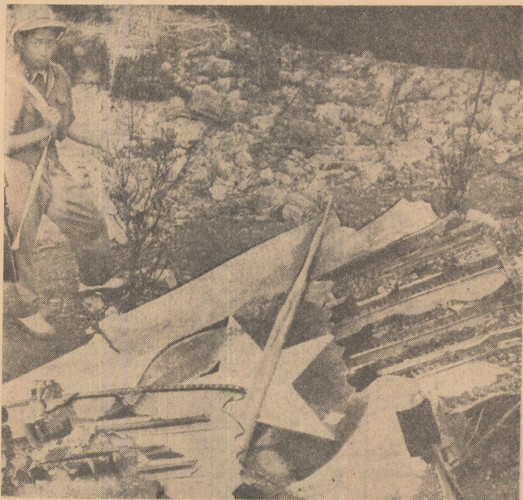
Forțele armate ale R. D. Vietnam au dobort sute de avioane americane și ale marionetelor sud-vietnameze. Iată, în fotografia noastră, un ostaș al armatei populare vietnameze examinează rămășițele unui avion american dobort recent în regiunea Vinh Linh.

După noaptea furtunoasă de la Bruxelles cind corăbiile Pieții comune păreau să se înceapă, apele se liniștesc. Revine calmul, declarațiile pierd treptat nota tăioasă din primele ceasuri și, prudent, se încearcă reînnoirea firelor tăiate în furia eșecului. „Cei șase” n-au fost și nici nu vor putea fi vreedată o familie armonioasă. Dar, opinează New York Times, ei „au prea multe în joc pentru a îngădui ca Piața comună să se destrame sau să stagneze”. După ce reprezentanții Parisului au făcut publică intenția de a absenta la reuniunile organismelor economice occidentale, politica „scaunului gol” a inspirat pronosticuri sumbre la adresa viitorului Pieții comune. „Scaunul gol” n-a însemnat, totuși, abandonarea definitivă a scaunului.