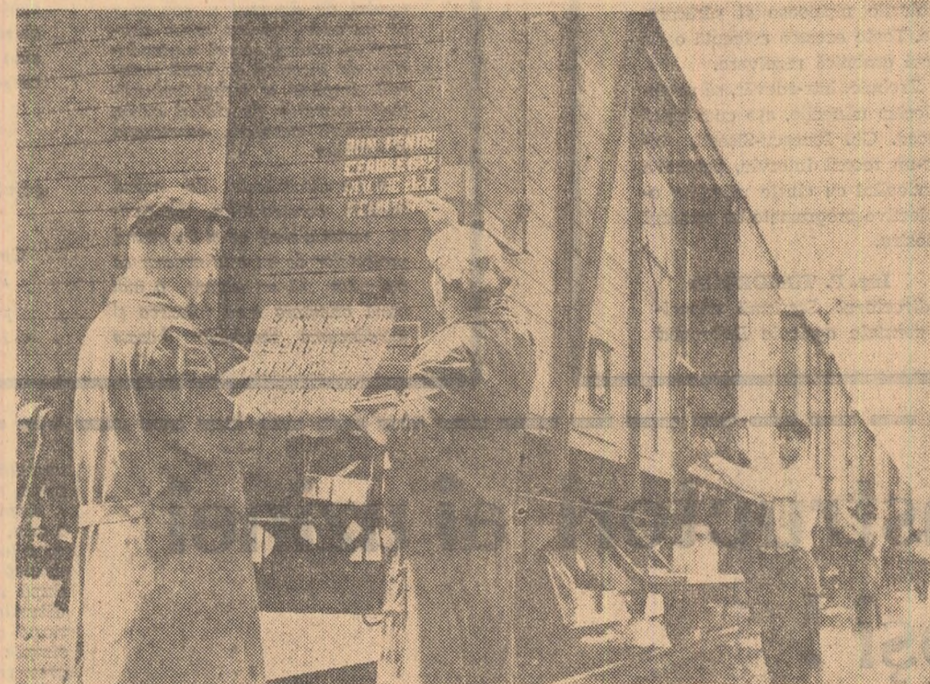
La Revizia de vagoane din stația București-Triaș, lucrările de etanșare, noi vagoane destinate transportului de cereale se desîșoară din plin.

In finale a multor echipe divizionare (toate cele 7 din seria A). Nivelul tehnic a fost bun — ceea ce arată încă odată că studenții au un cuvînt greu de spus în handbalul nostru. Dorișta echipelor de a ocupa un loc fruntaș, a făcut ca toate meciurile să sîmbă „miză”, să fie spectaculoase și îndrăgite. Pentru preocuparea spre un joc modern în spiritul concepției românești în handbal, așa evidențiază echipele București I, Galați, Timisoara și Petroșani (la băieți) și București I, Timisoara (la fete). — V-am văzut azi la meciul Iași — Cluj. Ce impresie v-a lăsat? — O întîlnire de mare luptă, în care ieșenii, deși condusți în prima repriză, au refăcut și au învins la 3 puncte diferență. Clujenii au pierdut datorită atacului, care nu le-a mers,