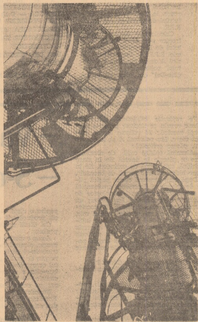
Instalația de olefine de la Combinatul petrochimic-Brazi.