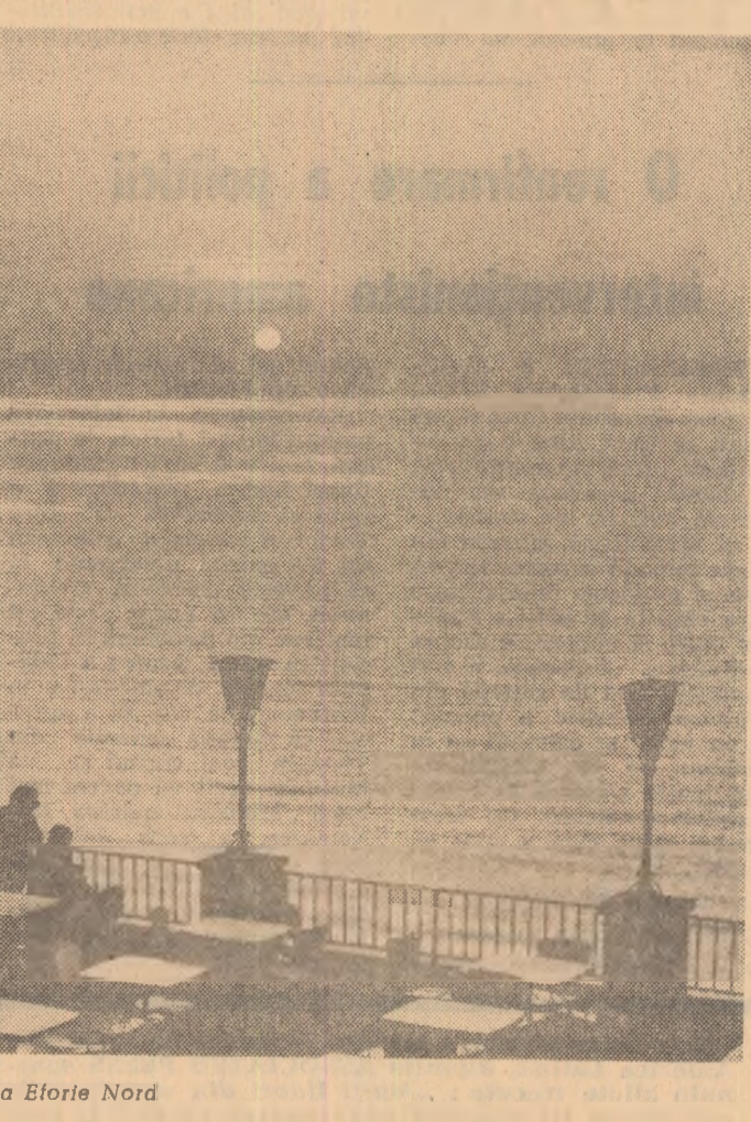
Rasarit de soare la Eforie Nord

Impetuoasă dezvoltare a Capitalei patriei noastre va fi ilustrată în numeroase expoziții organizate de Muzeul de istorie a orașului București. Parcul Herastru, pavilionul A, va găzdui expoziția „Bucureștii în anii senenului”. Două expoziții