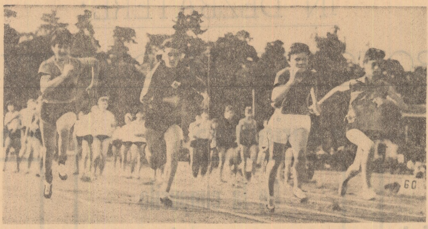
Start în proba de 60 m plot — junioare, disputată într-un concurs care a avut loc recent pe Stadionul tineretului