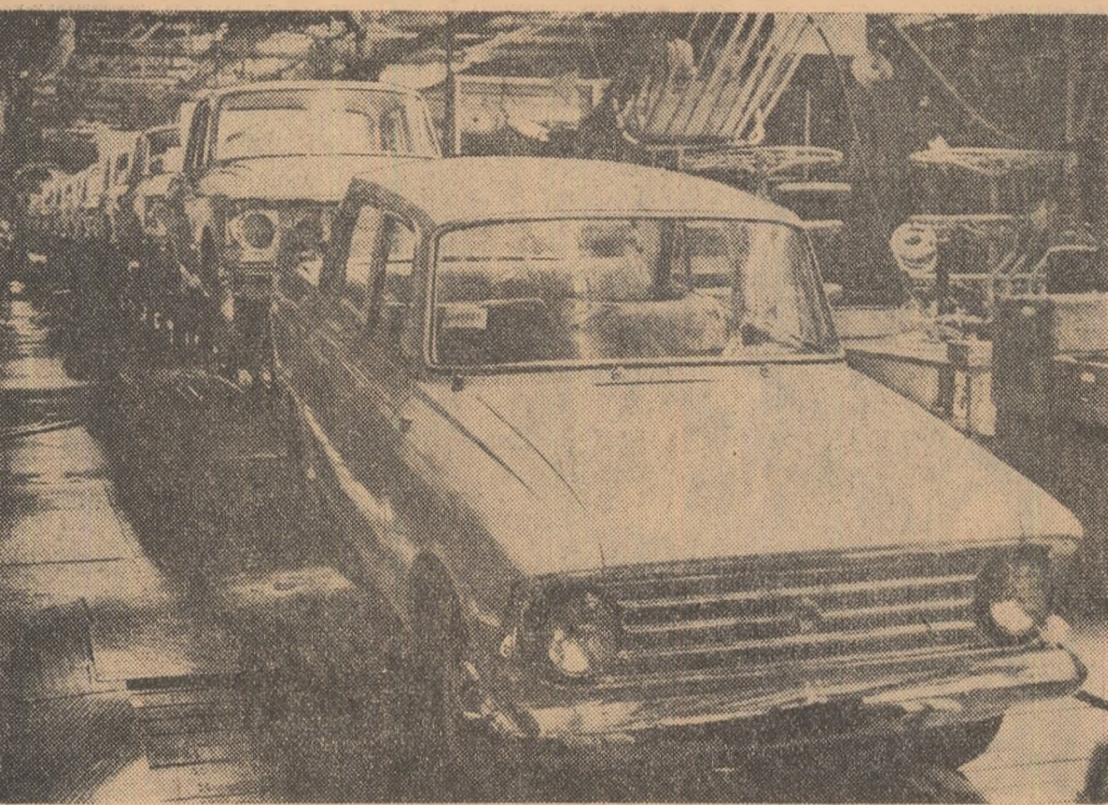
U.R.S.S. Uzina de automobile din Moscova a trecut la producția în masă a noului model de automobil „Moskvici-408”. În fotografie: noul automobil pe banda de montaj