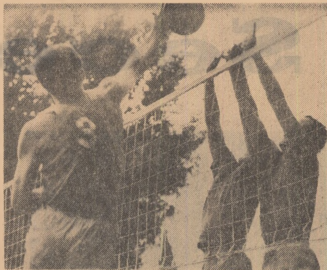
La filele voleibaliști studenți din Cluj și Brașov