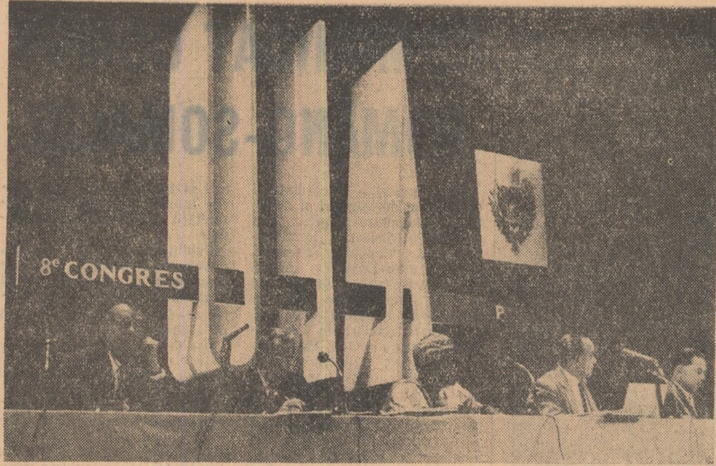
La Palatul Chaillot din Paris s-a deslășurat al 8-lea Congres internațional al arhitecților la care au participat 2.500 de arhitecți din întreaga lume, printre care și o delegație de arhitecți din R.P. Română. În fotografie: Președintele Congresului, din care a făcut parte și reprezentantul R.P. Române