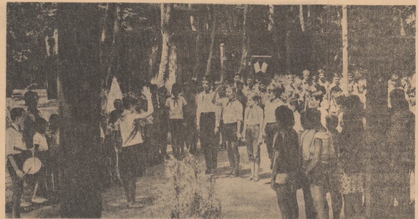
În Buda, pe malul Argeșului — o nouă zi de tabără — o fiid nouă în „cartea bucuriilor”

250 școli elementare, 18 teatre, 75 cinematografe, 22 muzee, 118 biblioteci etc. Expoziția „20 de ani al R. P. Polone”, reflectă prin intermediul filateliei imaginii din toate domeniile de activitate ale poporului prieten în cei 20 de ani de orînduire democrat-populară. Săliile pavilionelor mai găzduiesc expoziția consacrată vieții și creației lui Chopin și „Expoziția afișelor poloneze premiate în anul 1964”. La Casele de cultură din raioanele Nicolae Bălcescu, V. I. Lenin și 18 Februarie au fost amenajate standuri de cărți, fotomontaje, albume. Standuri asemănătoare, cuprinzînd tipăriți din R. P. Polonă, au fost amenajate și în bibliotecile din