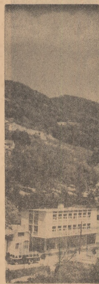
Vedere din Olănești (Complexul de deservire)