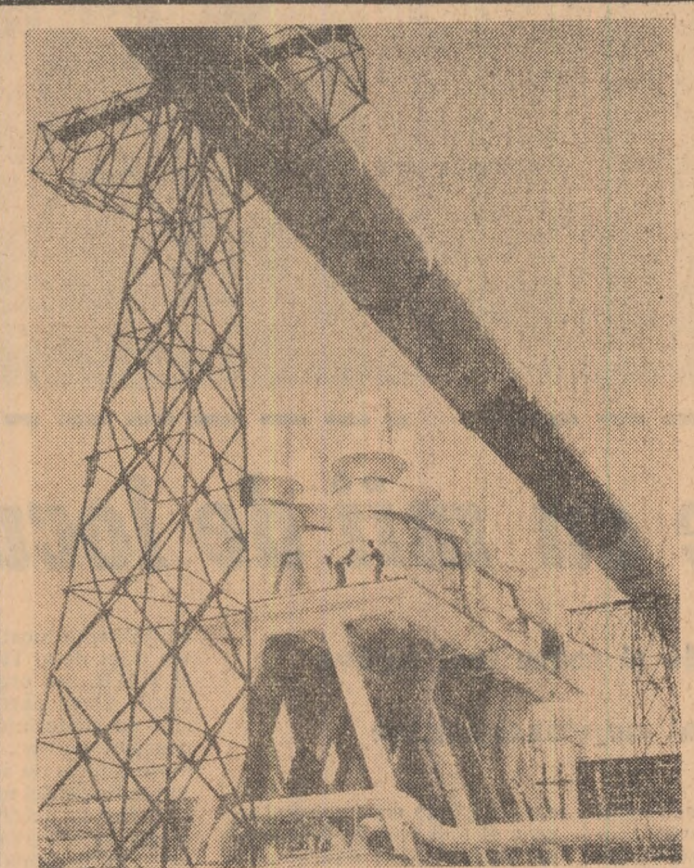
Instalația de purificare a apei la o fabrică de lojose din cadrul Combinatului de industrie lizăre a lemnului Pilești