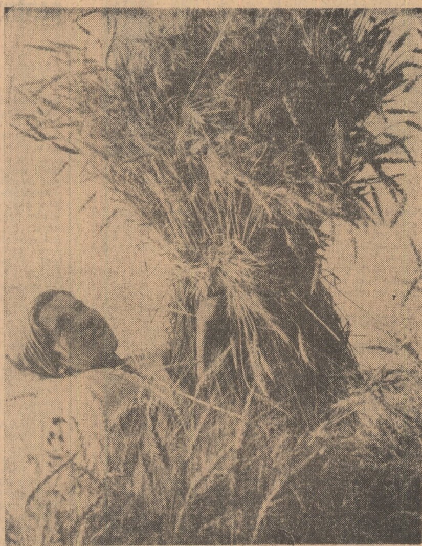
Red bogat la cooperativa agricolă de producție din comuna Șerbanesti, raionul Costești