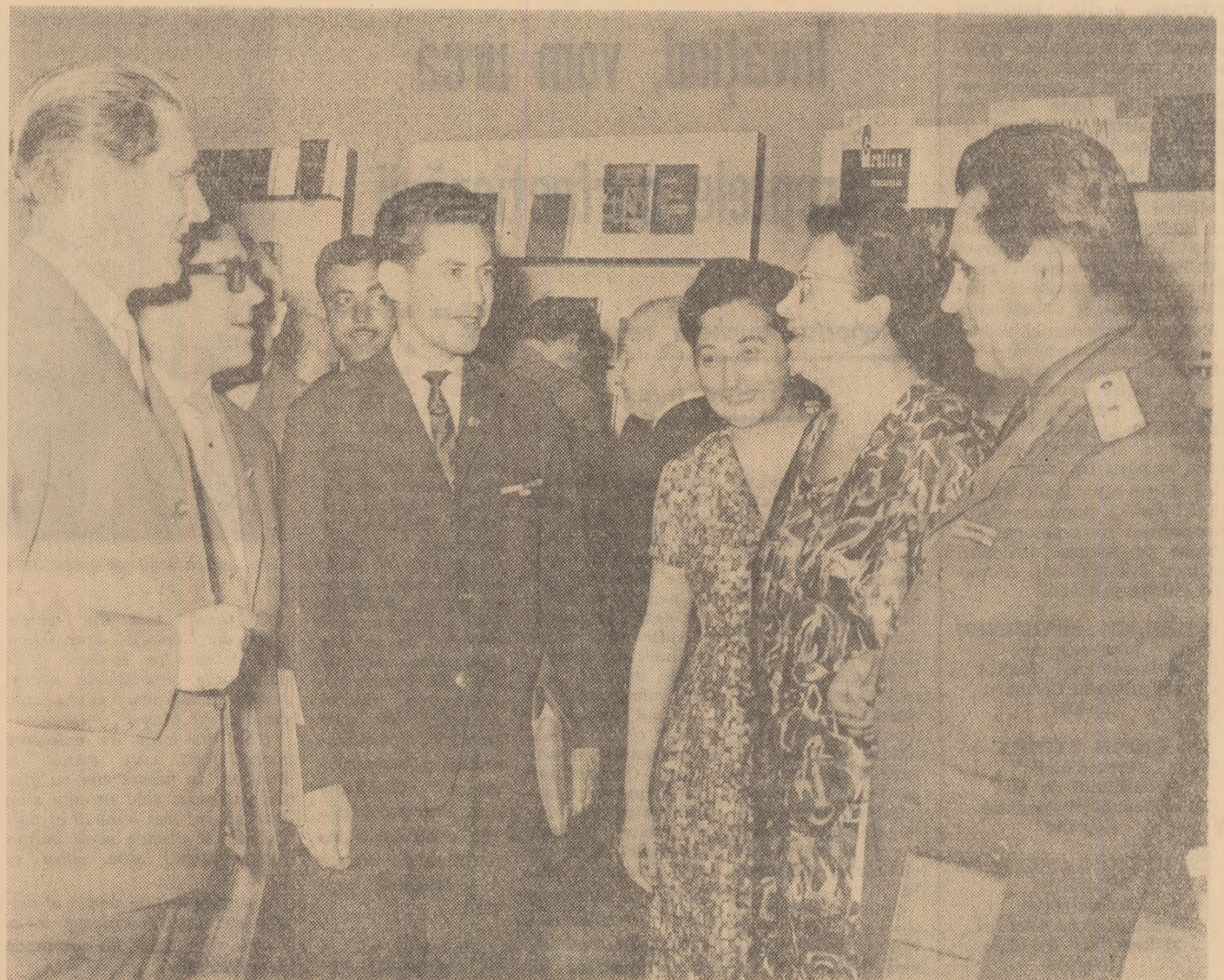
În timpul unei pauze a lucrărilor celui de-al IX-lea Congres al P.C.R.

În întreaga sa activitate, Partidul Comunist Român a fost purtătorul ideii de unitate politică și organizatorică a clasei muncitoare, a mișcării muncitorești, militînd consecvent pentru înfăptuirea acesteia. Rezultat al unirii Partidului Comunist Român cu Partidul Social-Democrat, — unire înfăptuită pe temelii în-