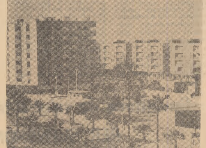
R.A.U.: Imagine din Port Said

stăzi se sărbătorește ziua națională a Republicii Arabe Unite. În această zi se împlinesc 13 ani de la revoluția care la 23 iulie 1952 a dus la răsturnarea monarhiei. Pentru poporul egiptean a început atunci o epocă nouă, epocă dezvoltării economice și politice independente a țării. Răsturnarea monarhiei a însemnat încununarea luptei îndelungate duse de poporul egiptean împotriva dominației colonialiste, pentru libertate și independența națională.