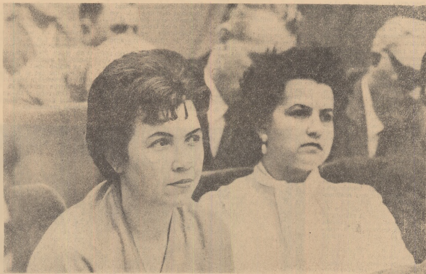
Delegații urmăresc cu atenție și viu interes lucrările Congresului