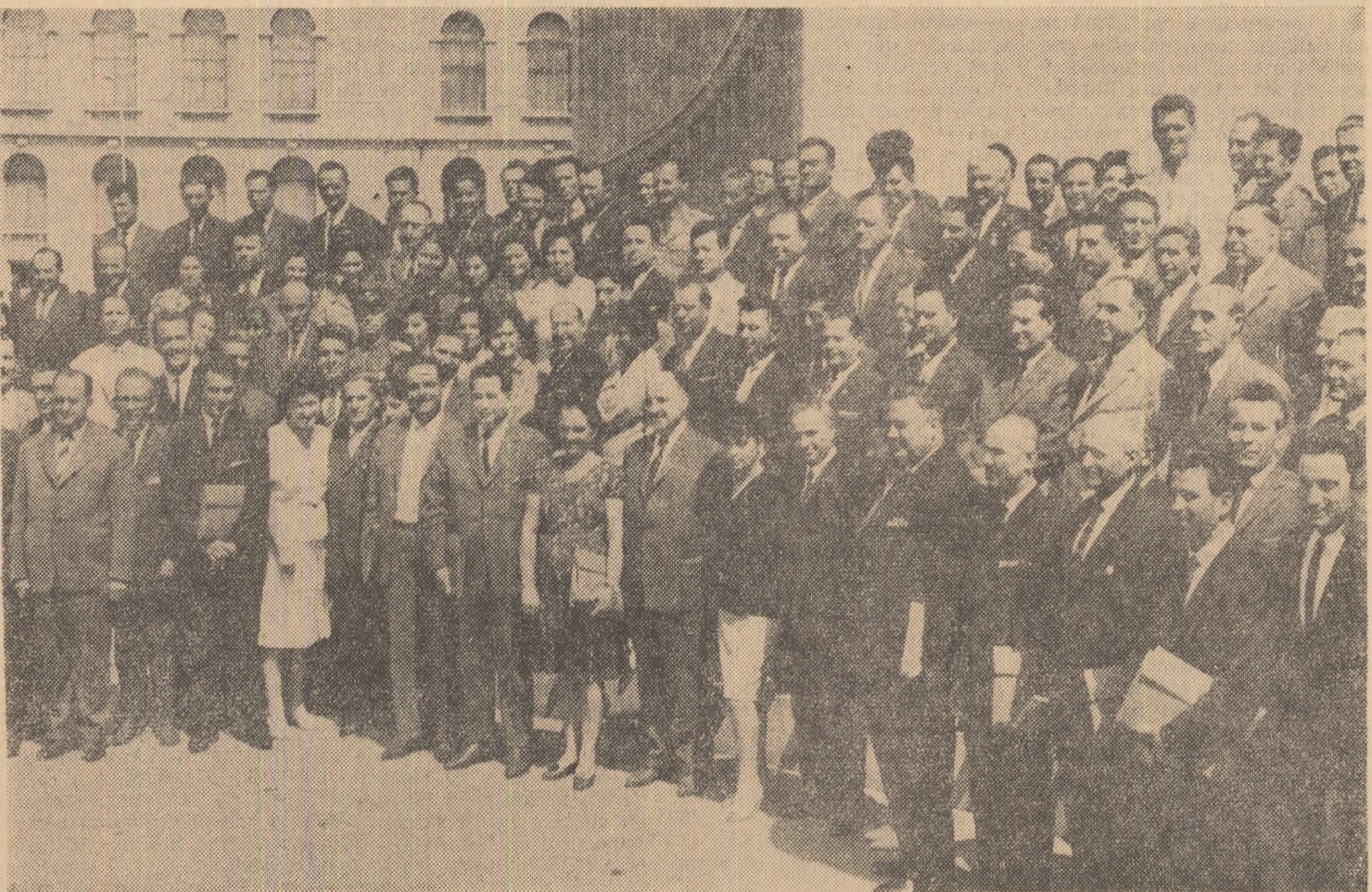
Un grup de delegați din regiunea București

Și noi, istoricii, fii ai aceleiași țări, români, maghiari, germani și de alte naționalități, suntem pe deplin convinși de nevoia continuării asidue a cercetărilor în ogorul istoriei patriei, de obligația noastră morală de a aprofunda și largi atitea aspecte din trecutul nostru încadrînd istoria României la locul ce i se cuvine în complexul lumii universale.