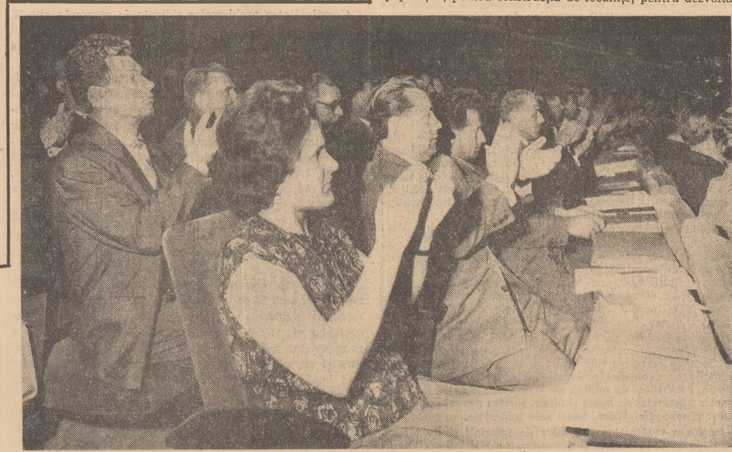
Delegații urmăresc cu atenție și viu interes lucrările Congresului