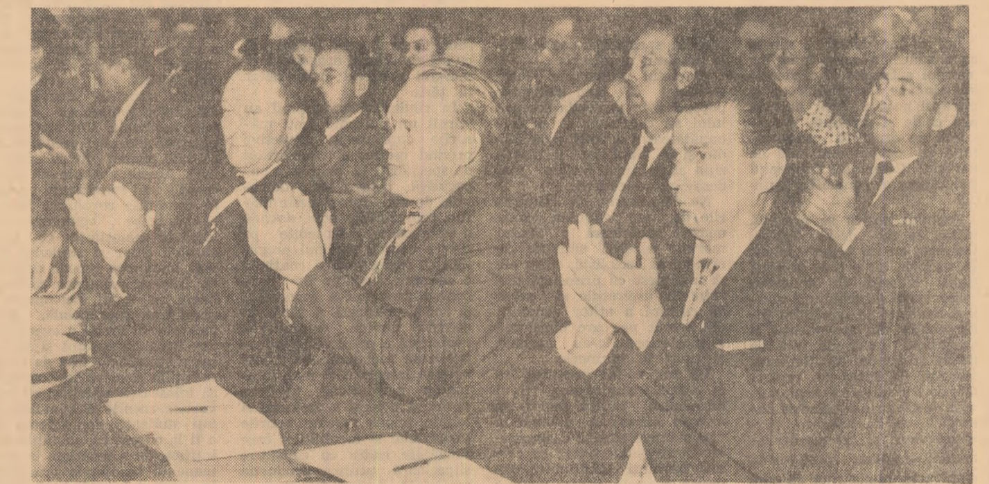
În timpul lucrărilor Congresului

Această politică de agresiune încalcă drepturile popoarelor, loveşte lagărul socialist, ameninţă pacea. Ea trebuie blocată. În documentele noastre afirmăm că lupta pentru pace este astăzi strîns