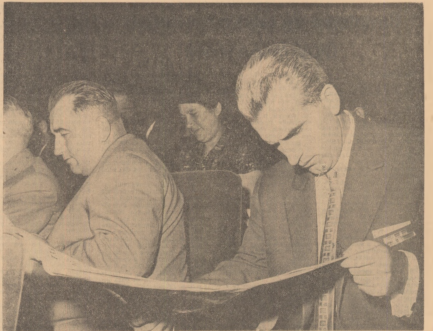
Un grup de delegați din regiunea Iași

Mi-a umplut inima de bucurie aprecierea caldă și plină de grijă făcută în Raportul Comitetului Central asupra activității pe care o desfășoară cadrele didactice de pe întreg cuprinsul scumpei noastre patrii. Această apreciere ne dă un nou îmbold în muncă noastră, care, însemnată aplicarea lor solicită, după părerea noastră, urgentă de către Ministerul Învățămîntului a măsurilor necesare pentru eliminarea din programele de cursuri a paralelismelor, a tot ceea ce este depășit, inutil, pentru că în procesul de învățămînt accentul principal să cadă pe însușirea problemelor fundamentale ale științelor, pe cunoașterea aspectelor sale moderne. Mai ales pentru studenții din institutele tehnice se simte necesitatea ca odată cu pregătirea teoretică de înalt nivel, să li se asigure și cunoștințe economice, de planificare, organizare și conducere a producției, să se continue acțiunea de modernizare a laboratoarelor și de largire a surselor de informare puse la îndemna lor. De asemenea, credem că ministerele și departamentele ar trebui să asigure efectuarea practicii tuturor studenților în unitățile dotate cu tehnica modernă, care realizează rezultatele cele mai bune în activitatea de producție și eco-