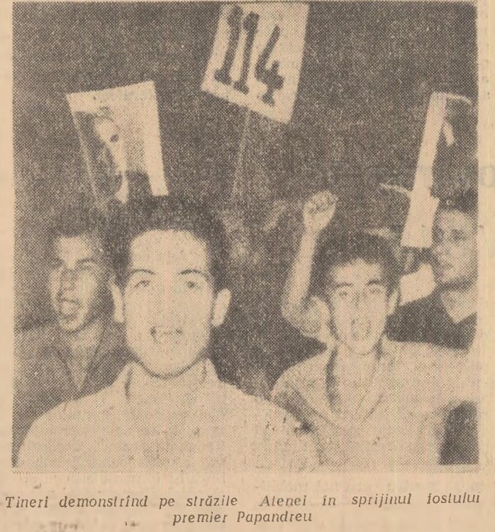
Tineri demonstrînd pe străzile Atenei în sprijinul fostului premier Papandreu

• În prima zi a turneului internațional de fotbal care loc în orașul Gottwaldov (R. S. Cehoslovacia) și la care participă selecționatele mai multor țări europene s-au înregistrat rezultatele: Praga — Viena 7—2 (5—1). Cele mai multe puncte ale învingătorilor au fost marcate de Sniok (4). Buda-pesta—Gottwaldov 7—0. • Mecuriile disputate în cea de-a treia zi a turneului internațional de polo pe apă, care se desfășoară la bazinul Dinamo din Capitală, s-au încheiat cu următoarele rezultate: R. P. Română — Suedia 9—2 (2—1, 1—1, 2—0, 4—0); R. P. Ungară — R. S. Cehoslovacă 5—1 (2—1, 2—0, 1—0, 0—0); R. D. Germană — R. P. Română (finer) 3—2 (0—0, 1—0, 0—0, 2—2). În clasament conduc, neînvins, echipele R. P. Române și R. P. Ungare cu cîte 6 puncte fiecare. (Agerpres)