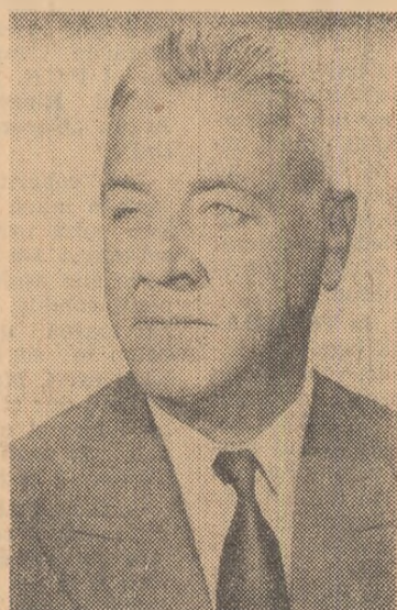
ION GHEORGHE MAURER