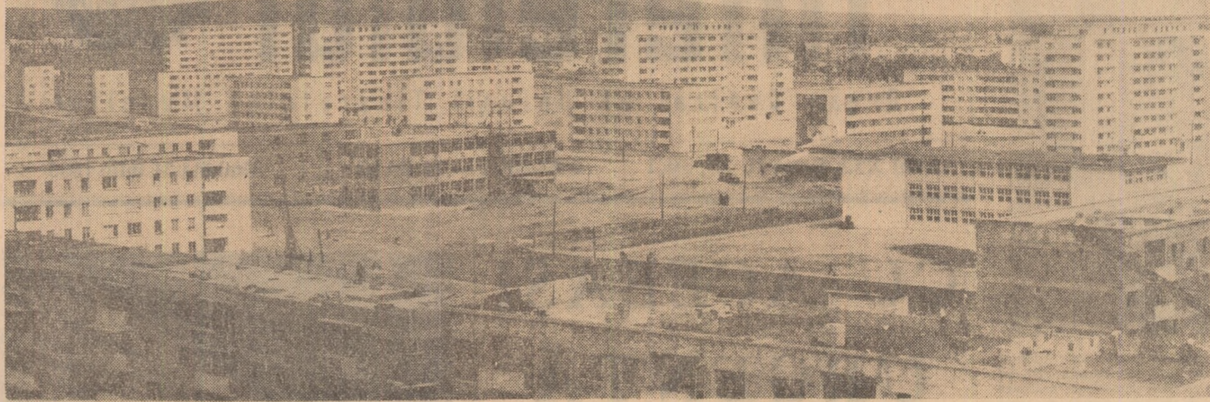
Imagine de ansamblu a noului cartier Ploiești-Nord