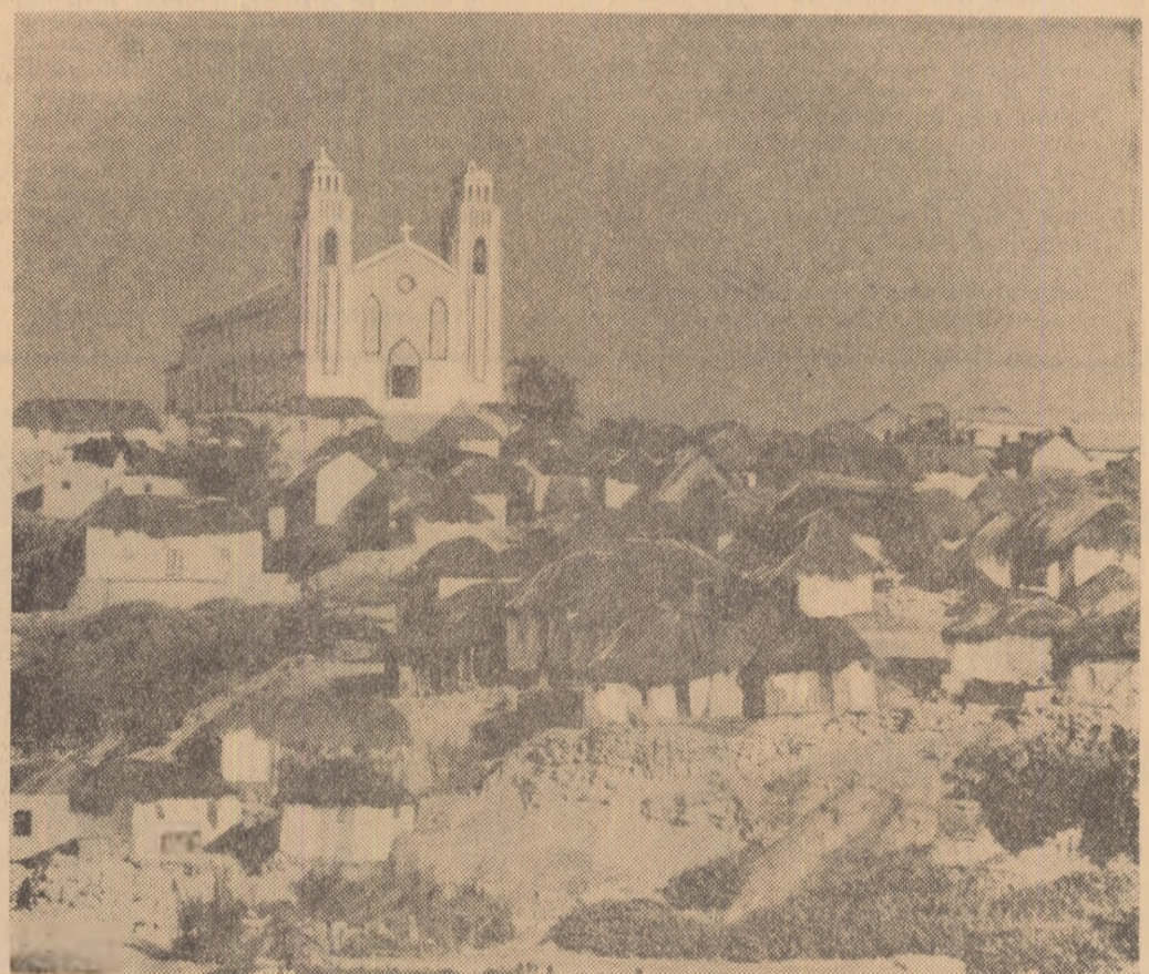
Fotografia noastră înălțează un sat situat la numai cîțiva kilometri de capitala coloniei portugheze Angola. Singura clădire care iese în evidență e biserica. În rest, o aglomerare de bordeie mizere.