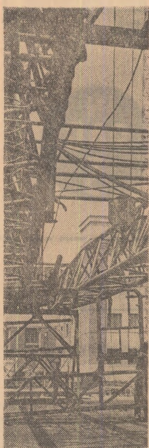
La Uzinele „1 Mai” Ploiești se lac ultimele pregătiri în vederea ridicării unei noi instalații de forare, care va intra în producție de casă