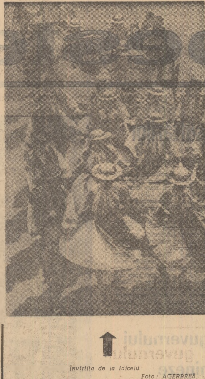
Invitrita de la Idicele