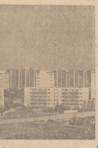
Sub mina iscusita a constructorilor, crește necontenit numărul noilor blocuri din cartierul Bercei.

șea ne ispiteste, ne cheamă întotdeauna la cît mai multe asocieri. Și folelor este de fapt o adevărată lume a unui suflet comun. Astfel ne-am putea explica multe din momentele de emoție trăite la spectacolele a-morilor ansambluri. Nu s-oprim numai la cîteva. Pe scena Teatrului de vară din Mamaia, este încă amurg. Se aud primele înfiorări ale unui tîlcic... Apoi flăcări. Clăujul se fac simțîți mai mult prin trădarea respirației lor... Dar se aprind lumînile și spectatori izbucesc în aplauze. A fost o emoție. Cum s-a creat? Culoare costumelor, tulnicul, dinăntele, sau aproape imperceptibilul ritm al mișcării din scenă. Poate că toate la un loc. Trebuie numit și acel cîntec al pescarilor de pe Snagov care aveau nemăsurată putere de a adormi serpii în apă... Iată-ne din nou nevoiți să căuțim asemănări frumoșelii. Și acest prilej este firesc. Exprîmîndu-și părerile sale despre căuțări, joi interpretat de formația cîmîntului cultural din comuna Frumusea, regiunea București, italianca MARIA SERAFINI ne-a spus: „Acest dans minunat, îmi amintesc de dansurile noastre de prin părțile Sardiniei. Ritmul, apoi strigăturile, îl fac de-a dreptul fascinant”. Și căuțării, a fost într-adevăr, un alt nou moment de emoție! OANCEA NELU (Continuare în pag. a III-a)