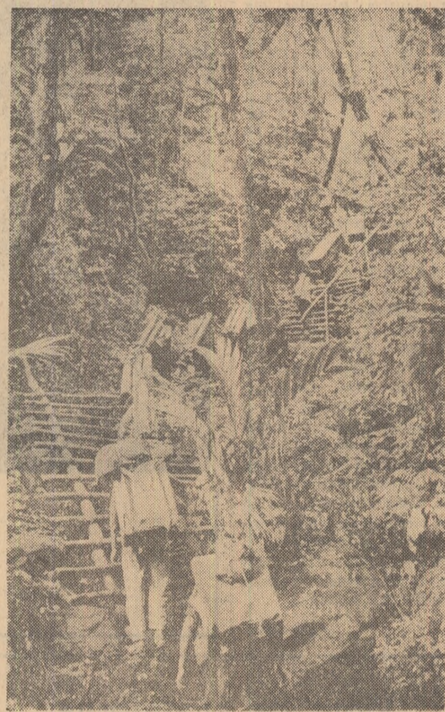
VIETNAMUL DE SUD. — Membri ai unei unități de transport traversind o pădure virgînă din munți, pentru a duce gloanțele și obuzele ostajilor Frontului Național de Eliberare.

Subliniind că în prezent atenția întregii lumi este îndreptată spre Vietnam, unde acțiunile agresive ale S.U.A., au creat o situație care poate avea cele mai serioase consecințe pentru pacea generală, A. Kosighin a arătat că