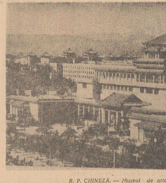
R. P. CHINEZĂ. — Muzeul de artă din Pekin

● ÎNTRU reprezentanții guvernului italian și o delegație economică iugoslavă au avut loc convorbiri în legătură cu unele probleme economice și financiare privind relațiile dintre Iugoslavia și Italia. În comunicatul comun Iugoslovo-italian cu privire la aceste convorbiri se arată că delegația iugoslavă a informat partea italiană despre nolle măsuri economice și