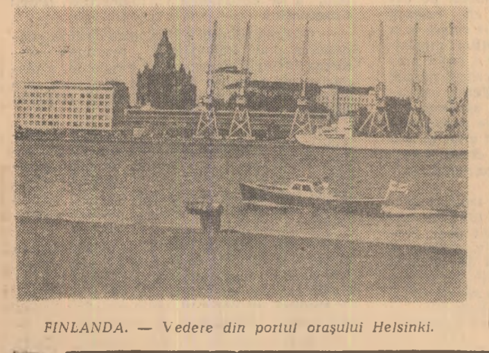
FINLANDA. — Vedere din portul orașului Helsinki.

din cele mai mari trusturi de presă din lume. Acapărările tot mai frecvente ale unor ziare de către marile trusturi de presă engleze, au făcut ca laboriștii să propună Camerei Comunelor adoptarea unei legi care dă dreptul guvernului să interzică orice fuzionare în domeniul presei. De lingă puterile acordate guvernului pentru a interveni în cercările de fuzionare, proiectul conține și o serie de prevederi care reglementează problema monopolurilor și a fuzionărilor în general. În proiect se prevede că orice persoană care transferă un ziar altei persoane, proprietară a altui ziar, fără aprobarea departamentului comerțului, este pasibilă de pedepșă cu închisoare și amendă calculată potrivit tirajului ziarului. Luna trecută Camera Comunelor a aprobat acest proiect care urmează să devină lege încă în acest an după aprobarea sa în Camera Lordzilor, aprobare care este considerată ca sigură. Este însă îndoielnic dacă măsurile, chiar legislative, referitoare la „regimul fuzionărilor” vor putea să pună capăt procesului de acapărare a unor ziare de către magnatii presei, proces atît de frecvent în S.U.A., Anglia și în alte țări. ION D. GOIA