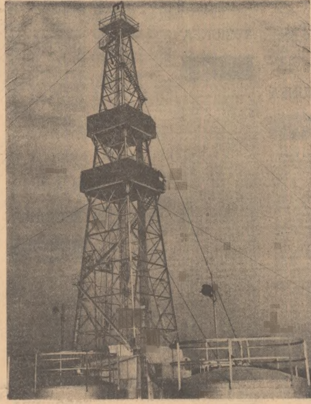
4 DH-315, la lucru