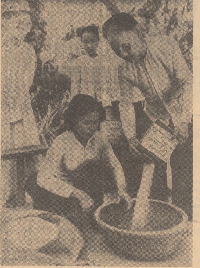
Vietnamul de Sud. — Populația regiunilor eliberate stringînd alimente pentru ostașii Frontului național de eliberare.

HANOI 9 (Agerpres). — Agenția vietnameză de presă anunță că la 8 august numeroase grupuri de reactoare de luptă americane care au decolat de pe navele flotei a 7-a și de pe bazele din Vietnamul de sud și Tailanda, au pătruns în repetate rânduri în spațiul aerian al R.D. Vietnam, bombardând și mitralind centre populate și obiective economice din provinciile Son La, Tu-yen Quang, Hoa Binh, Nam Ha, Ninh Binh, Thanh Hoa și Ha Tinh, precum și insula Con Co, din nordul zonei demilitarizate. La 9 august, avioanele americane au efectuat noi raiduri asupra provinciilor Phu Tho și Yen Bai, precum și asupra orașului Vinh. În cursul luptelor, au fost doborâte 6 avioane, numărul total al avioanelor americane doborâte cu începere din 5 august 1964 cifrindu-se la 458. PHENIAN 9 (Agerpres). — Guvernul R.P.D. Coreene a dat publicității o declarație în care sprijină declarația din 2 august a guvernului R.D. Vietnam și protestează împotriva hotărârii S.U.A. de a trimite încă 50 000 de militari în Vietnamul de sud.