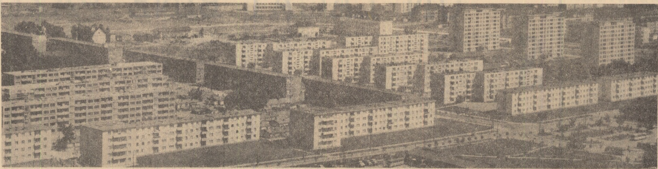
Din nou, peisaj hunedorean

Un grup de studenți de la facultățile de filologie, istorie, arte plastice din Iași, conduși de cadre didactice și cercetători științifici, au întreprins o anchetă folclorică în nordul Moldovei.