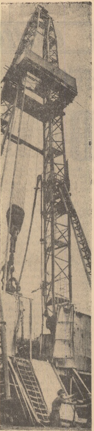
Imagine de la sonda Întreprinderii ISEM din regiunea Ploiești.