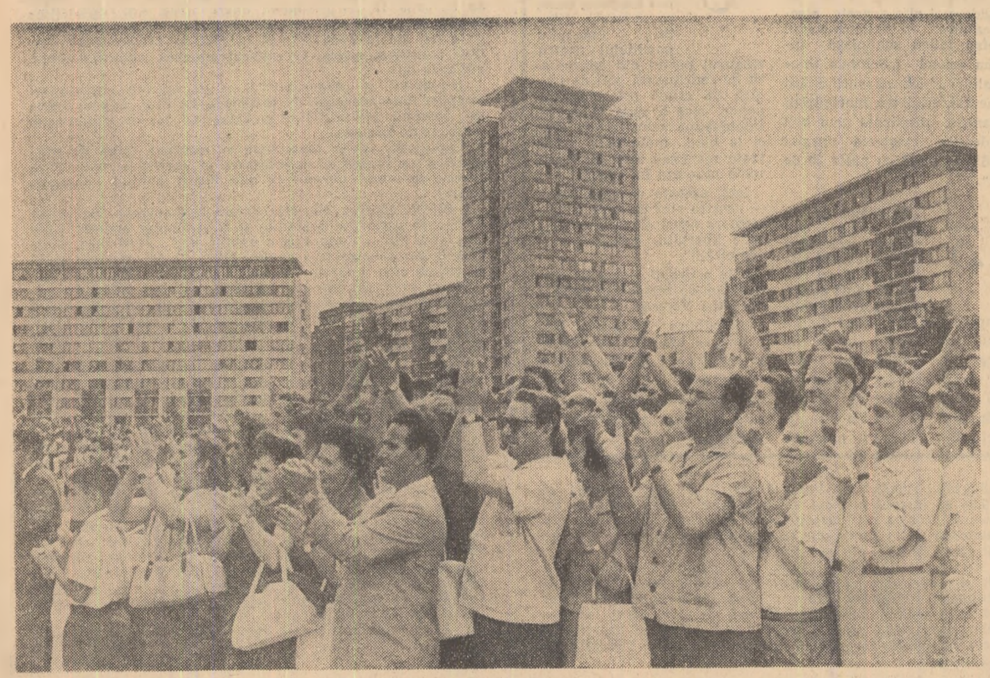
Aplauze îndelungi pentru legea fundamentală a țării

Așadar cîntînd noua Constituție simțim soliciță de pe platforma prezentei în același timp spre trecut și spre cititor și înaintea noastră se desface o priveliște unică prin măreția și ostentivitatea senșurilor ei. În cuprinsul noii Constituții se întîlesc și fuzionează în aliance comunitare de aspirații milioane de oameni, o singură uriasă inimă și înțelegință. A spune aceasta însemnă, cred, a aduce Constituția noastră un suprem elogiu.