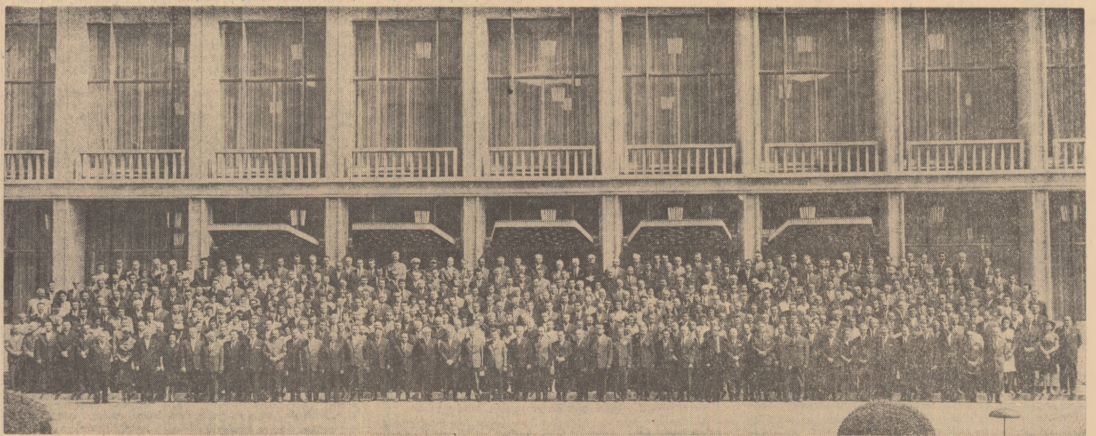
O fotografie istorică: deputații Marii Adunări Naționale care au votat noua Constituție a țării

Revenind la urașa Hord a Unirii din Piața „Gheorghe Gheorghiu-Dej”: ea a unit în ritm și bucurie inimile a mil de oameni, o hordă al cărei contur a desennat parca însăși harta României. O manifestație grandioasă a sentimentelor de bucurie ale poporului a cuprins întreaga țară. În toate parcurile, pe estade, în București, și în toată țara oamenii muncii, cetățenii Republicii Socialiste România au participat aseară la mari și strălucitoare serbări populare. Cîntecele și dansurile tradiționale ale poporului nostru au fost astăzi încununarea entuziasmului, grandioasă a zilei care va rămîne neștersă în istoria și în amintirea poporului român.