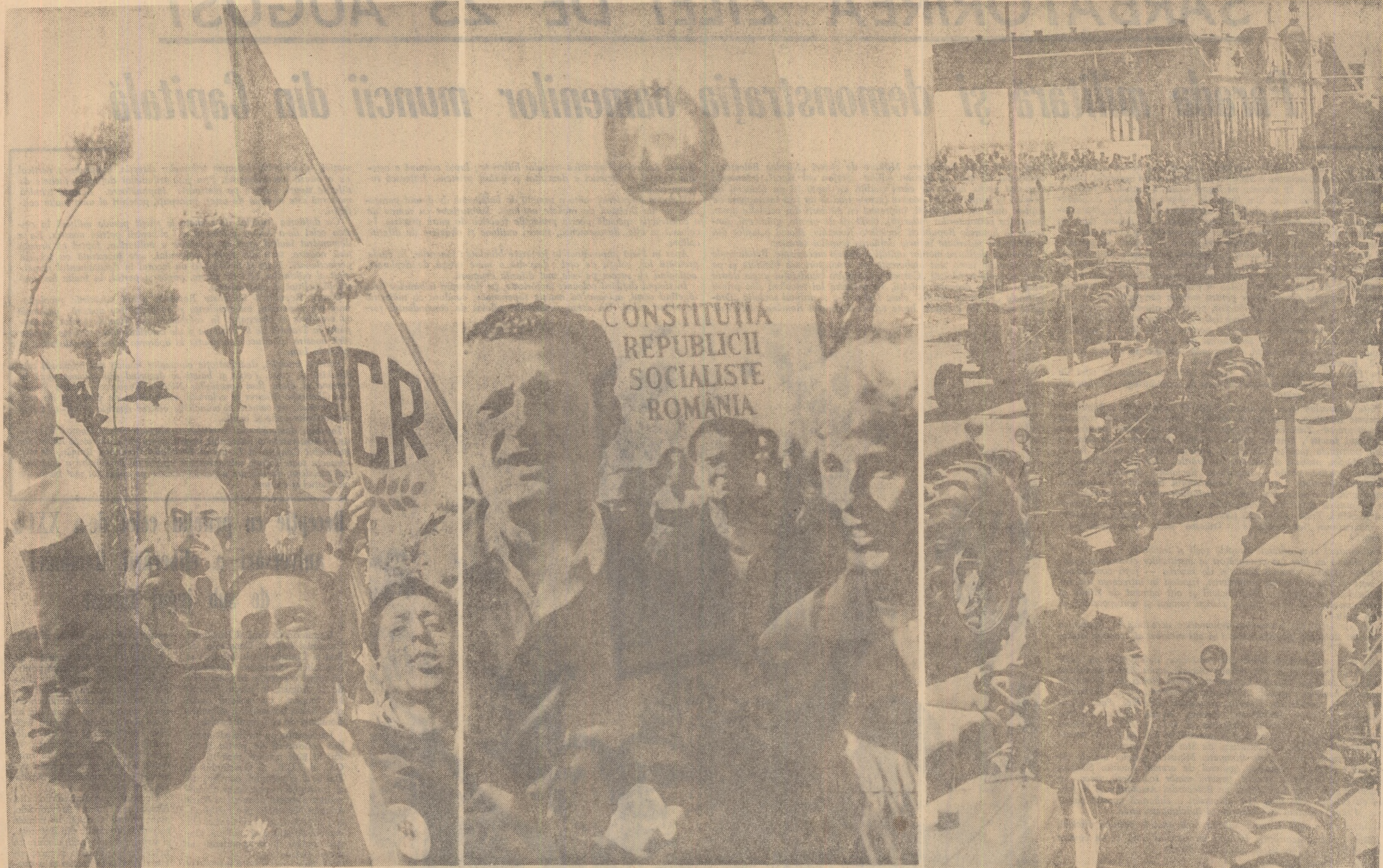
Imagini de la demonstrația oamenilor muncii din Capitală și din orașul Brașov