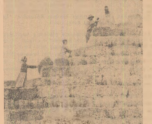
În întîmpinarea iernii. La G.A.S. Borănești din Infimul Urziceni, palele de grîu bolătoare sînt stivuite cu grijă

LA NIVELUL PROTOTIPURILOR lui și propunerii conducerii pentru îmbunătățirea lor. Ceea ce se remarcă de la început este lărgirea sortimentului. În anul următor vor fi lansate în fabricație, pe baza prototipurilor realizate în acest an, numeroase tipuri noi de mobilă printre care dormitorul tip Delfin, camera completă tip 319, camerele de hol tip M 319 și TM 3 și altele. Calitatea mobiliei se va îmbunătăți simțitor anul viitor prin aplicarea pe scară largă a unor noi procedee de finisare. Astfel