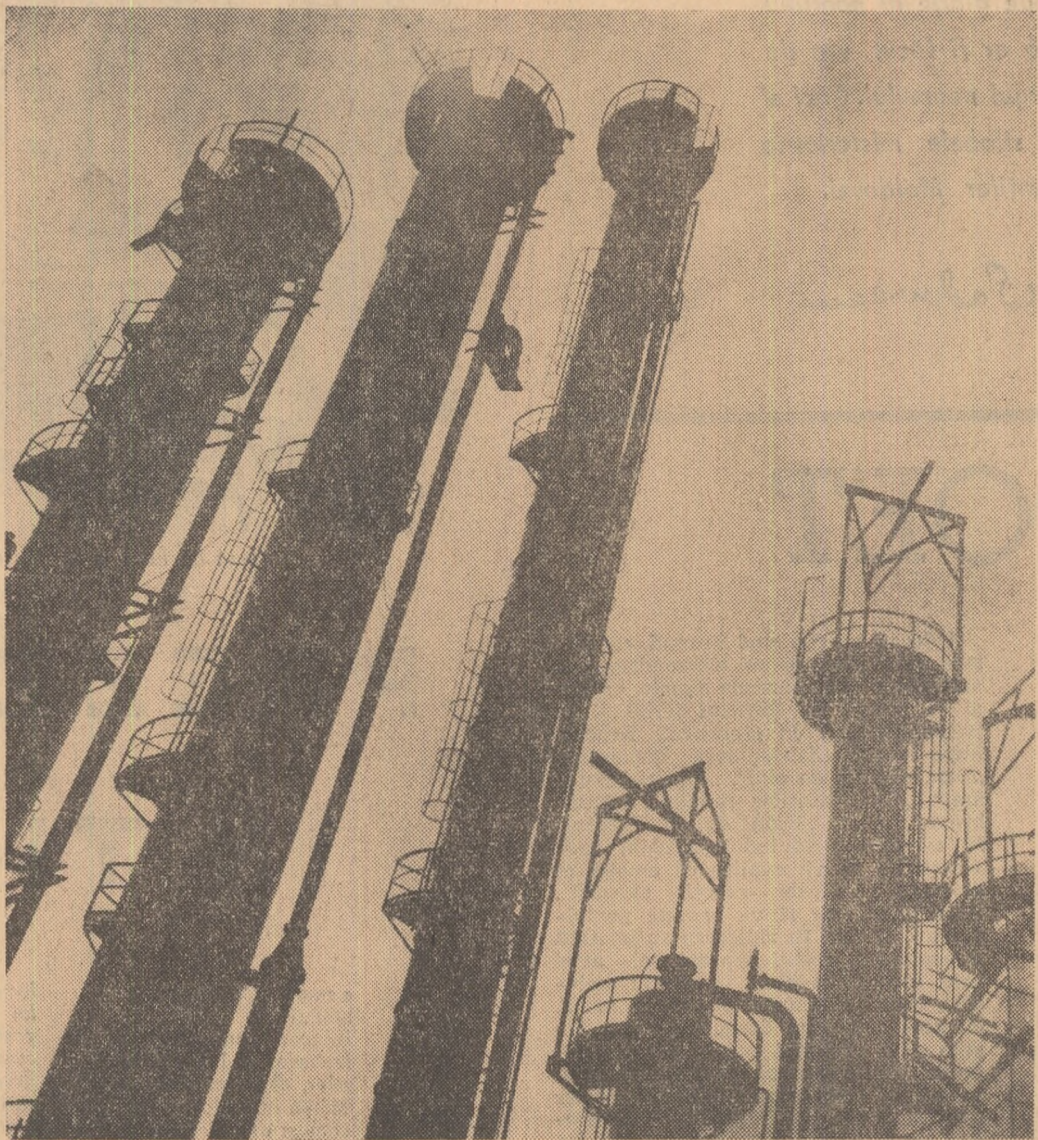
„Coloane” (La Combinatul chimic Craiova)