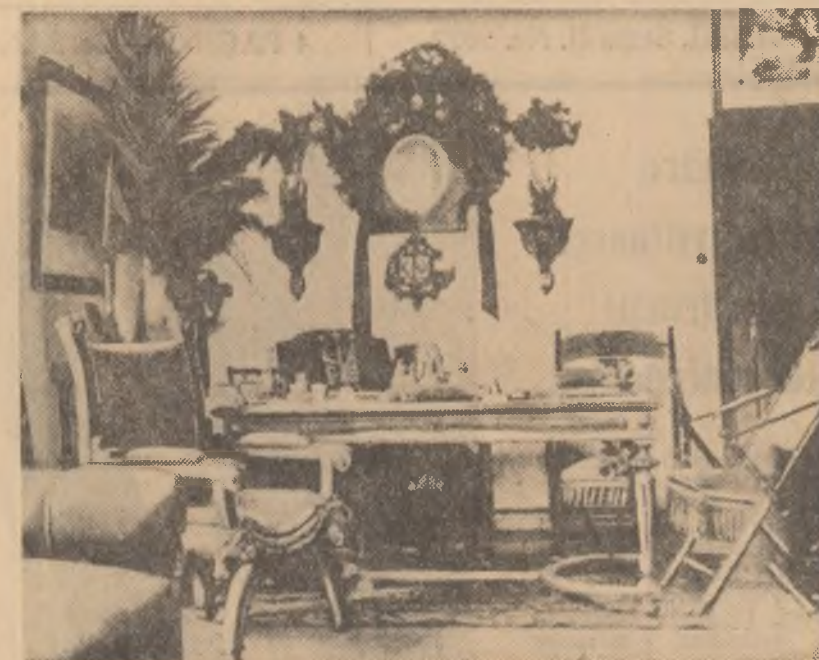
Camera de lucru a lui Vasile Alecsandri