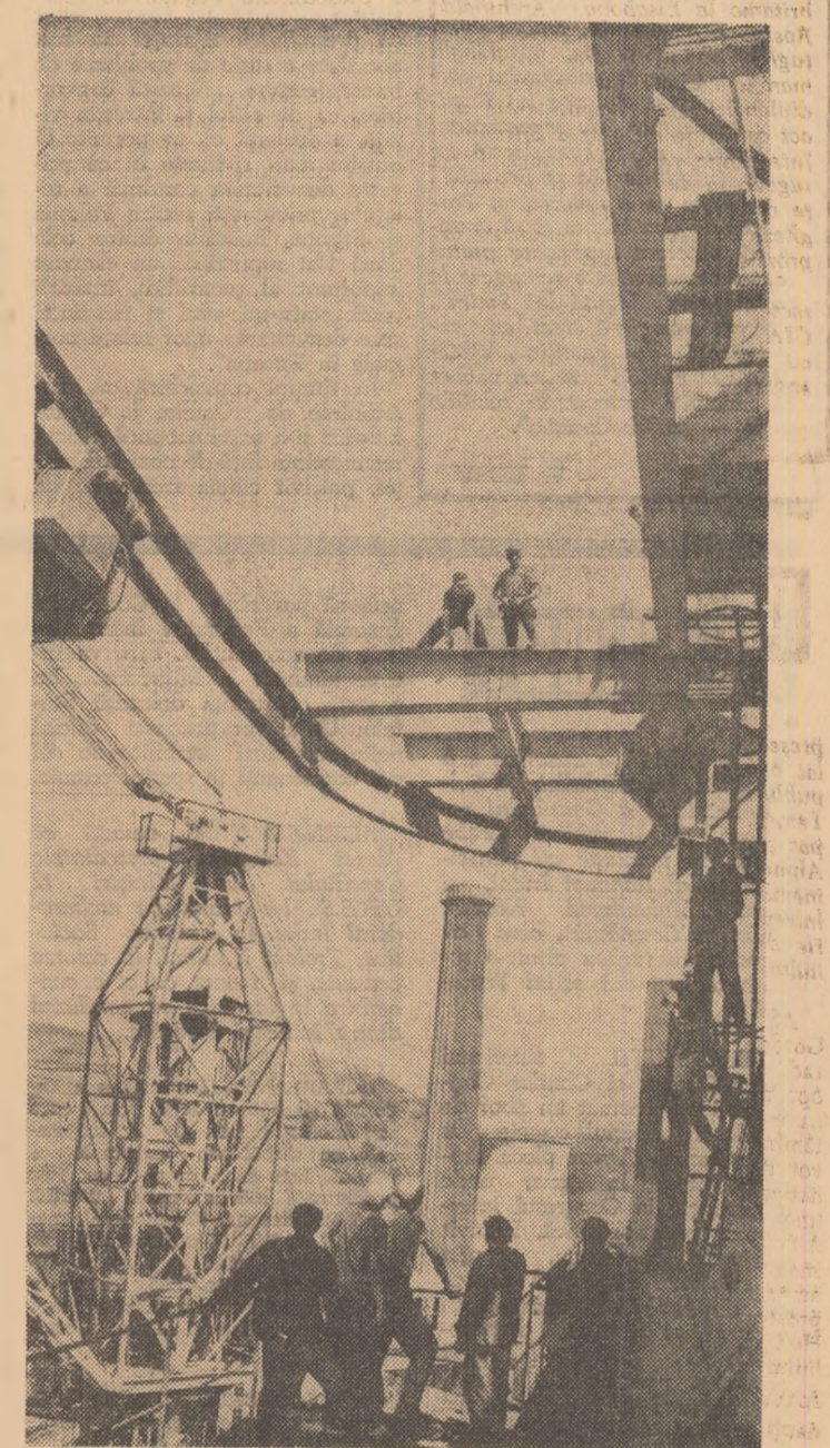
Pe șantierul centralei electrice de la Fîntănele (segiunea Mîlreș-Autonoma Maghiard)

La depozitul din Inotăști există în stoc 540 kilograme de antimădică, care ar fi trebuit să fie livrate pînă în prezent. Există și o listă lungă cu cooperativele agricole care n-au ridicat fungicidele. Este posibil ca acestea, în intenția de a economisi timpul, să procedeze astfel: cînd vin să schimbe sămînța să treacă pe la raion să încerce insectofungicidele (afiate în magazia consiliului agricol), iar de aici să dea o fușă pînă la Inotăști și ia și fungicidele. Unificarea depozitelor de fungicide și insecticide nu este o problemă de competență consiliului agricol raional, dar este de datoria acestuia să urmărească dacă unitățile se apropiază de termenul de însemînțare necesare tratării sămînței.