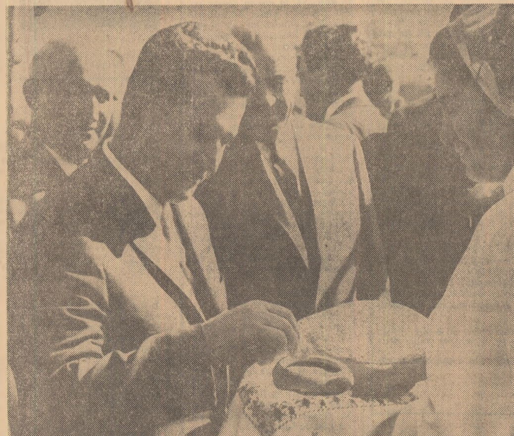
La Botevgrad, înalții oaspeți români au fost întâmpinați cu pline și sare