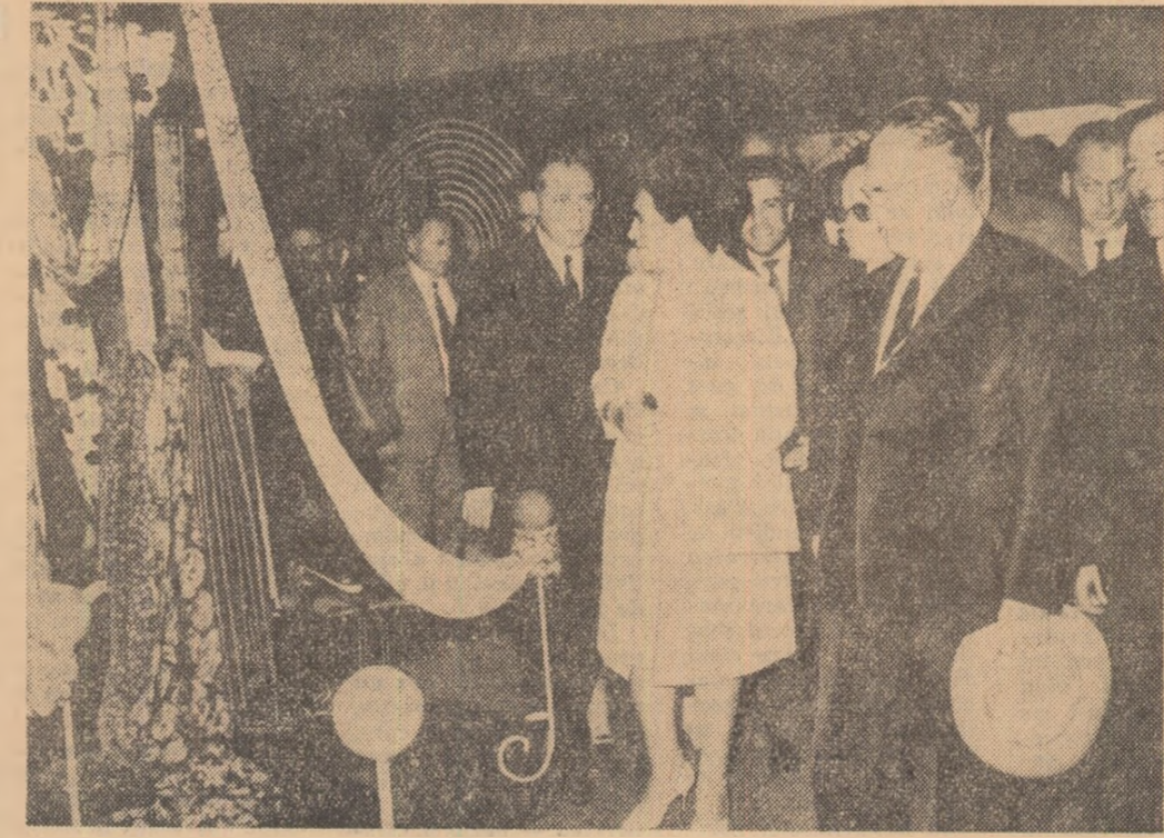
R. S. F. IUGOSLAVIA — Președintele Tito împreună cu soția în vizita la pavilionul românesc în cadrul Tîrgului internațional de toamnă de la Zagreb

Înainte de a părăsi comuna Pordim, membrii delegației române, însoții de conducătorii O.N.U., astfel încît acest for internațional să oglindescă realitatea lumii de azi, pentru universalitatea organizației și restabilirea drepturilor legitime ale R. P. Chineze, mare putere mondială, singura îndreptățită să reprezinte poporul chinez. Pentru depășirea dificultăților în fața cărora se găsește O.N.U. în prezent este necesar să se înfăture orice abateri de la principiile Cartei. Privind O.N.U. prin perspectiva schimbărilor