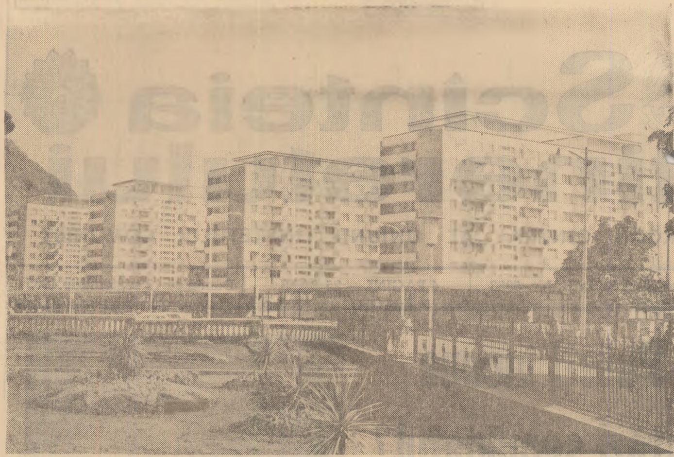
Vedere din centrul orașului Piatra Neamț

Următoarele trei zile sînt destinate unei excursii de documentare în orașul Tulcea, Delta Dunării și Complexul Razelm.