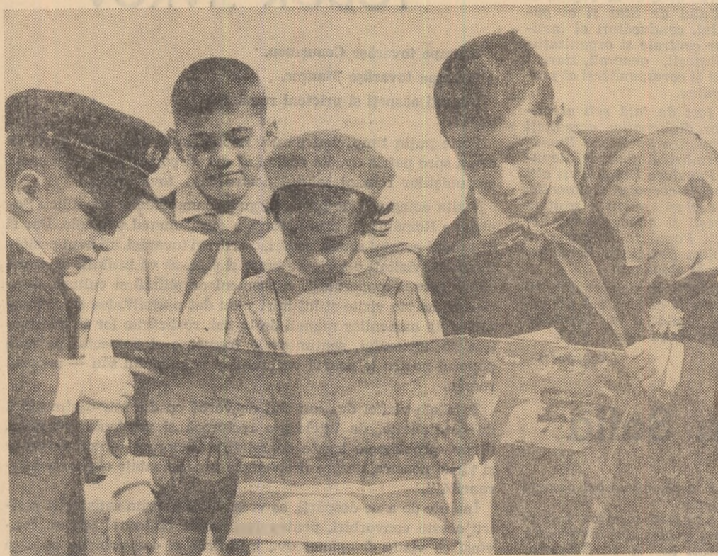
În pauză cu „bobocii” la Școala de 8 ani nr. 114 din Capitală

În urma delimitărilor, de către Comitetul de Stat pentru probleme de Muncă și Salarii, a nomenclaturii generale de meserii și specialităților și a indicatorilor tarifare de calificare a fost revizuit și completat și nomenclatorul meseriilor și specialităților din învățămîntul profesional și tehnic, în așa fel ca el să corespundă cît mai bine cerințelor producției. În același timp, ca o consecință a generalizării învățămîntului