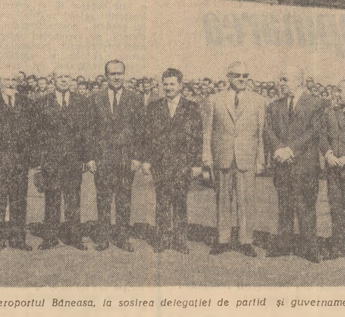
Pe aeroportul Băneasa, la sosirea delegației de partid și guvernamentale a Republicii Socialiste România