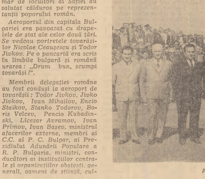
Pe aeroportul Băneasa, la sosirea delegației de partid și guvernamentale a Republicii Socialiste România