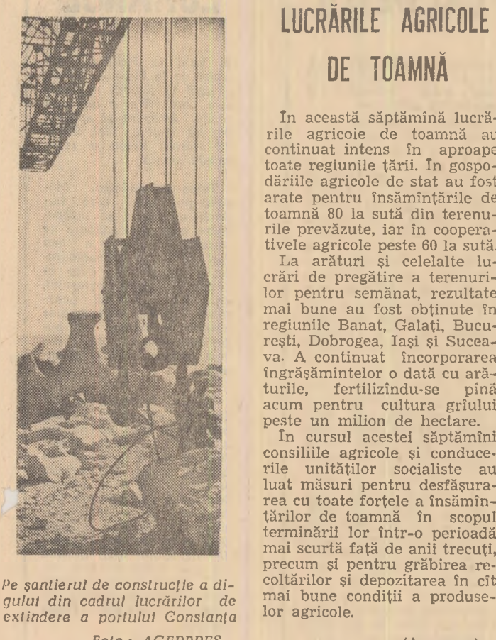
Pe șantierul de construcție a digului din cadrul lucrărilor de extindere a portului Constanța