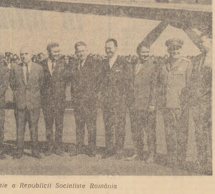
Pe aeroportul Băneasa, la sosirea delegației de partid și guvernamentale a Republicii Socialiste România