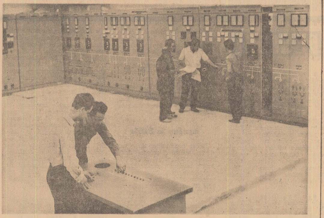
Sala de comandă a laminorului de tablă grosă a Combinatului siderurgic, „Gheorghe Gheorghiu-Dej” din Galați

Într-un meci amical de fotbal Rapid a învins cu scorul de 8-5 (3-0) pe Progresul prin punctele marcate de Neagu și Dinu (din 11 m). Pentru Progresul a înscris Dinulescu.