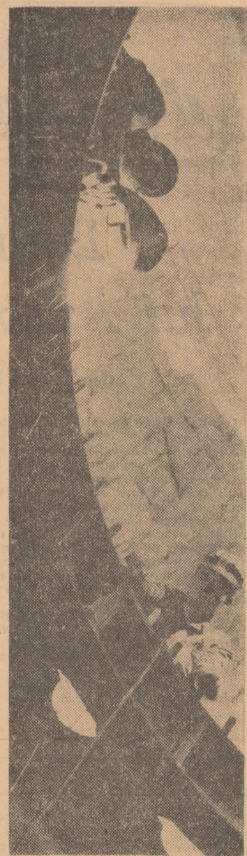
Se montează echipamentul hidroelectric de la Hidrocentrala Bacu 1