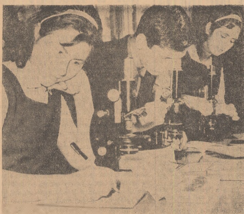
În laboratorul de naturale al liceului „Mihai Viteazul”

Solicităm acum, la început de drum, părerile, sugestiile elevilor, tovarășilor profesori cu privire la conținutul și profilul articolelor, a prezentării grafice, pentru a contura mai bine acest — să-l spunem — supliment al „Scinței tineretului” destinat tineretului din școli.