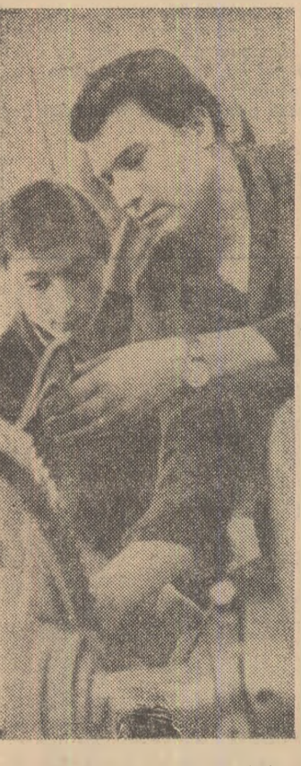
La Uzele „Hidromecanică” din Brașov sunt învecinate asemenea cupluri: un muncitor cu mai multă experiență explicând altuia, mai tânăr, amănunte ale meseriei.

Barajul se apropie de cota finală • Se toarnă noi baraje • A 7-a străpungere