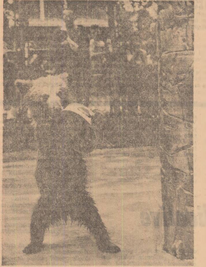
Zile de toamnă la îndrăgitul colț zoologic din pădurea Băneasa