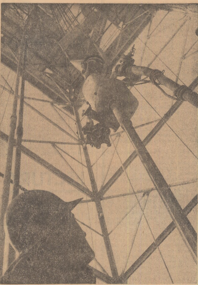
Se toarează