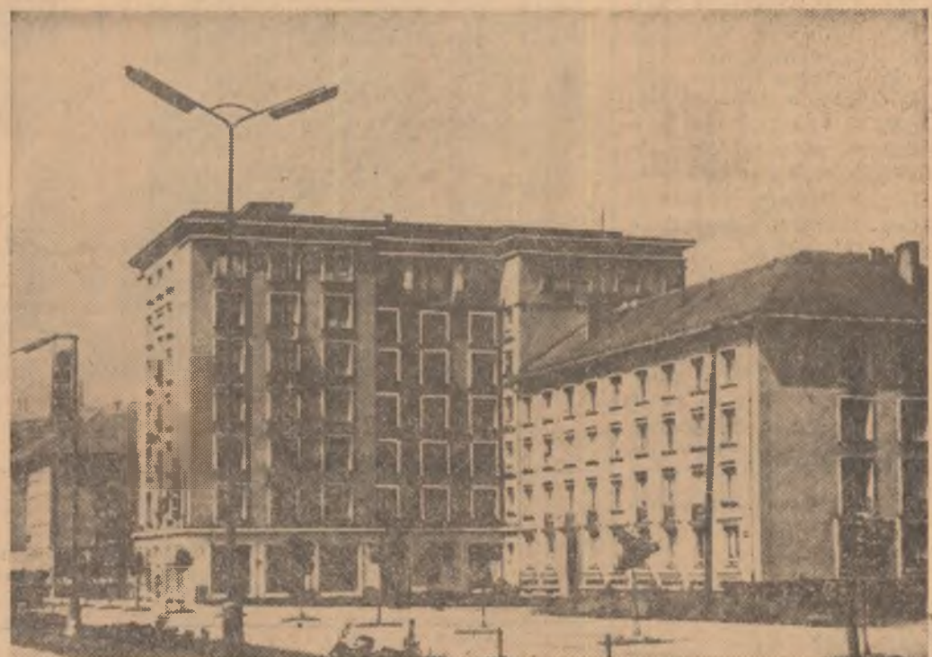
Republica Socialistă Cehoslovacă. Noi blocuri de locuințe în orașul Banska Bystrica