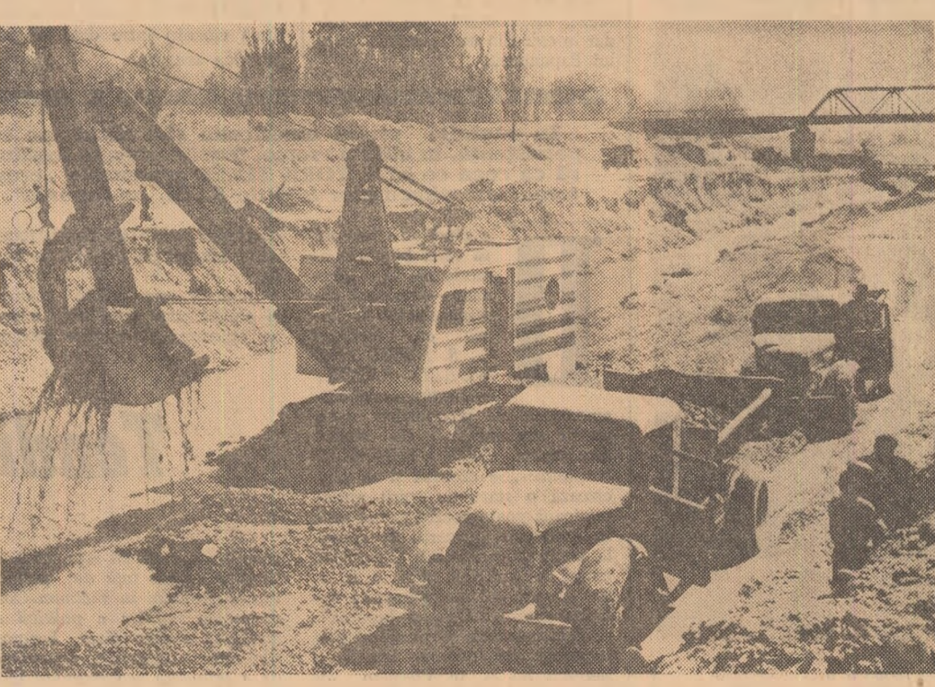
Se lucrează la canalul ce va lega Hidrocentrala Bacău 1 de Bacău 2