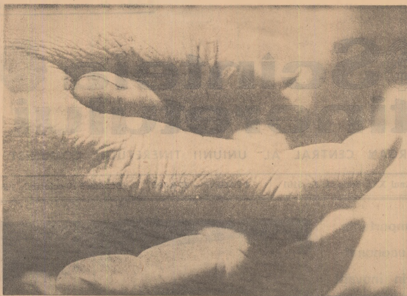
Măne de părinte, învățate să mănânce cu blindețe, tresar acum de emoție: au condus ele, așa cum trebuie, pașii copilului?