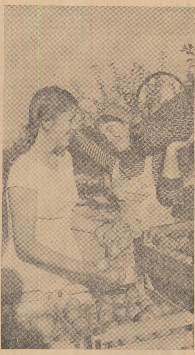
Culesul merelor la G.A.S. Cisnădie, raionul Sibiu

Anul XXI, Seria II, Nr. 5104 4 PAGINI — 25 BANI Joi 14 octombrie 1965