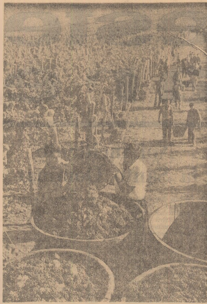
Toamna, cu daturile ei bogate... la G.A.S. Tohani