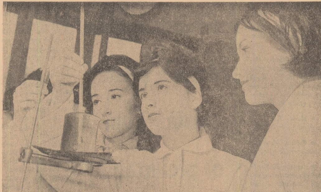
Oră de chimie la Liceul de muzică și arte plastice din Galați (clasa a IX-a)