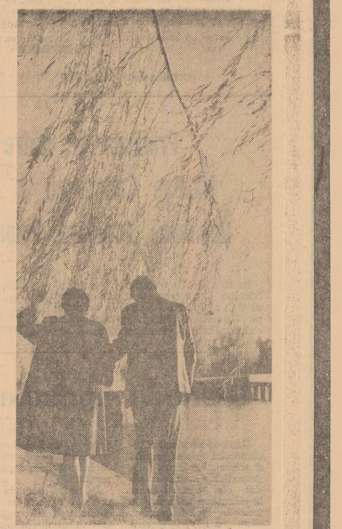
Zile de toamnă în Parcul Herăstrău