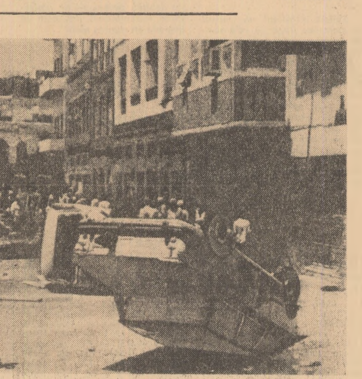
ADEN: aspect din timpul recentelor ciocniri ce au avut loc pe străzile orașului.