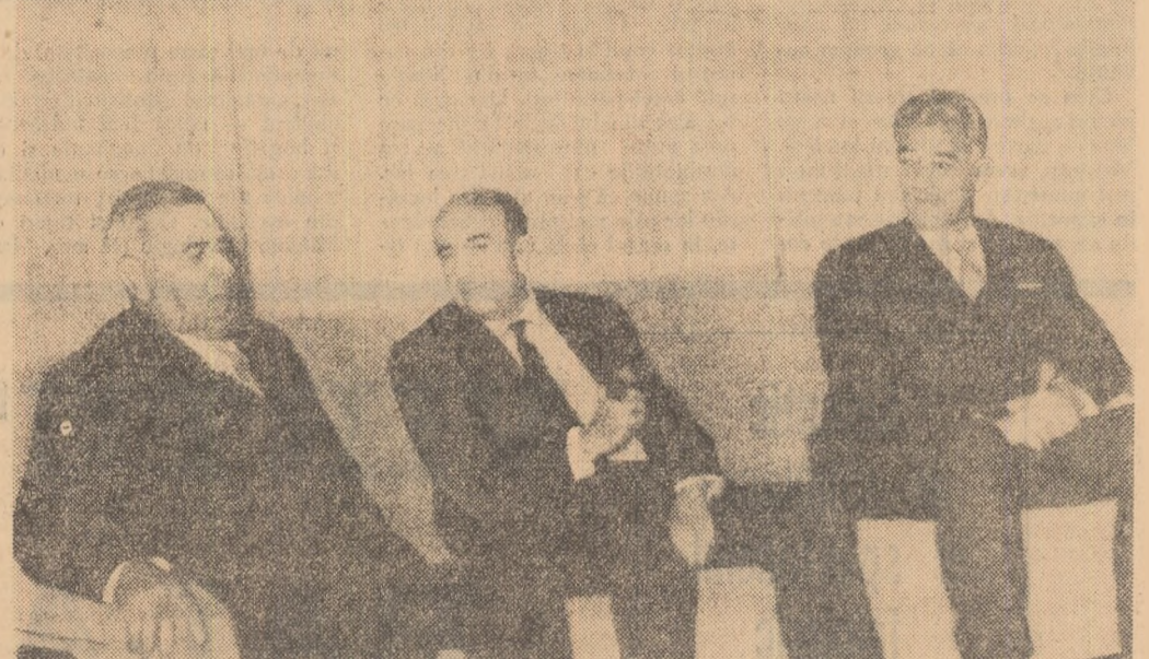
Moment din timpul vizitei președintelui Consiliului de Miniștri al Republicii Socialiste România în Iran.

Anul XXI, Seria II, Nr. 5112 6 PAGINI — 25 BANI Simbătă 23 octombrie 1965