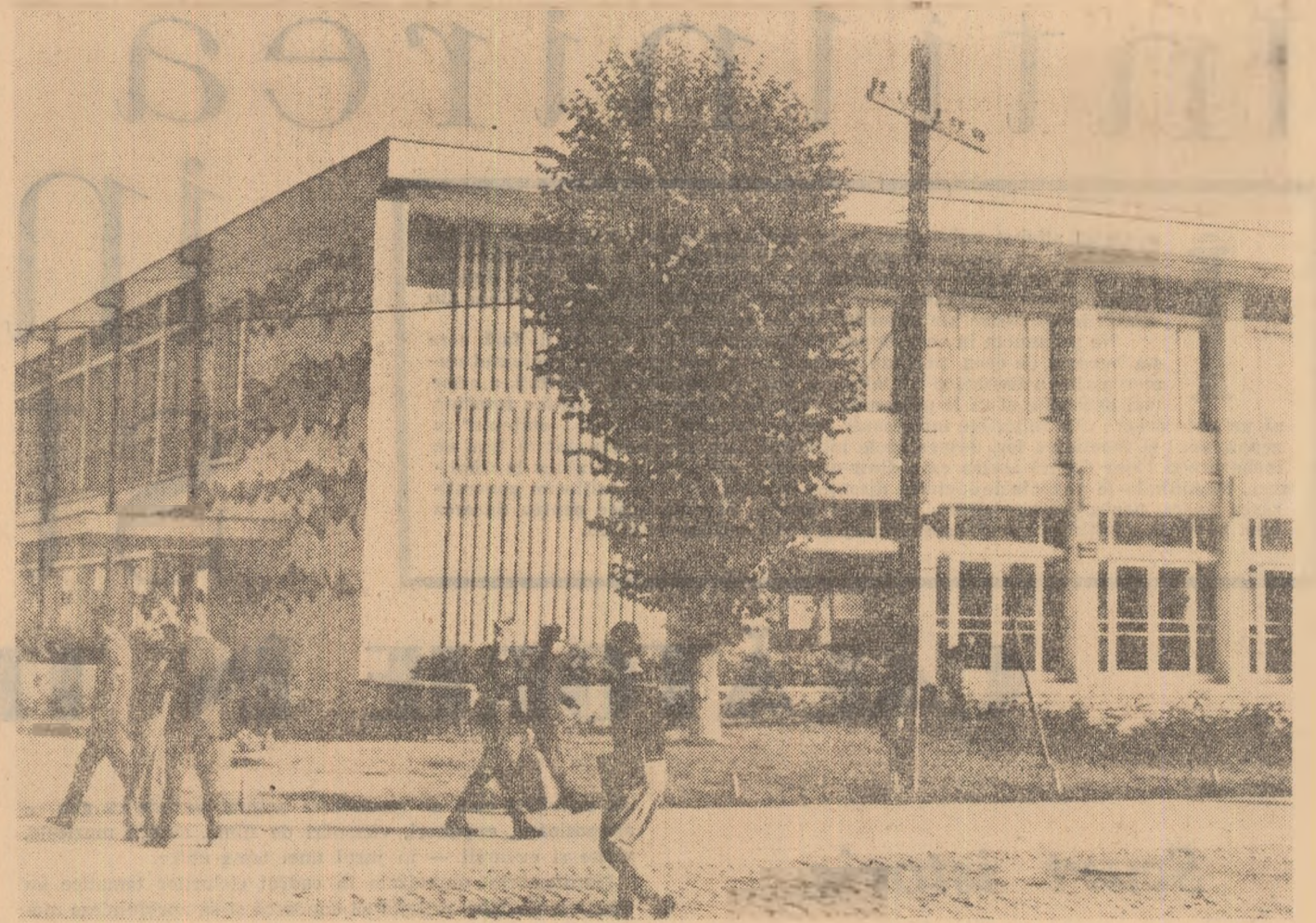
Casa de cultură a sindicatelor din orașul Piatra Neamț

Dar, dacă nu mă înșel, pentru azi e de-ajuns.