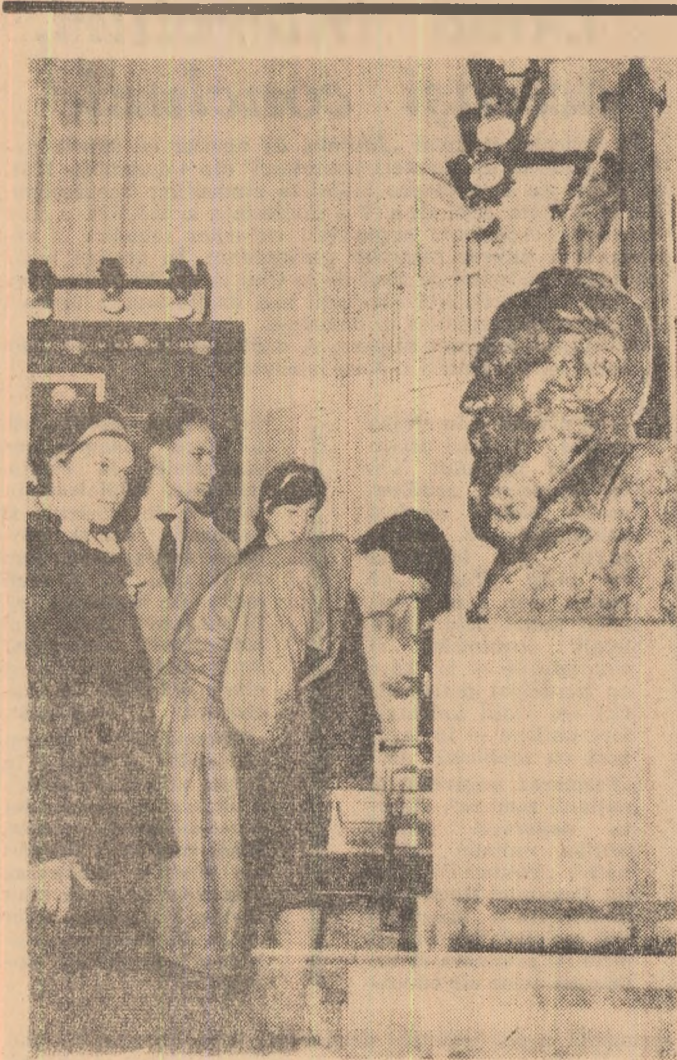
Casa memorială Hașdeu — sursă a curiozității tinere