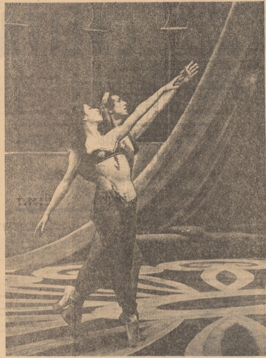
Fragment din baletul „Sheherazada” de Rimski Korsakov în interpretarea corpului de balet al Teatrului de Operă și Balet din București. Acest colectiv artistic va întreprinde în turneu la Paris, unde va participa la Festivalul internațional de dans din capitala Franței.