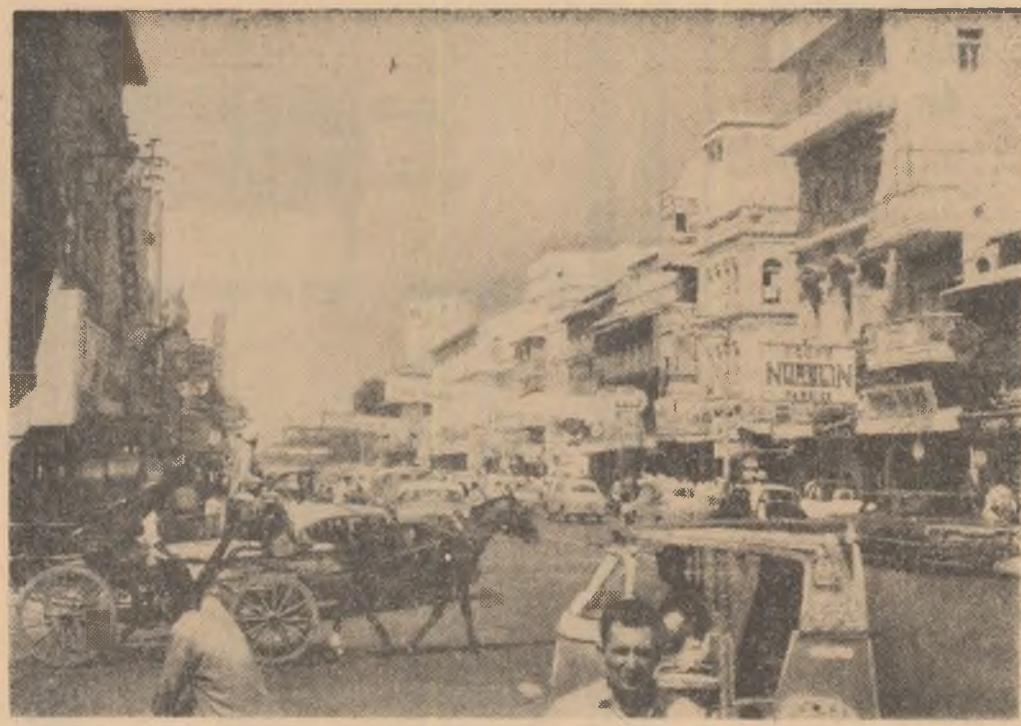
Imagine din Karachi, capitala Pakistanului

Continuându-și vizita prin țară, membrii delegației s-au întâlnit la Torino și Livorno cu conducătorii și federațiile și organizațiile locale, cu activiști și membri ai Partidului Comunist Italian. În orașele Torino, Livorno și Grugliasco, delegația a avut convorbiri cu primarii localităților respective și cu alți reprezentanți ai municipalităților. Au fost vizitate, de asemenea, Fabrica „Olivetti” de la Ivrea, din provincia Torino și Compania muncitorilor portuari din Livorno. La reîntoarcerea la Roma, delegația C.C. al P.C.R. a avut întâlniri la secțiile ale Comitetului Central al P.C.I. și a făcut o vizită la Redacția ziarului „L'Unita”.