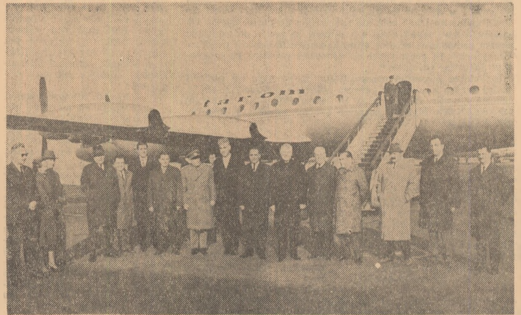
La sosire, pe aeroportul Băneasa