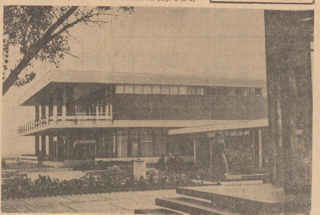
Nouă arhitectură a Galațiului. Complex comercial, la Tîgîlna.

a X-a F, cu următorul program: Întîlnire cu actorii Teatrului de Stat din Pitești, un concurs fulger „Reproduceti cit mai corect melodia” propus de elevi, va urma dans și un concurs de dans cu premiul. Miine, duminică, elevii care s-au înscris pentru excursia la Sibiu se vor întîlni la ora 8 în curtea liceului.” Ca să fim sinceri această rubrică a emisiunii nu există încă, astfel încît nici reuniunea, nici excursia la Sibiu n-au avut loc. Și nici preocupare pentru organizarea timpului liber al elevilor nu se G. DIMA (Continuare în pag. a IV-a)