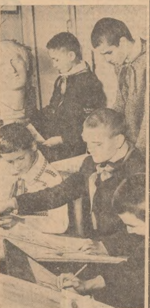
Viișorii pictori sînt încă... elevi!