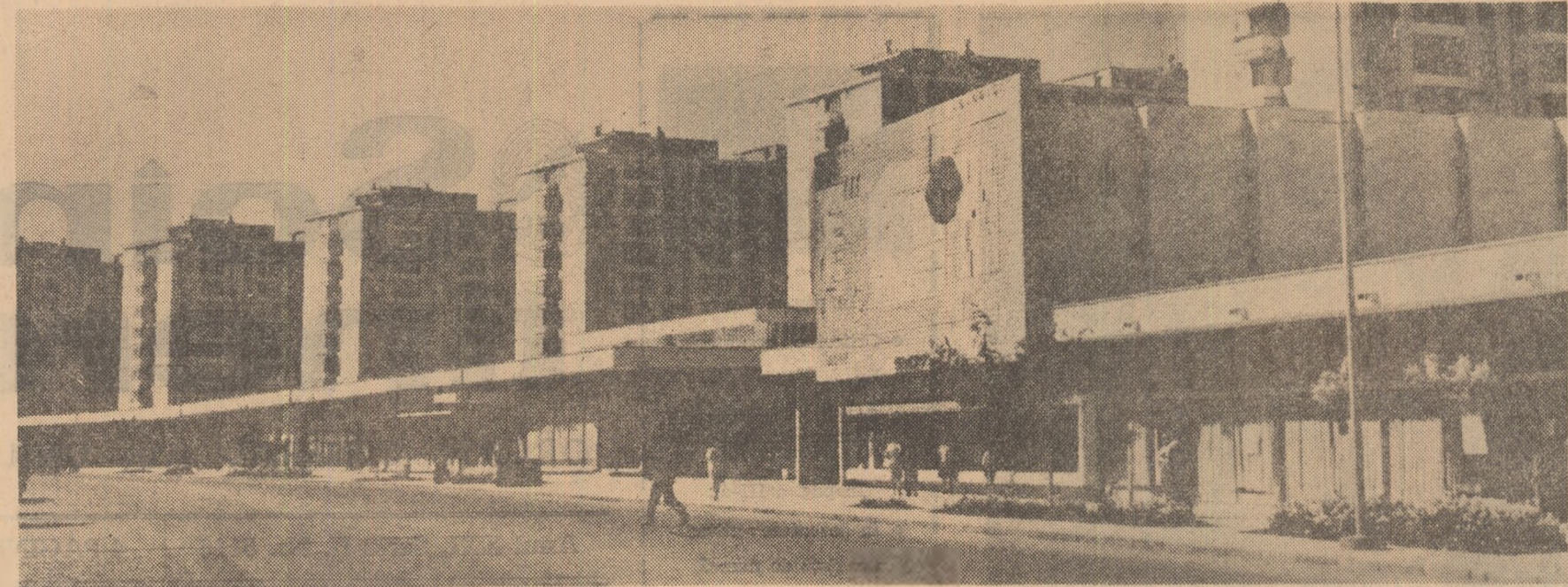
În Orașul „George Gheorghiu-Deu”