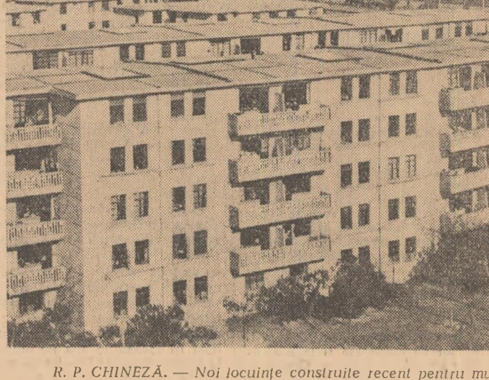
R. P. CHINEZĂ. — Noi locuințe construite recent pentru muncitorii din Fankoung

Anunțarea măsurilor excepționale intervine imediat după eșecul guvernului de a trece prin congres o serie de amendamente constituționale oferind guvernului dreptul de a interveni în treburile statelor federației braziliene și fixind un nou statut — mai sever — al personalităților private de drepturi politice.