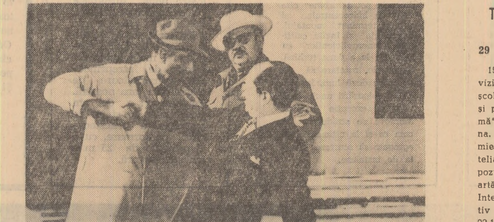
Cadru din comedia cinematografică „Unchiul meu“ care nu trebuie să scape nici unui cinefil.

CINE ESTI DUMNEAȚA, DOMNULE SORGE? rulează la Patria, orele 10; 12,15; 15,45; 18,30; 21,15. București, orele 9,15; 12; 15,30; 18,15; 21.