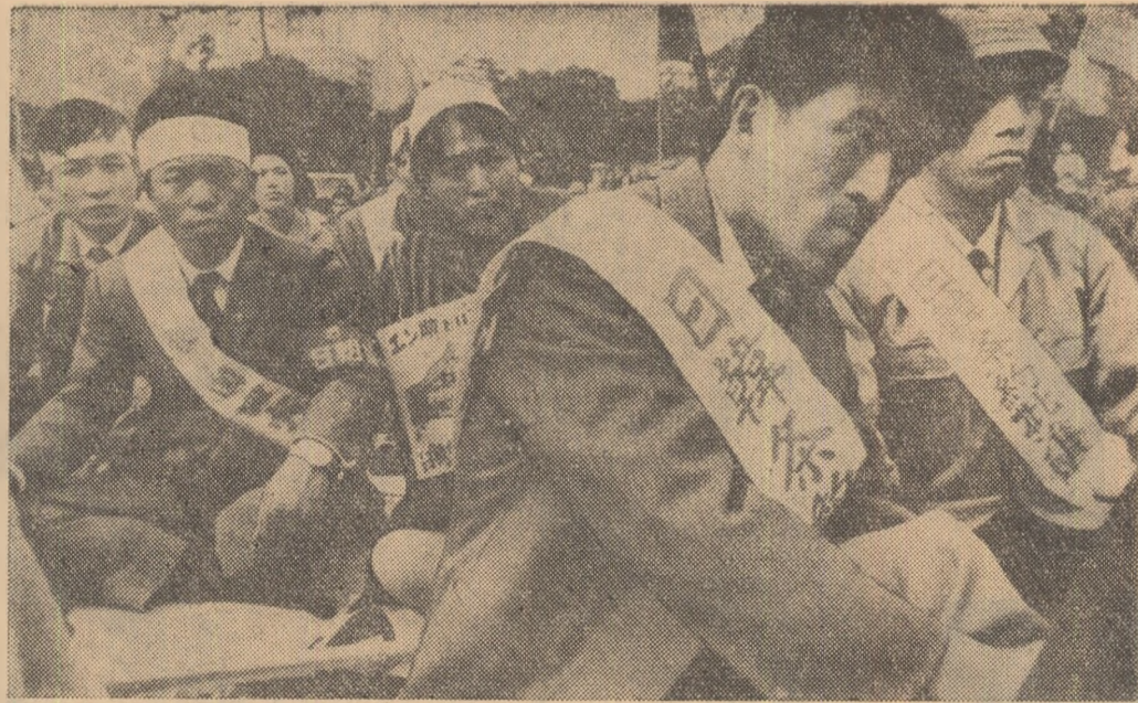
JAPONIA. — Mișing în regiunea Niigata împotriva ratificării tratatului japono-sud-coreean.

În continuarea lucrărilor Comitetului pentru problemele sociale, umanitare și culturale, joi dimineață a fost adoptat articolul 2 din proiectul de Declarație, inițiat de delegația română, privind promovarea în rîndurile tineretului a idealurilor de pace, respect reciproc și înțelegere între popoare. În articol se subliniază printre altele, că toate mijloacele de educație, inclusiv educația făcută de părinți și în familie, precum și învățămîntul, trebuie să contribuie la sădirea în rîndurile tineretului a idealurilor de pace, umanitate, libertate și solidaritate internațională. De la începutul săptămîinii, cînd au început dezbaterile asupra proiectului de declarație, și pînă în prezent au fost adoptate preambulul și patru din cele șase puncte ale documentului. Toate textele supuse la vot au fost adoptate în unanimitate.