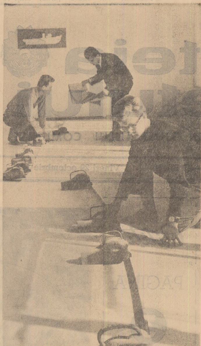
Institutul politehnic Galați. O oră de lucrări practice în sala de trasa a navelor cu studenții anului V al Facultății de nave și instalații de bord.

„Hirtia melaminată produsă de Fabrica din Buzeni, folosită la lipirea plăcuțelor ceramice...“