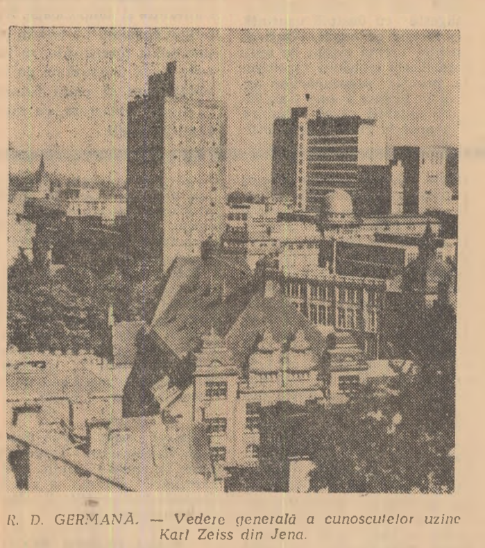
R. D. GERMANĂ. — Vedere generală a cunoscutelor uzine Karl Zeiss din Jena.

Unul din membrii guvernului dominican afirma că țara sa trece „prin cea mai grea perioadă a istoriei sale și nu se întrevede nici o soluție imediată”. Președintele