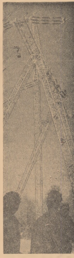
Pe șantierul uneia dintre cele mai importante atiere ale sistemului electro-energetic național — linia de 400 kV Luduș — Slatina — București