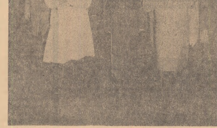
La uzinele „Industria stimei” Cîmpia Turzii.