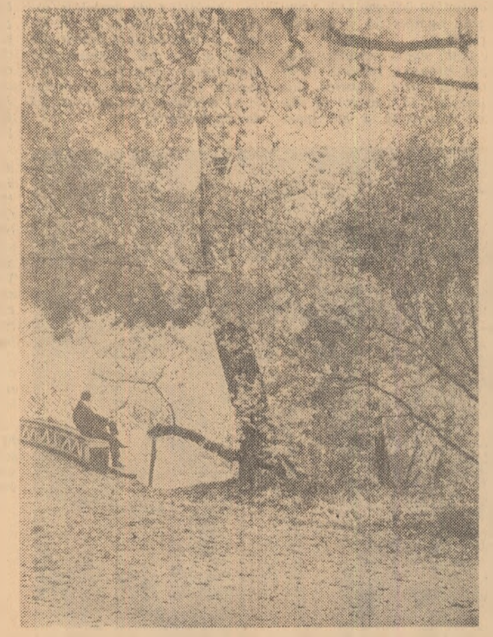
Peisaj de toamnă