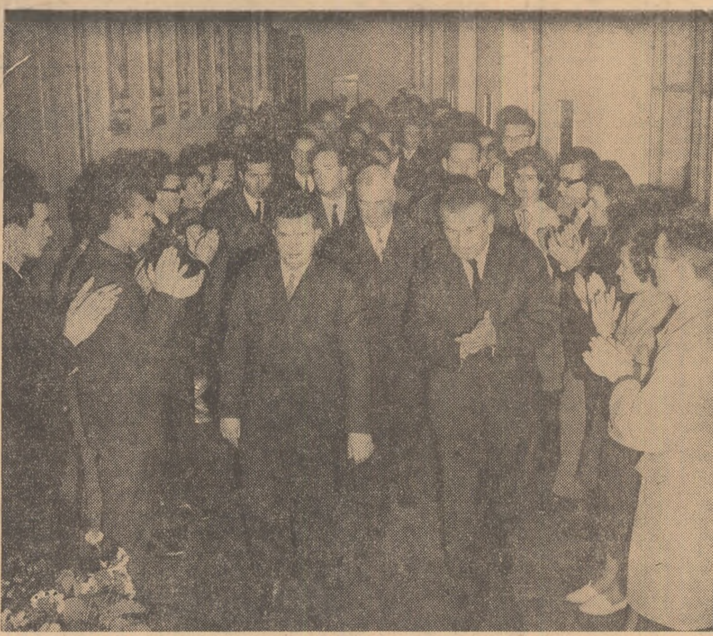
Conducătorii de partid și de stat la Universitatea „Babeș-Bolyai”