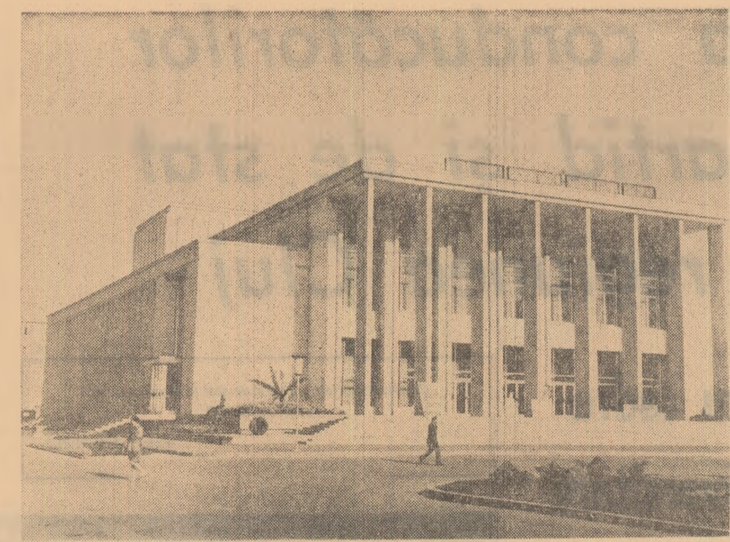
Casa de cultură a sindicatelor din Bacău

Poporul român își aduce propria sa contribuție la creșterea forței și influenței sistemului socialist prin realizările pe care le obține și le obține în construirea noii orînduiri.