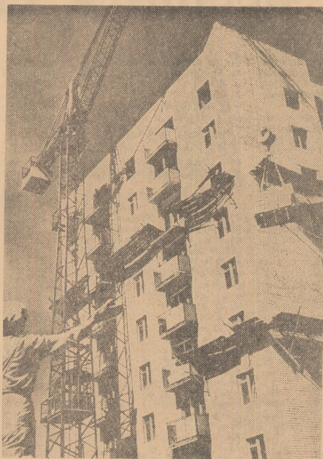
U.R.S.S.: șantier de locuințe în Nijehamsk