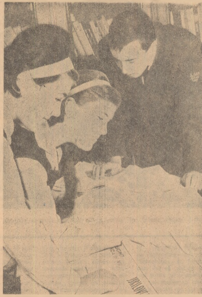
O imagine obișnuită în biblioteca Liceului „Alex. I. Cuza” din Galați.