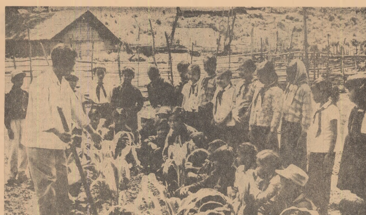
LAOS: lecție practică pe lotul experimental al unei școli primare dintr-o regiune eliberată

Imediat după hotărîrea guvernului sud-ropic, la Londra a avut loc o reuniune extraordinară a Comitetului pentru apărare și pentru probleme externe al Cabinetului britanic, condusă de primul ministru Harold Wilson.