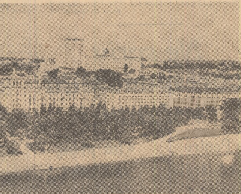
R. P. D. COREEANĂ. — Vedere panoramică din Phenian

În ce privește lucrările comitetelor, trebuie menționată adoptarea unei rezoluții — în Consiliul social — umanitar și cultural — în legătură cu problema „Locuințelor, construcțiilor și planificării” în care se recomandă statelor membre să acorde o atenție deosebită acestei probleme, să creeze organisme centrale care să ocupe de construcția de locuințe.