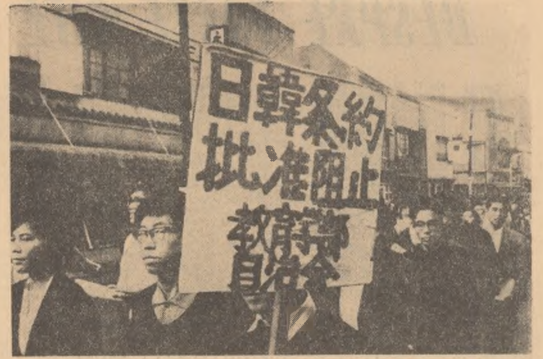
JAPONIA. — La Tokio, ca și în alte orașe ale țării, au continuat demonstrațiile împotriva ratificării tratatului japoano-sud-coreean