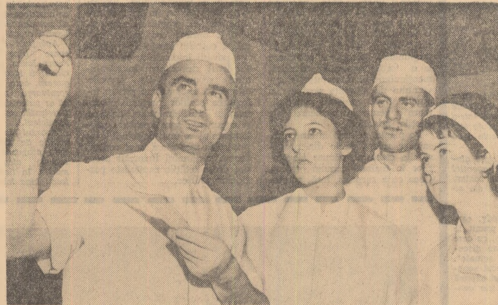
La clinica de chirurgie a Institutului de stomatologie din București