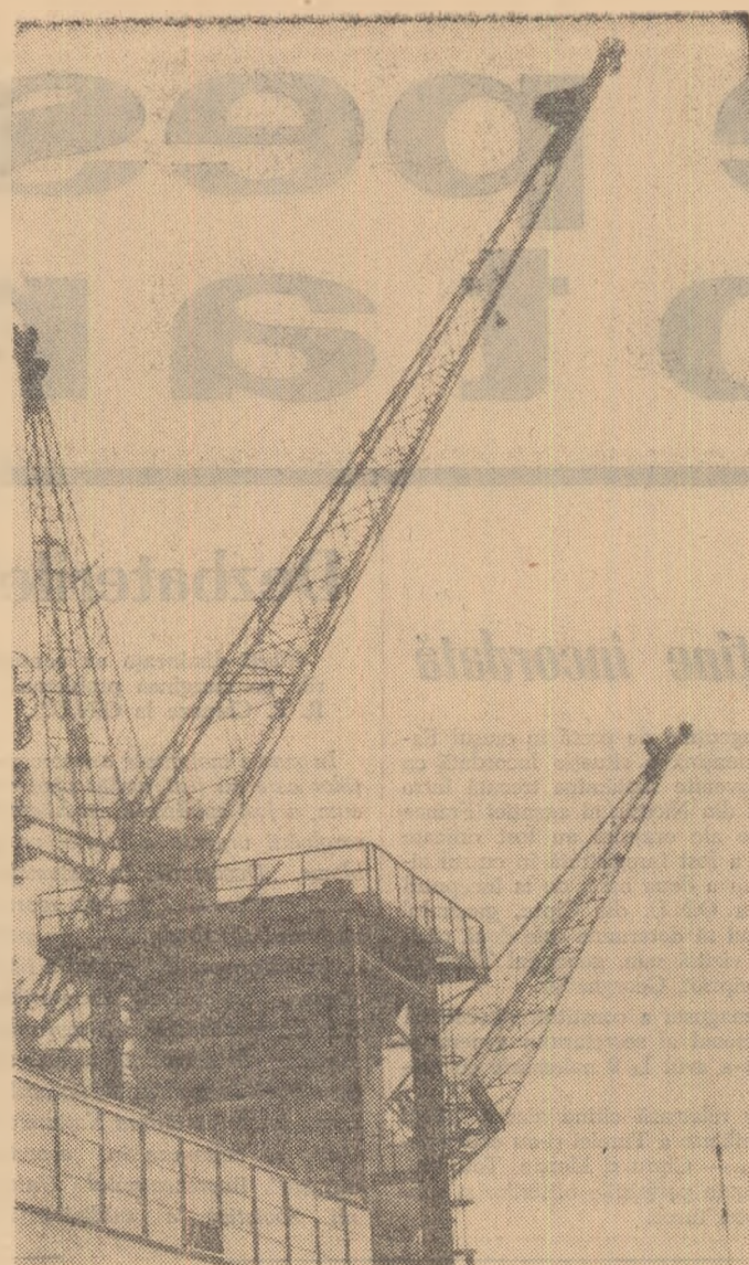
Macarale (Șantierul Combinatului Chimic-Turnu Magurele)