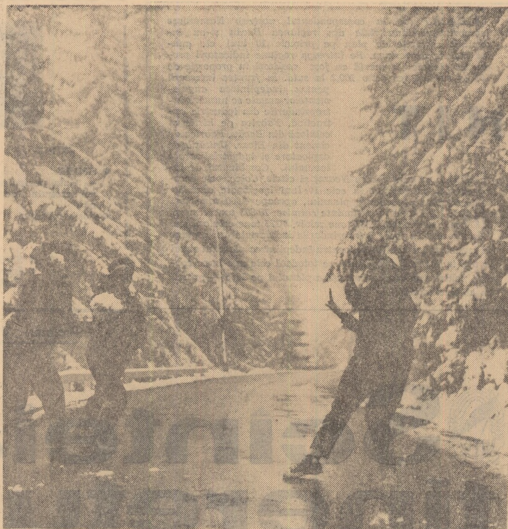
Peisaj de iarnă în plină toamnă. La Lacul Roșu a căzut prima zăpadă

Trușești, raionul Botoșani. La școlile tehnice de maștri mecanici agricoli sînt trimiși cei mai buni mecanizatori, absolvenți ai școlilor profesionale cu o vechime de cel puțin 3 ani în meserie, care s-au dovedit buni organizatori ai producției și care primesc recomandarea unității la care lucrează. Acum, credem că înțelegeți de ce nu pot fi primiți direct la școlile tehnice de maștri, absolvenții școlilor generale de opt ani.