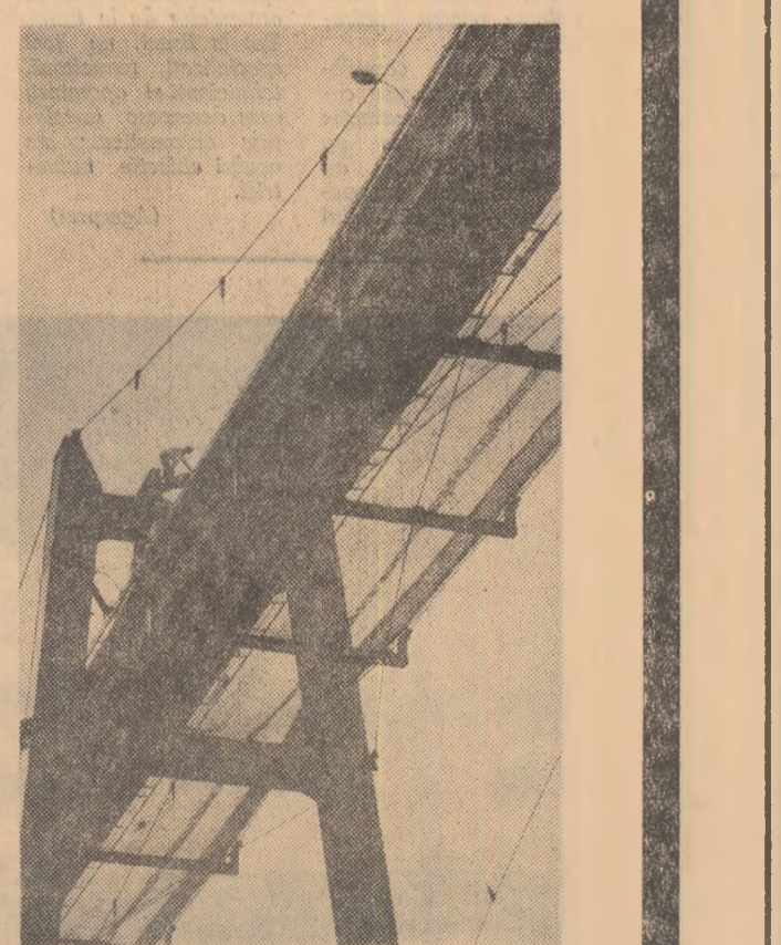
Această dantelărie de fier suspendată la acești de metri înălțime asigură transportul calculului de la cariera Romană Combinatului siderurgic Dej