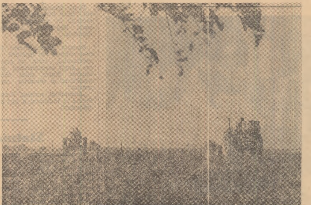
Se adaugă... sportii recentei vizitoare La G.A.S. Robănești, regiunea Oltenia, ogoarele sînt fertilizate cu îngrășăminte chimice