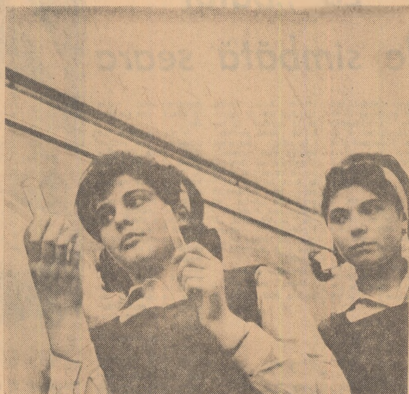
Miraculoasa lume a eprubetei... (oră de chimie în laborator Liceului „Nicolae Bălcescu” din Craiova)

ELEVUL DIN BANCA A TREIA (Continuare în pag. a II-a)