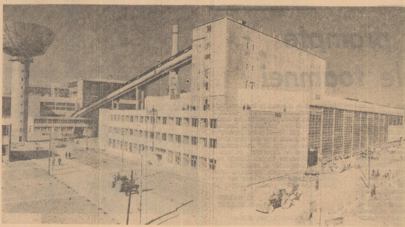
Fabrica de produse retractabile din Alba Iulia. De aici se alimentează zilnic marile combinate siderurgice cu produsele retractabile atît de necesare desăvîșirii normale a proceselor tehnologice