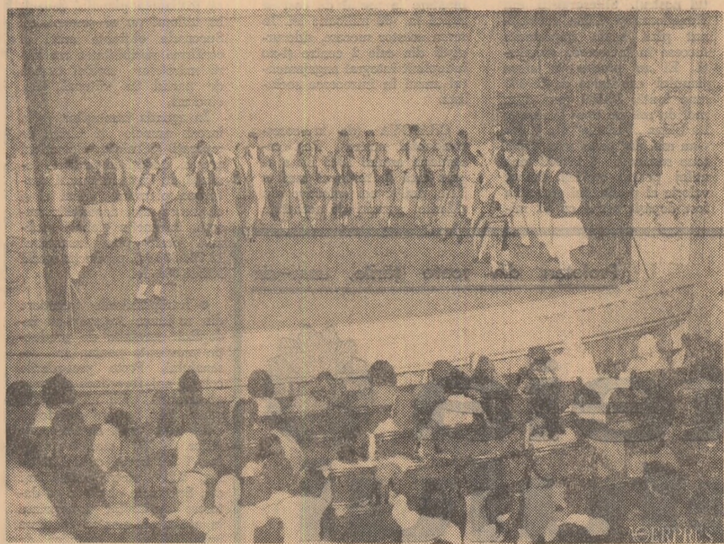
În cadrul emisiunii „Dialog la distanță” dintre regiunile Galați și Dobrogea pe care televiziunea română o va prezenta publicului la începutul lunii decembrie, se fac intense pregătiri. În logorale: aspect de la spectacolul formalei cântărilor culturale din Soveja, prezentat pe scena Casei de cultură din Focșani