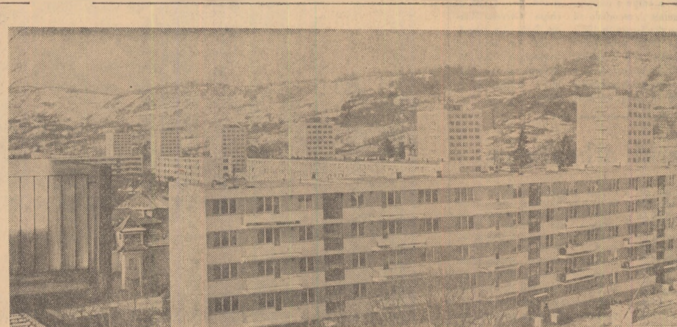
Vedere din cartierul Grigorescu din Cluj