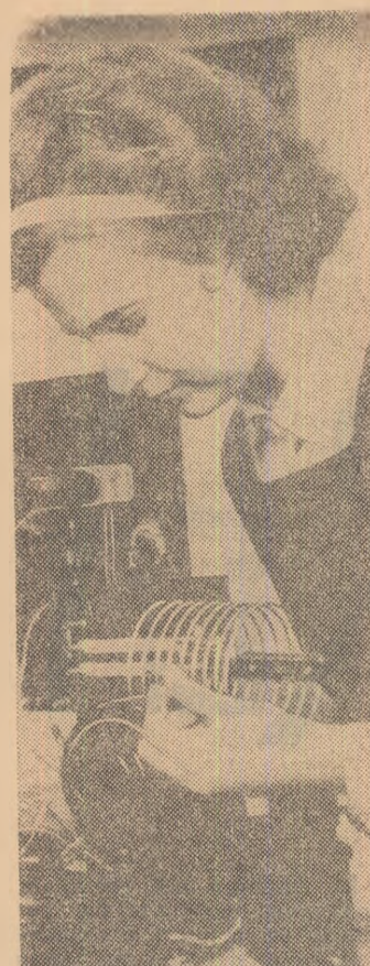
La liziviu drumul spre nota 10...