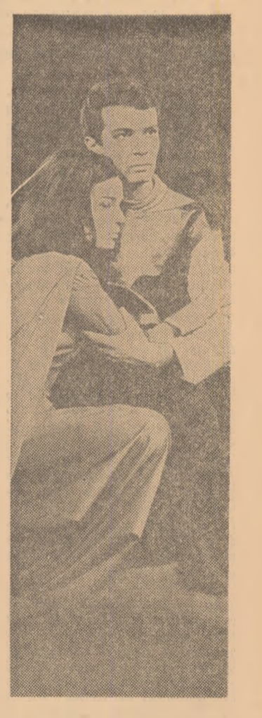
Studioul Institutului de artă teatrală și cinematografică „I. L. Caragiale”, Spectacolul „Ondine” de Jean Giroudoux în interpretarea studenților anului IV B

În legătură cu acest articol, apărut în ziarul nr. 5118 din 16 octombrie 1965, comitetul U.T.C. de la „Feroemal”-Ploiești ne trimite următorul răspuns: „Problemele ridicate în acest articol cu privire la deficiențele manifestate în ceea ce privește aplicarea inițiativei...”