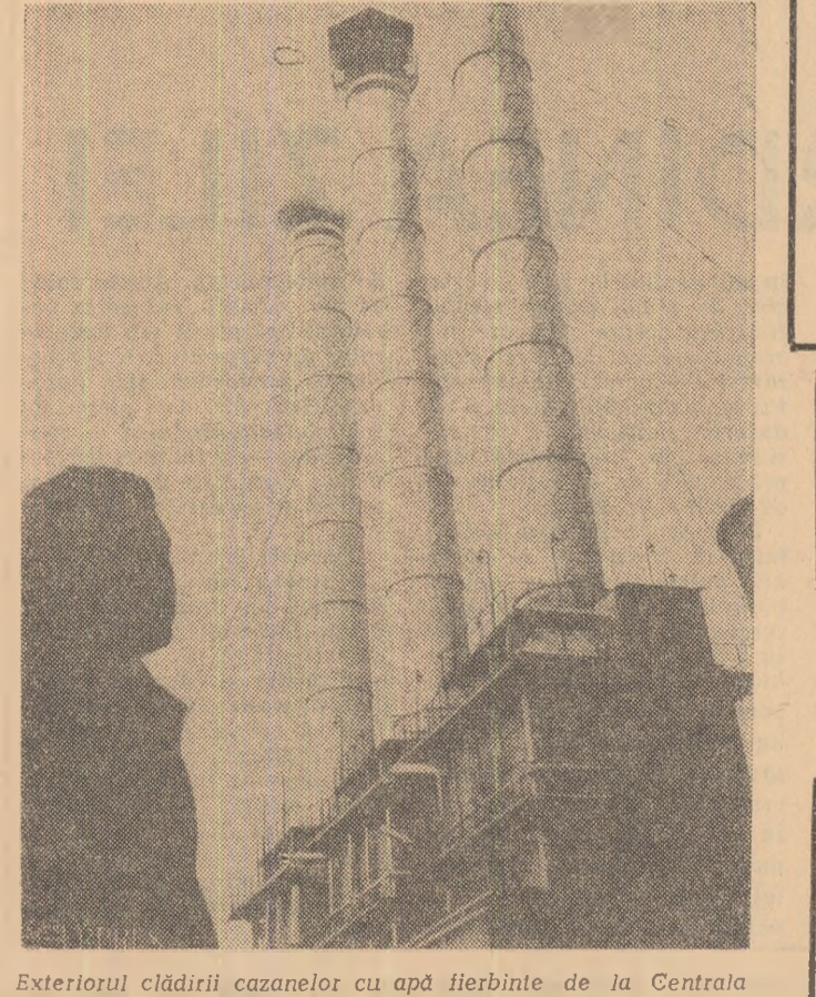
Exteriorul clădirii cazanelor cu apă fierbinte de la Centrala electrică de termoficare-Grozăvești