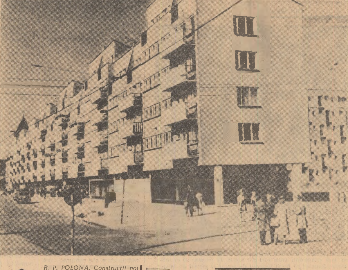
R. P. POLONA. Construcții noi în orașul Wrocław