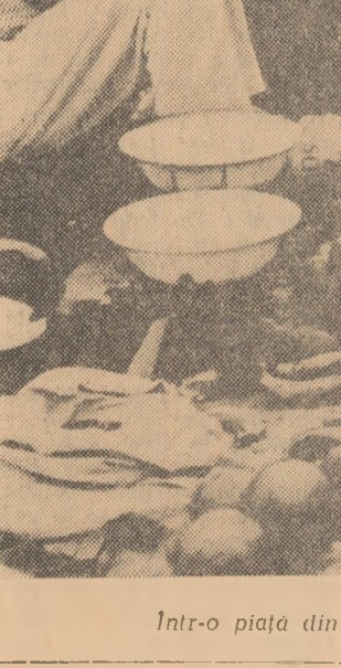
Într-o piață din Congo (Brazzaville)

vut de înfruntat un front format în primul rând din Chile și Mexic. În această situație Statele Unite, lipsite de sprijinul unor țări influente ale Americii Latine, au făcut apel la țăările Americii centrale. O asemenea situație s-a ivit în cursul discuțiilor atribuite Consiliului O.S.A. cind Argentina, Brazilia, Columbia, Chile și Peru au propus scoaterea din atribuțiile acestui consiliu a așa-numitei funcții de „menținere a păcii”, care ar permite amestecul în treburile interne ale țărilor latino-americane.