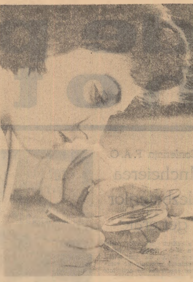
Descifrarea unor vechi documente la arhivele statului

La Teslui, comitetul organizației U.T.C. a sesizat interdependența dintre muncă, producție și retribuție, iar organizația întrecerii socialiste s-a făcut pe fondul cunoașterii, al înțelegerii de către întreaga masă de tineri a logicii acestei interdependențe. În această direcție s-a orientat și munca politică organizația U.T.C. Cu sprijinul consiliului de conducere au fost găsite metodele cele mai potrivite (serii, decalajele, convorbiri, concursuri) de a se explica tinerilor care este potențialul economic actual al cooperativei, creștîndu-se totodată imaginea dezvoltării ei în perspectiva anilor următori.