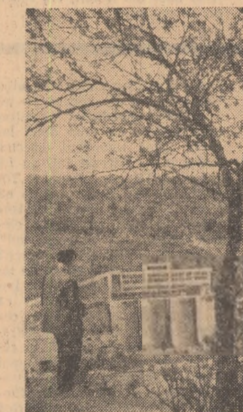
La Teliuc, pe o suprafață de aproape 30 de hectare se înalță halele și instalațiile noi uzine de preparare a minereului de fier