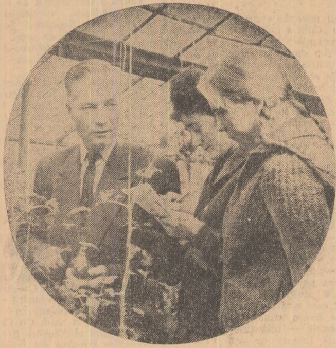
Lecție practică la învățămîntul agrozootehnic. (În seara cooperativei agricole de producție din comuna Lunca, raionul Turda)