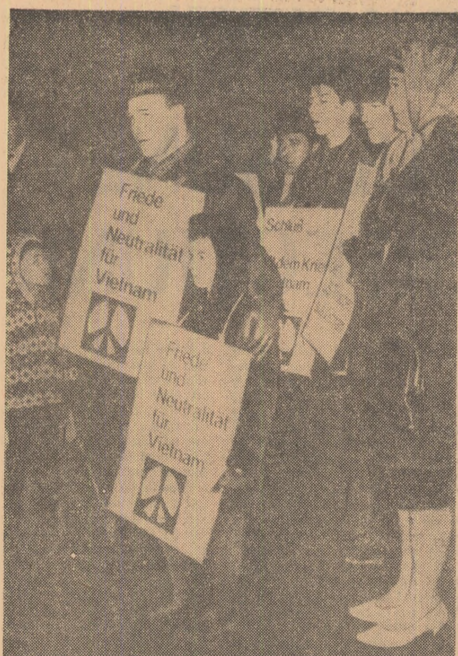
R. F. GERMANĂ. Aspect din timpul unei demonstrații ce a avut loc la Essen, împotriva poliției americane în Vietnam