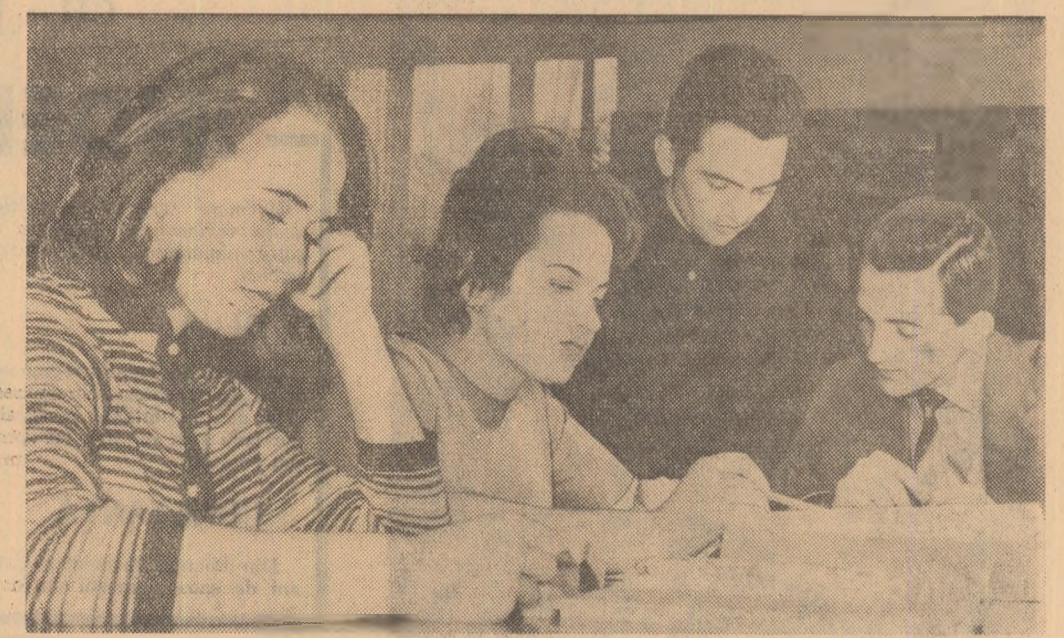
În biblioteca Institutului politehnic-Galați

Am vrut să subliniem numai cîteva inițiative interesante, cu evidentă valoare de generalizare.