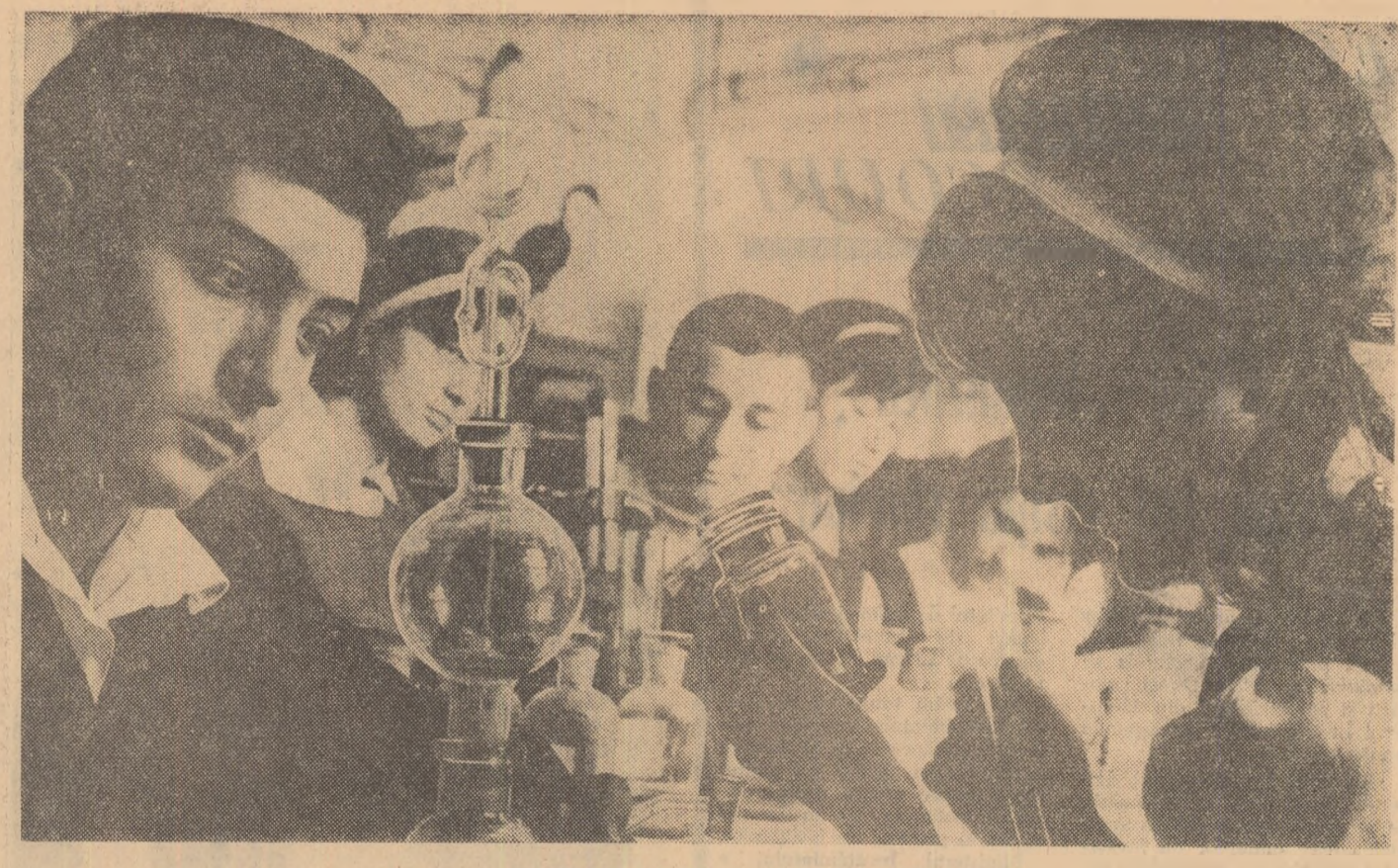
În laboratoare... activitate laborioasă