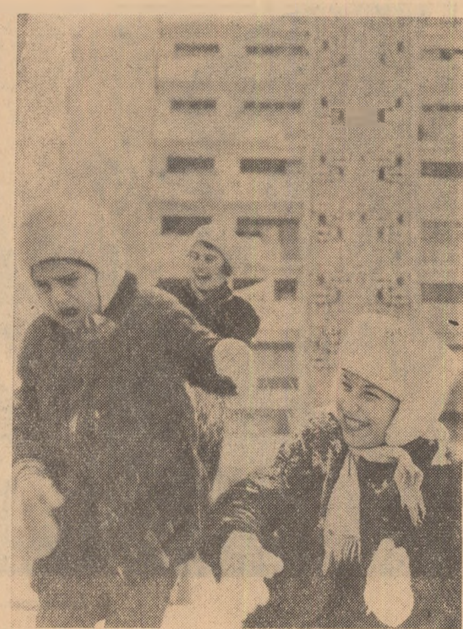
Unul plînge, altul rîde; așa-i la bătaia cu zapada

După comemorarea a 15 ani de la moartea lui Dînu Lipicîi, (în pînă cîte instituțiile muzicale din Capitală nu s-au gîndit să organizeze o manifestare specială dedicată acestui eveniment) muzicienii sînt absoțorii în această săptămîină un veac de la nașterea marelui compozitor finlandez — Jan Sibelius. Orchestra Radio Televiziunii (definiție în această săptămîină a primului loc în emulația pentru întocmirea unui program inedite deschîltătoare de noi orizonturi muzicale — a programat pentru toată seara (parcă a doua a concertului cu II și televiziun) un Festival Sibelius. În program: poemul simfonic „Tapiola“, Concertul pentru vioară și Simfonia a V-a (Dirijor — Em. Elenescu. Soliști: C. Bronzetti), La Filarmonică, o