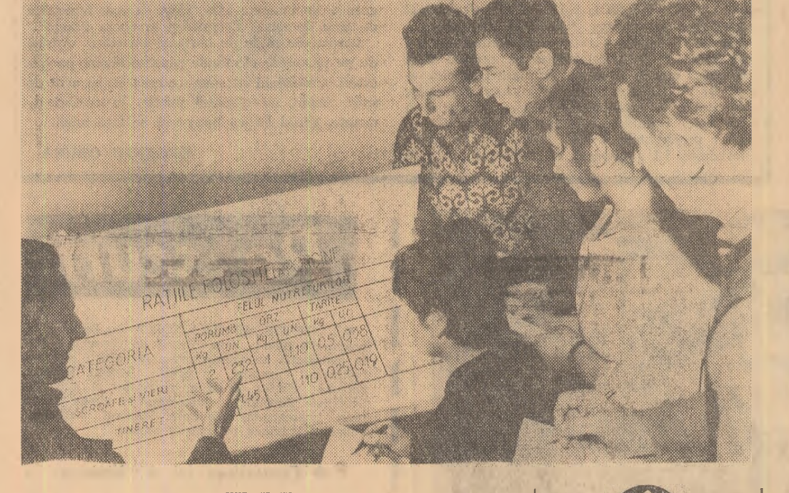
URMĂRI DIN PAG. I

● În turneul final al campionatului republic