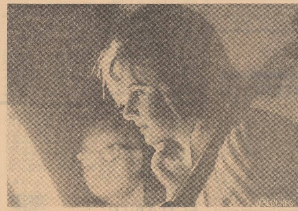
Studiu la violoncel

PITEȘTI (de la corespondențul nostru). La cele 11 stații de mașini și tractoare din regiunea Argeș se va adăuga zilele acestea încă un S.M.T. modern, construit în comuna Scormiești, raionul Slătina. Pînă acum la acest S.M.T. s-a terminat finisajul exterior al