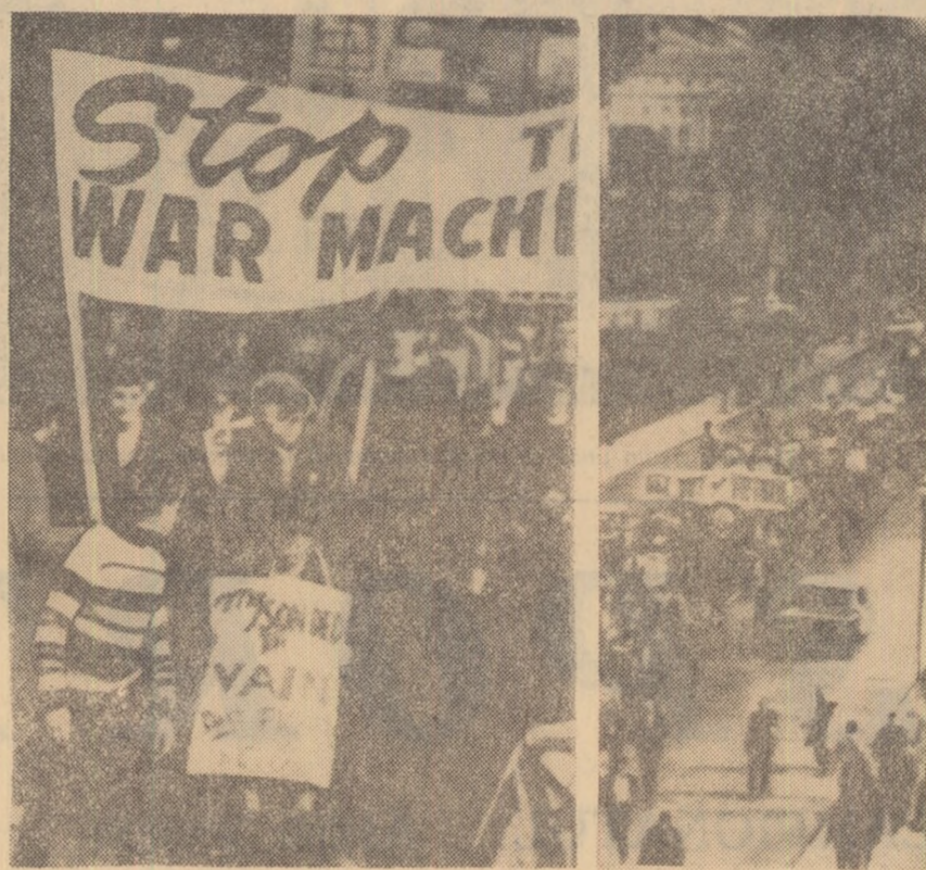
S. U. A. — Pe străzile orașului Berkeley a avut loc o demonstrație împotriva politicii americane în Vietnam. În fotografie: Aspecte de la demonstrație

În legătură cu faptul că Prezidiul C.C. al P.C.U.S. a considerat că este util ca Aleksandr Șelpin să-și concentreze activitatea în Comitetul Central al partidului, Sovietul Suprem al U.R.S.S. l-a eliberat din funcția de vicepreședinte al Consiliului de Miniștri al U.R.S.S.