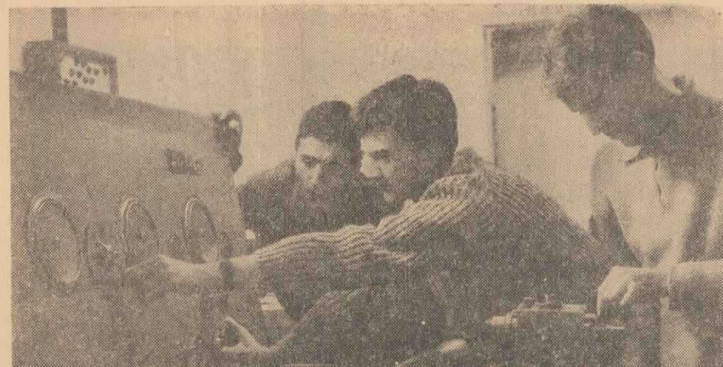
Studentii ai Facultății de mecanică din Cluj — anul IV — lucrînd în laborator. În stînga de la mijloc aparatele hidraulice al mașinilor-tinere