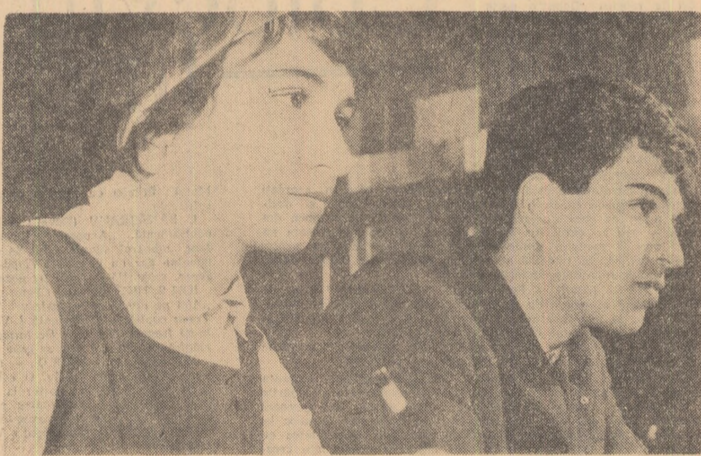
O nouă lecție de matematică...

ELEVUL DIN BANCA A TREIA (Continuare în pag. a III-a)