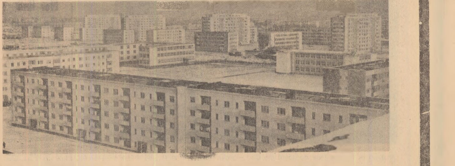
Cartierul de locuințe Nord din Ploiești