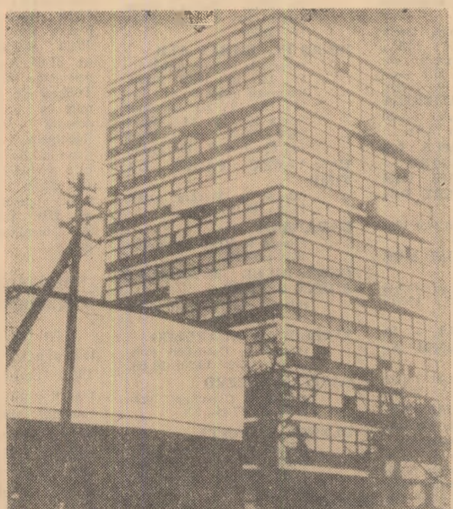
R. S. F. IUGOSLAVIA. Clădirea Adunării Municipale a districtului Belgrad