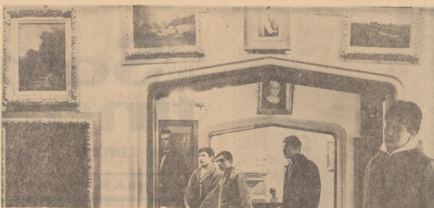
Prezențe obișnuite în sălile muzeului Zambaccian

De asemenea în cele două secții i obiecte sanitare și plaja ceramic au fost repartizați încălțuși, electricieni și instalatori necesari pentru întretinerea curentă a instalațiilor și agregatelor.