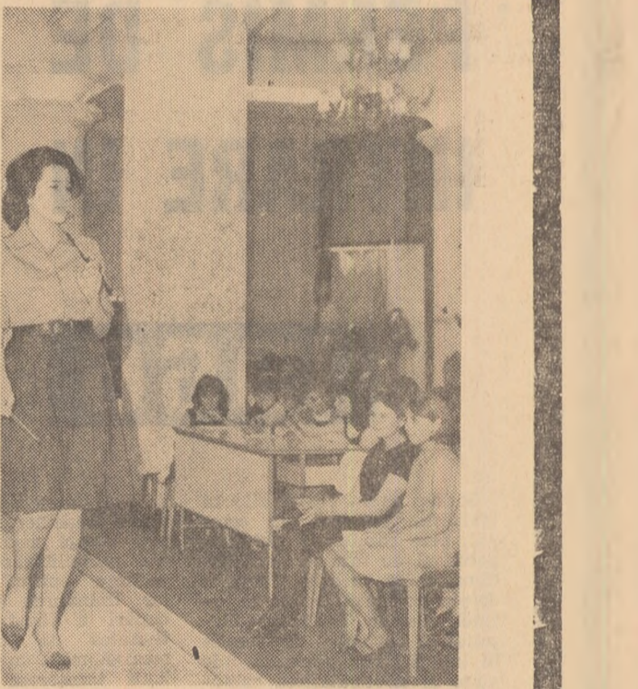
În timpul prezentării unor noi modele la Fabrica de conecții „București”