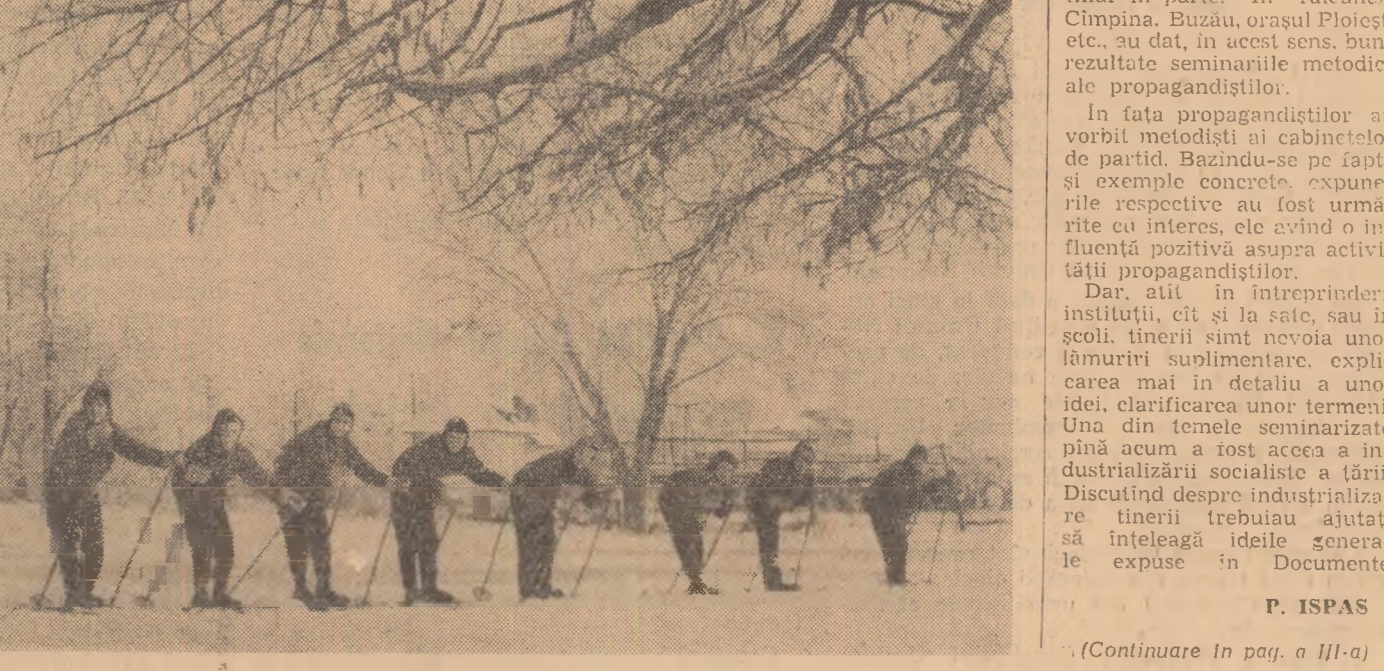
... (Continuare în pag. a III-a)

Am văzut din plin activitatea pe 1000 de cercuri politice U.T.C., în care studiază mai bine de 31.000 de tineri. Au fost organizate, totodată, 661 cicluri de conferințe pentru aproximativ 40.000 de tineri.