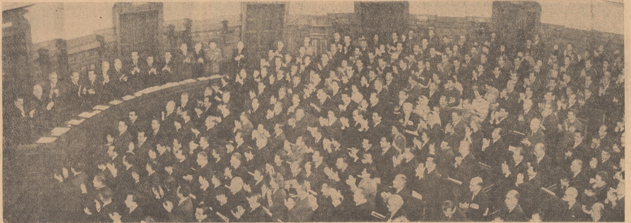
În timpul sesiunii de închidere a lucrărilor sesiunii Marii Adunări Naționale