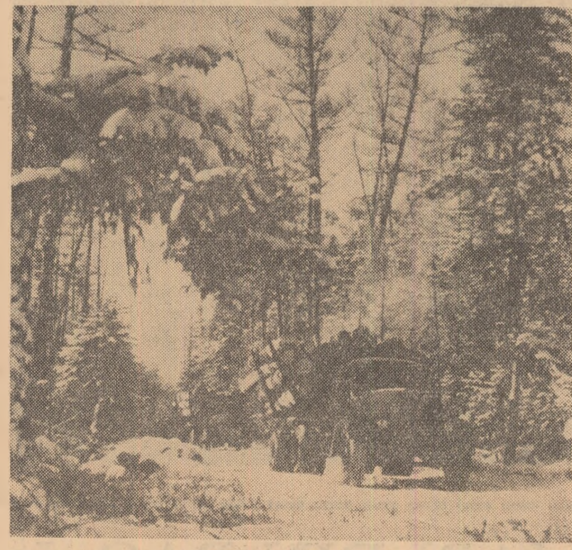
R. P. CHINEZA. — Peisaj de iarnă din Munții Khingnan

La Saigon a fost dat publicității un ordin scris de generalul Westmoreland, comandantul forțelor armate americane din Vietnam și generalul Lynch Duang Vien, șeful statului maior al trupelor saigonese, în care se arată că în secolera sâmbătorilor de țară, ostilitățile din Vietnamul de sud vor înceta timp de 30 de ore începînd de la 24 decembrie. În acest fel, se răspunde la propunerea Frontului Național de Eliberare din Vietnamul de sud, care a făcut cunoscut că în ziua de 24 decembrie forțele de eliberare națională nu vor întreprinde nici un fel de operațiuni ofensive.