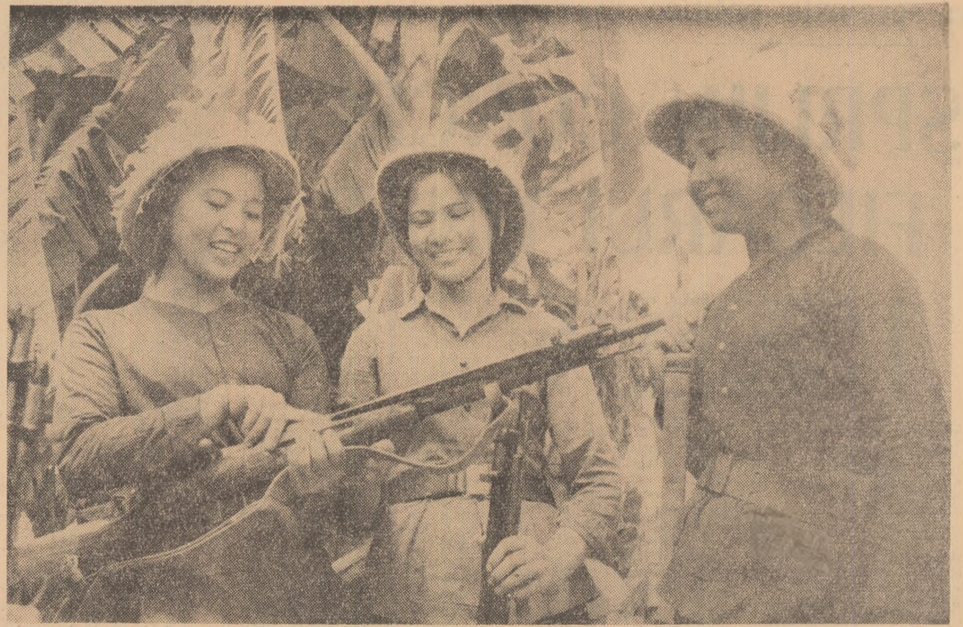
R. D. VIETNAM. — Tinere încadrate într-o subunitate a miliției populare din provincia Thanh Hoa, în timpul pregătirii pentru mînuirea armelor