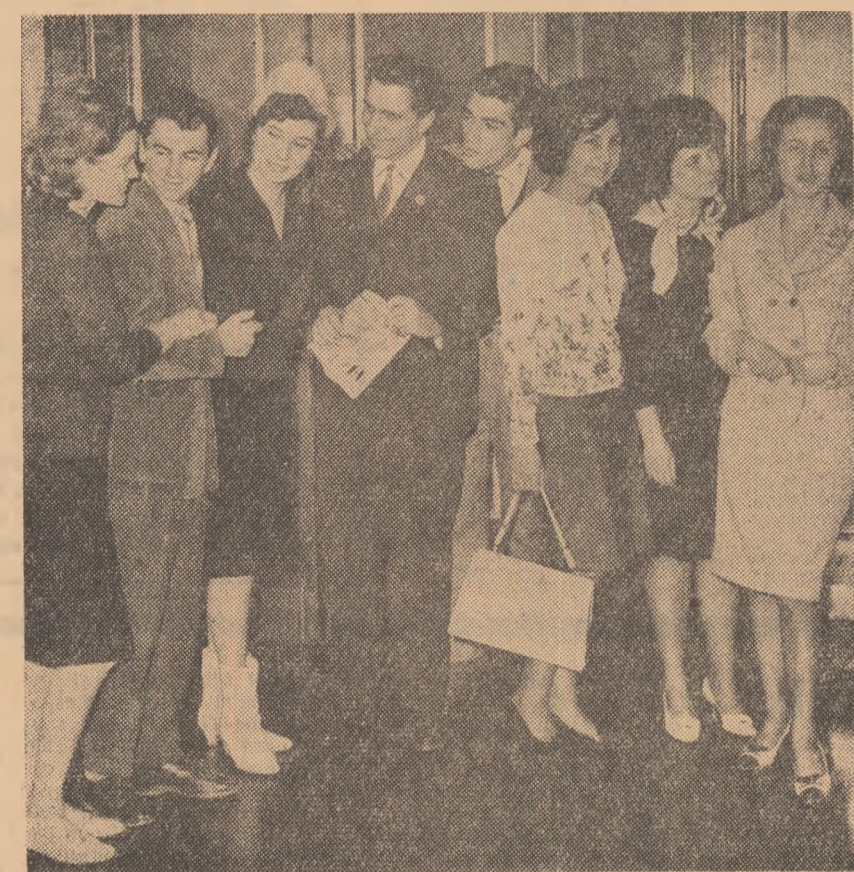
Echipa de teatru a Găseli de cultură a raionului Grivița Roșie din Capitală care a obținut premiul I la finala bienalei de teatru „I. L. Caragiale”