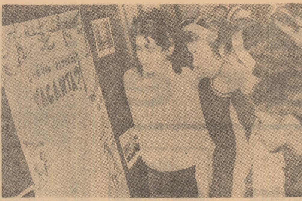
Cum vom petrece vacanța? Elevii Școlii de 8 ani „Petre Ispirescu” din Capitală primesc răspunsul din programul acțiunilor cultural-sportive alșat în holul școlii

Cocteil oferit de ambasadorul Uniunii Sovietice în Republica Socialistă România