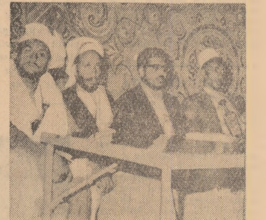
În zilele Conferinței de la Haradh

Negocierii yemeniți se vor reîntoarce la Haradh sau, la sfîrșitul Ramadanului, se vor îndrepta către