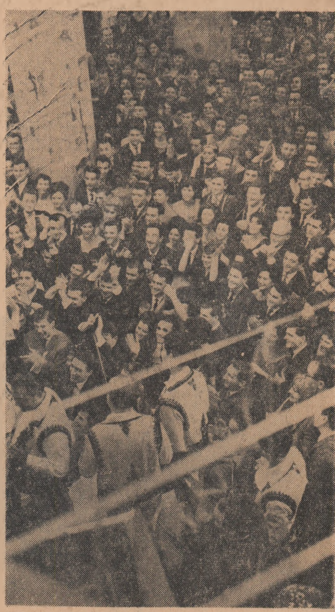
Un personaj pretutindeni prezent: veselia

Ovațiile și aclamațiile entuziaste cu care au fost întâmpinați conducătorii partidului și statului, au durat minute în șir. Au fost momente pline de emoție, care au dovedit încă o dată dragostea și respectul tînerei generații și patriei pentru conducătorii poporului, sentimentele fierbinți de multumire purtate partidului și statului pentru grija pe care o acordă tineretului. În această atmosferă de mare însuflețire, tovarășul Nicolae Ceaușescu a felicitat călduros organizația tineretului comunist, Comitetul Central al U.T.C., întregul tineret al țării noastre, urîndu-le un an rodnic, succes în contribuția adusă la opera de desăvîrșire a construcției socialiste în țara noastră. Cuvintele secretarului general al C.C. al partidului nostru au fost primite de tineri cu îndelungi ovații, într-o atmosferă de entuziasm general, de puternică afirmare a hotărîrii de a urma îndepărtate îndemnul partidului.