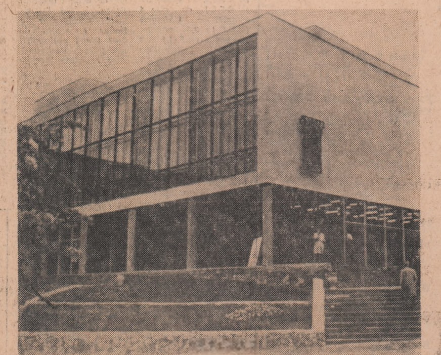
U.R.S.S.: Noua construcție a Palatului de cultură din Vilnius