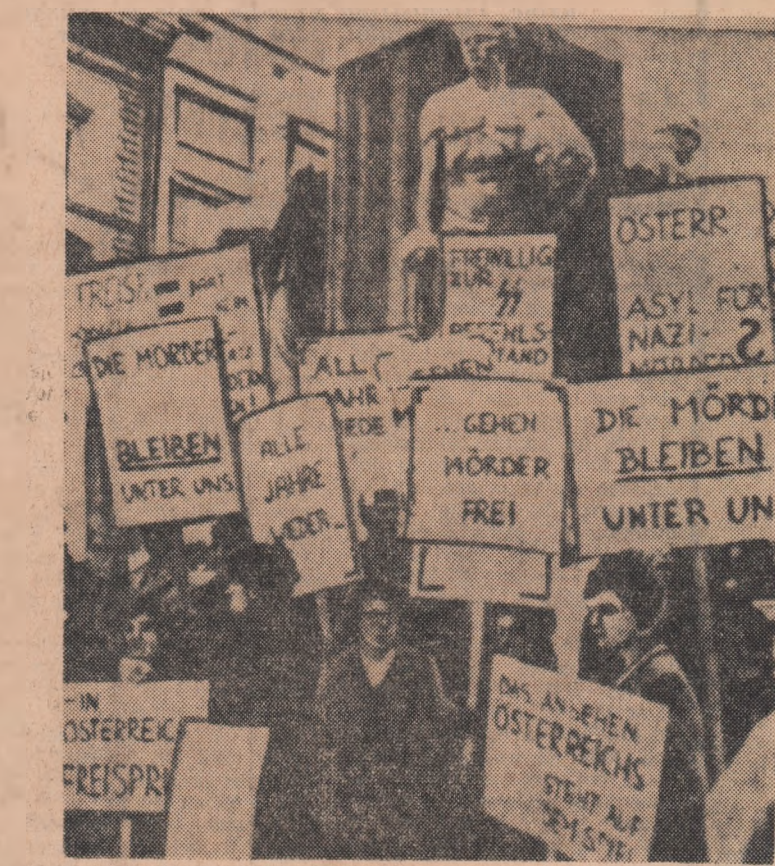
VIENA: Aspect de la demonstrația studenților din capitala austriacă, împotriva achitării fostului comandant S.S. al trupelor de ocupație hitleriste din Belgia, Verbelen

Lucrul cel mai principal este să se găsească drumul just de luptă a fiecărui popor. Acest lucru îl poate face numai poporul însuși.