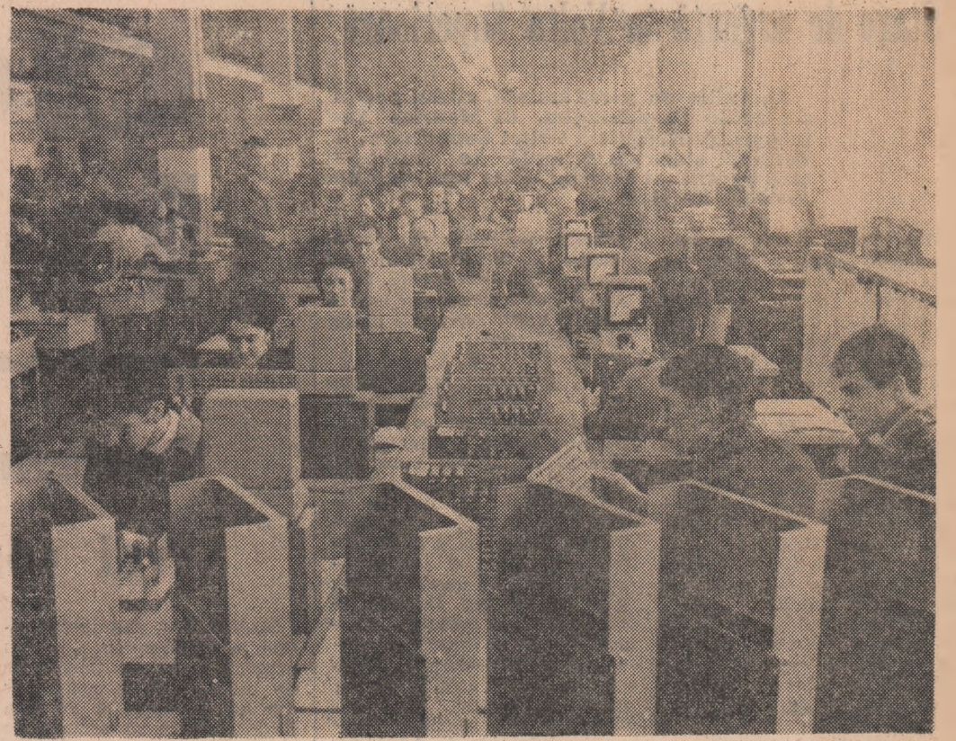
Încă din primele ore ale anului 1966, colectivul întreprinderii „Electromagnetica” din Capitală a pornit cu avînt sporit la realizarea sarcinilor de plan din prima lună a anului.

— 9,6 milioane kW/ore, ne răspunde tov. inginer Ștefan Gust de la tabloul central de comandă. Sîntem deja cu ceva peste plan. Fotodată am furnizat și vecinilor dela combinatul chimic aburul necesar, care se ridică la 100 metri cubi.