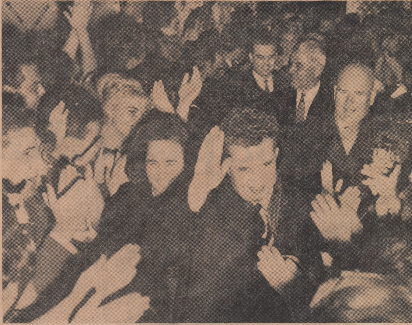
Reporterii noștri relatează despre:

Cu bucurii, cu optimism întreaga țară a sărbătorit REVELIONUL 1966