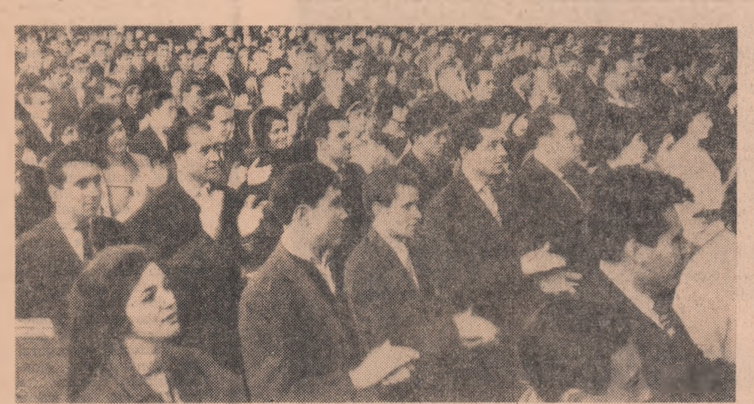
În timpul Conferinței organizației regionale Bucuresti a U.T.C.

Împărțind detaliu din experiența muncii de cercetare științifică a studenților, participanții la discuție au subliniat că, alături de cadrele didactice, un rol de seamă în îndrumarea și organizarea activității de cercetare științifică revine asociației studenților. Aportul asociației nu trebuie să se reducă numai la mobilizarea studenților și la antrenarea acestora în cercetarea științifică. Va trebui să se intensifice mai mult activitatea în direcția dezvoltării răspunderii studenților față de munca pe care o desfășoară în cercuri, în direcția dezvoltării pasiunii pentru cercetarea științifică.