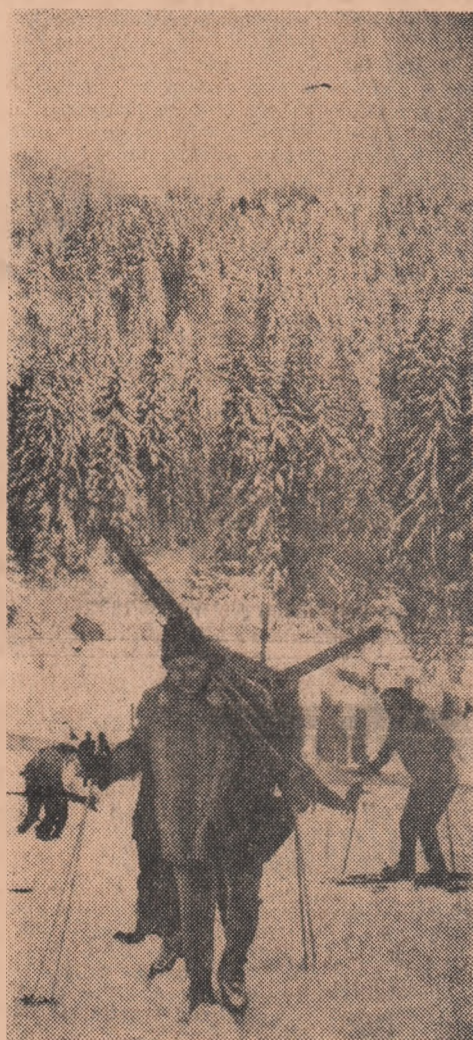
În drum spre pîrtia de schi