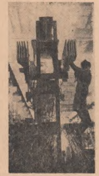
R. S. CEHOSLOVACIA: Vederea de la Fabrica de aluminiu din Zlarnod Hronom (Slovacia)

O altă acțiune antisegregaționistă a avut loc la un institut de învățămînt superior din Birmingham, Alabama. Sute de studenți negri de aici au protestat împotriva atitudinii ostile a administrației institutului față de militanții pentru drepturile civile ale populației de culoare.