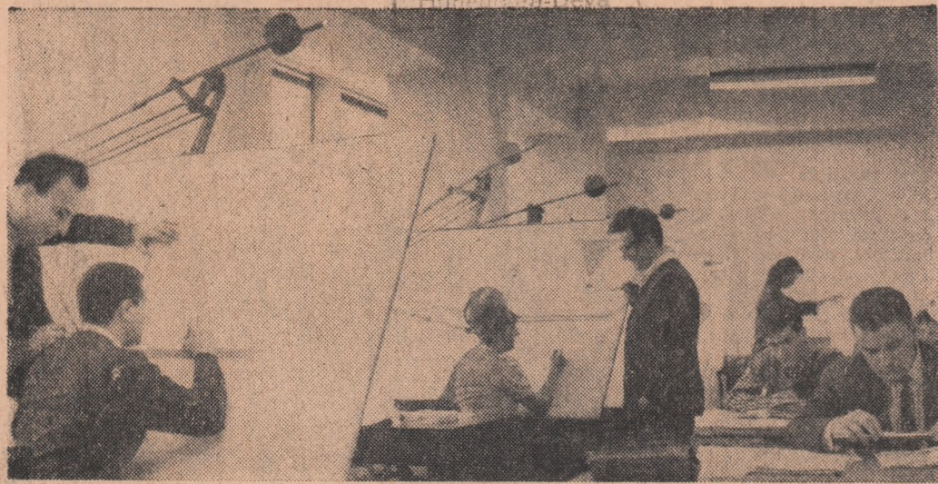
În atelierul de proiectări-automatizări pentru industria minieră din Institutul de proiectări pentru automatizare din Capitală