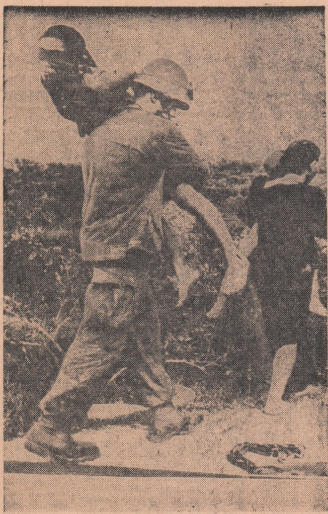
VIETNAMUL DE SUD: La Da Nang, în timpul recentelor „operații de curățire”, soldații americani ridicînd o temelie suspectată de colaborare cu forțele patriotice

● ÎN ajunul plecării sale în U.R.S.S., E. Shina, ministrul afacerilor externe al Japoniei, a declarat unui corespondent al ziarului „Izvestia” că „în ultimul timp între Japonia și Uniunea Sovietică se intensifică neîntrerupt schimbul de delegații, se largesc relațiile culturale. Pe această bază sînt rezolvate treptat problemele deschise, se dezvoltă cu succes comerțul”.