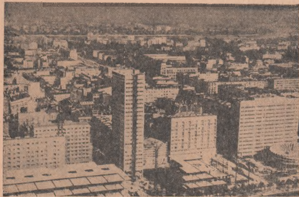
R. P. POLONĂ: Noi construcții de locuințe la Varșovia

Associated Press anunță că la circa 100 km sud de Saigon în zona de luptă din delta Mekongului, a fost doborît un avion american. Cei doi piloți aflați la bord au murit.