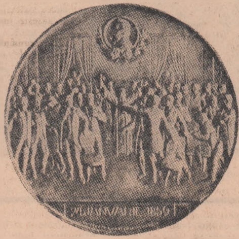
Seal or stamp related to the historical context of the article.