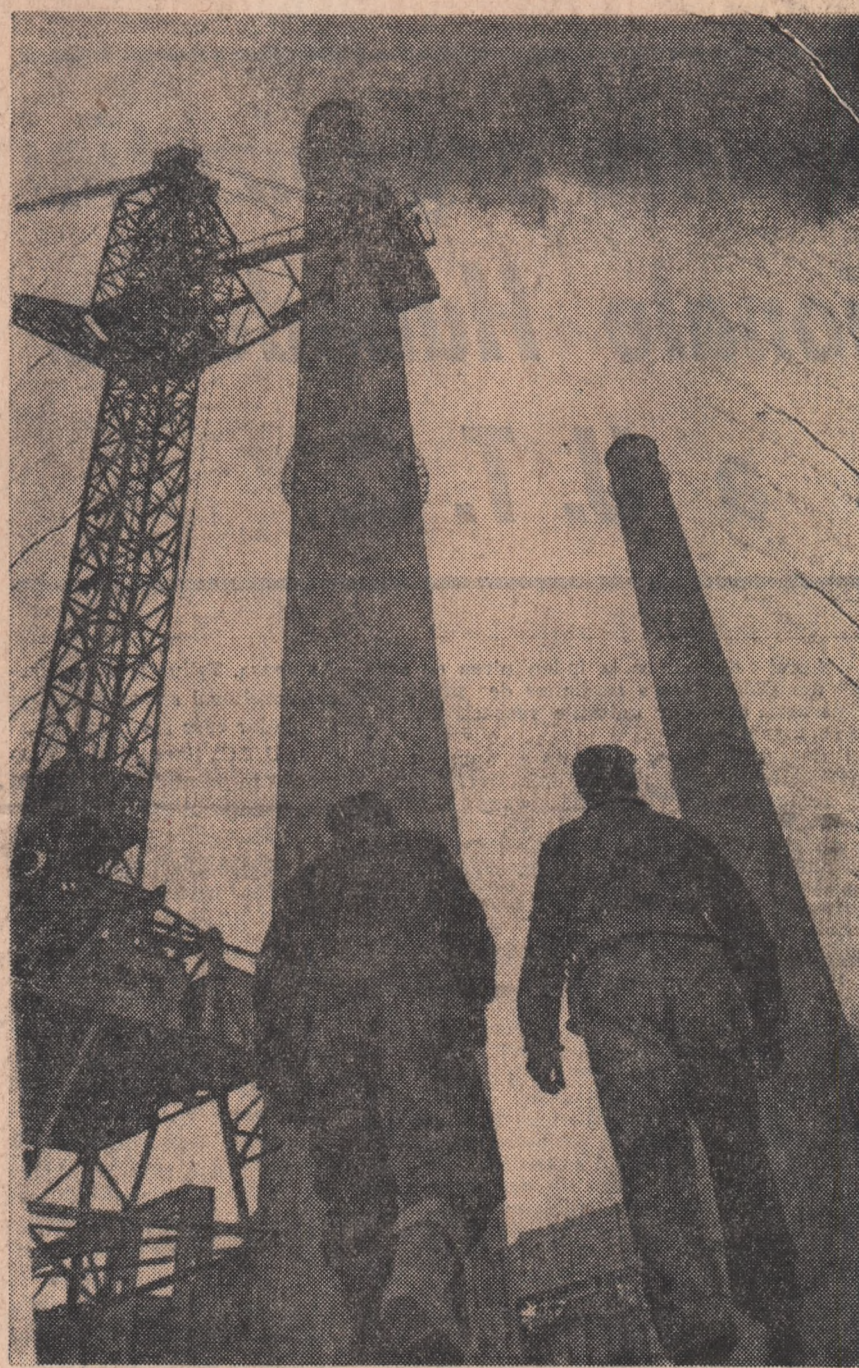
Vălduții de fum indică zi și noapte că primul grup generator de 50 MW, intrat în funcțiune de curînd la Termocentrala București-sud, lucrează din plin.

Construcții de vagoane din Arad au încheiat anul 1965 cu un bilanț rodnic, realizînd integral sortimentele planificate și contractele încheiate. Pășind în primul an al cincinalului, ei au tradus în fapte încă din primele zile hotărîrea fermă de a se achita cu cinste de sarcinile pe care partidul le-a pus în față, de a înzestra transporturile feroviare cu material rulant modern, avînd parametri tehnici din ce în ce mai ridicați. Acordînd cea mai mare atenție organizării superioare a producției, colectivul uzinei a urmărit chiar din prima zi îndeplinirea ritmică a planului la toate sortimentele.