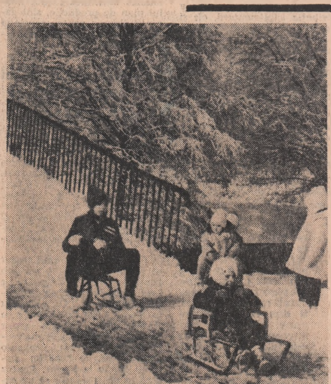
La săniuș în Parcul Herdsträu

CITIȚI în pagină a II-a Conferința organizației regionale Hunedoara a U.T.C.