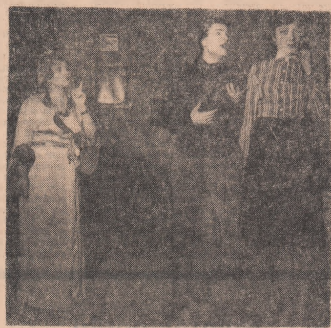
Scenă din noua premieră cu piesa „Idolul și Ion Anapoda” de G. M. Zamfirescu, în interpretarea colectivului Teatrului Național din Iași

Cu ocazia celei de-a 17-a aniversări a Tratatului de prietenie, colaborare și asistență mutuală între Republica Socialistă România și Republica Populară Polonă, tovarășul Corneliu Mănescu, ministrul afacerilor externe, a trimis o telegramă de felicitare tovarășului Adam Rapacki, ministrul afacerilor externe al Republicii Populare Polone.