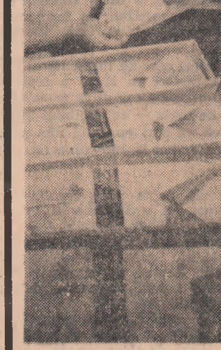
Noile modele de cămăși de nylon confecționate la Întreprinderea „Tricotajul roșu” din București vor lua drumul magazinelor în această lună

„Posibilitățile care stau la îndemna organizațiilor U.T.C. din unitățile industriale, miniere, din construcții, de a mobiliza pe tineri la îndeplinirea sarcinilor de producție sînt multiple. Cu toate acestea, acțiunile pe care și le propun organizațiile U.T.C., cuprind sensul destul de restrîns. Ce trebuie să facă organizațiile U.T.C.? Așa cum precizează Documentele Congresului al IX-lea al P.C.R., organizațiile U.T.C. trebuie să pună în centrul atenției contribuția la pregătirea profesională a tinerilor, la ridicarea calificării acestora, la organizarea producției și a productivității muncii. O atenție tot așa de mare trebuie să acorde organizațiile noastre la realizarea unei permanente propagande tehnice, antrenînd în acest sens mai activ cadrele tehnice la organizarea de simpozioane, sesiuni științifice, lectorate tehnice. Anul acesta se împlinesc 45 de ani de la crearea Partidului Comunist Român, pă-