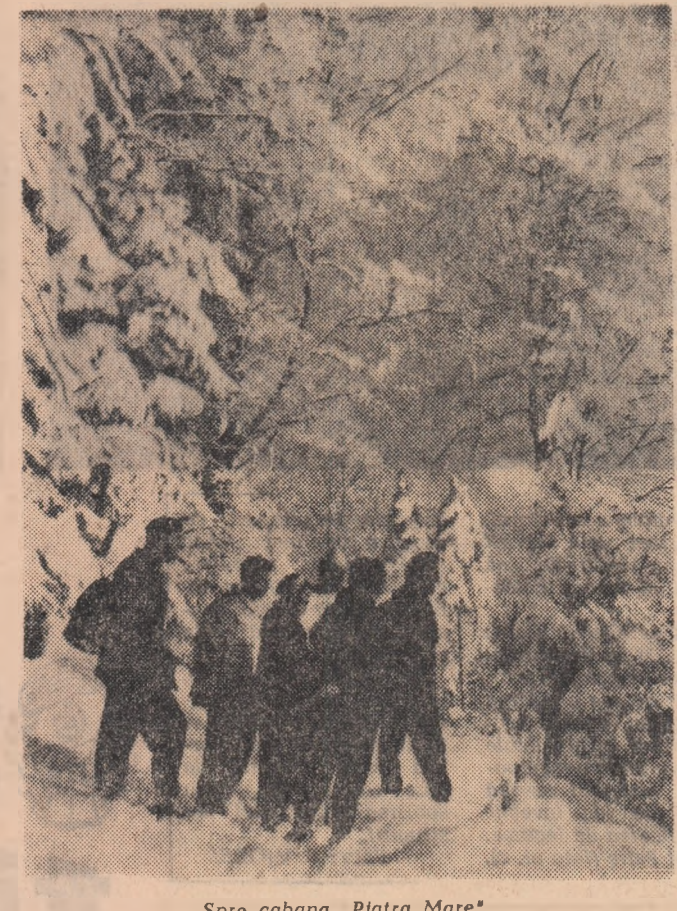
Spre cabana „Piatra Mare”