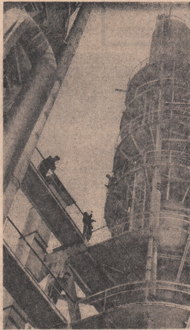
Înălțimea amețitoare a coloanelor de absorbție ale Fabricii de acid azotic din cadrul Combinatului chimic Craiova nu-l intimidă pe constructor.

La elaborarea proiectelor centralei hidroelectrice de pe râul Lotru, specialiștii români au prevăzut concentrarea debitelor mai multor râuri învelinate într-un lac de acumulare care să permită, totodată, și amenajarea unei căderi importante, folosirea unor puternice stații de pompă pentru aducerea în lac a unor afluenți, construirea unui baraj de mare înălțime cu material local, extinderea mecanizării la construcțiile subterane.