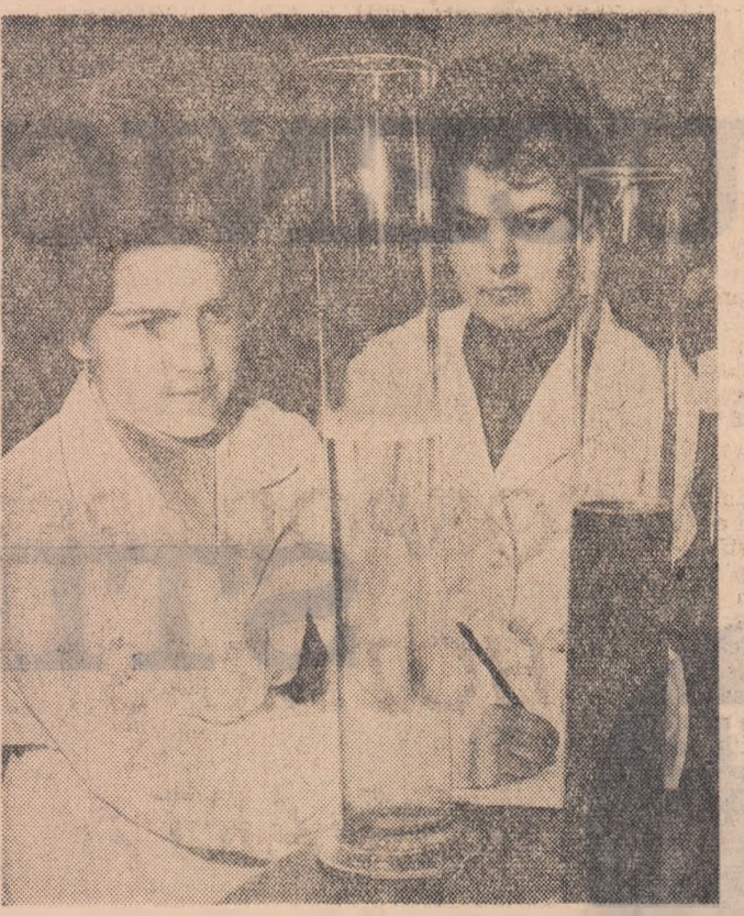
În cunoscuta podgorie, Panču, vinurile sînt selecționate pentru a fi puse la învecchi...

„Lupte grele” la mesele de șah (Clubul Școlii profesionale de pe lângă Uzina mecanică-Sinola)