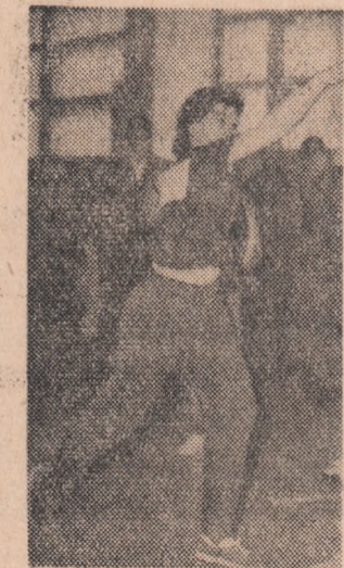
In timpul probei de aruncare a greutății-junioare