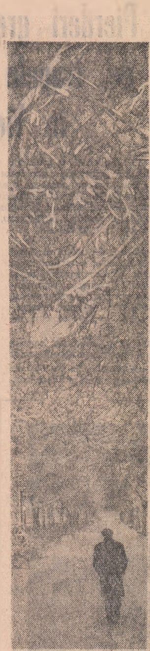
Zile de iarnă în București

Și nu știu să mă-nțorc și unde S-adorm ca șerpii mici între secunde.