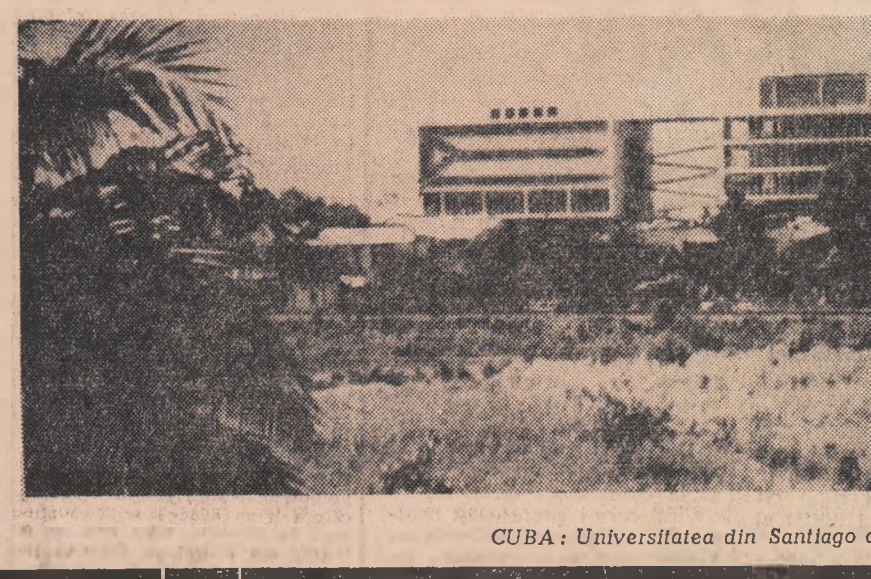
CUBA: Universitatea din Santiago de Cuba