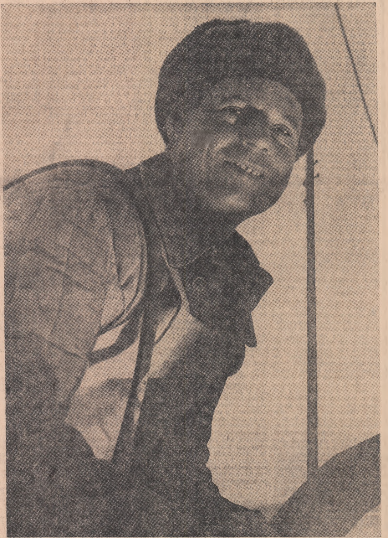
Unul din cei 10.000 de tineri constructori de pe șantierul Combinatului siderurgic „Gh. Gheorghiu-Dej” Galați.