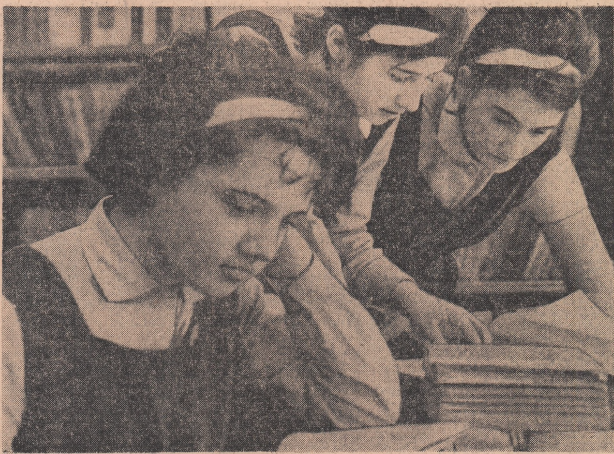
Aspect din biblioteca Liceului „N. Bălcescu” din Craiova

ADUNĂRI GENERALE DE DEZBATERI ÎN COOPERATIVELE AGRICOLE DE PRODUCȚIE