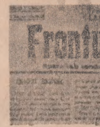
Primul număr din ziarul „Frontul unic” al muncitorilor petroliști

Sunetul sirenei se răspîndea ca o chemare peste întreg orașul și satele învecinate. Au venit în ajutorul greviștilor de la „Astra Română” muncitorii de la „Româno-Americană”, „Dacia-Română”, „Unirea”, textilele de la „Doro-