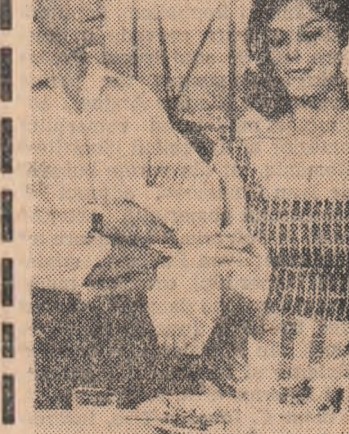
Cadru din filmul „Depășirea“

MARILYN rulează la Dacia, orele 9,30—14 în continuare; 16,15; 18,30; 20,45.