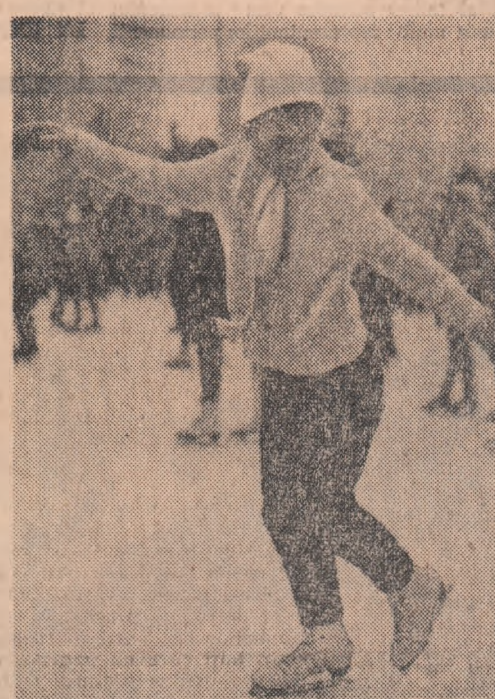
Pe oglinda de gheață a patinoarului de la Floreasca