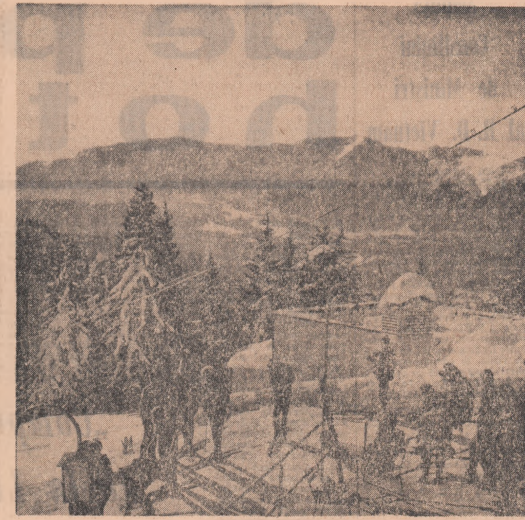
Popas la cabana Cristianu Mare